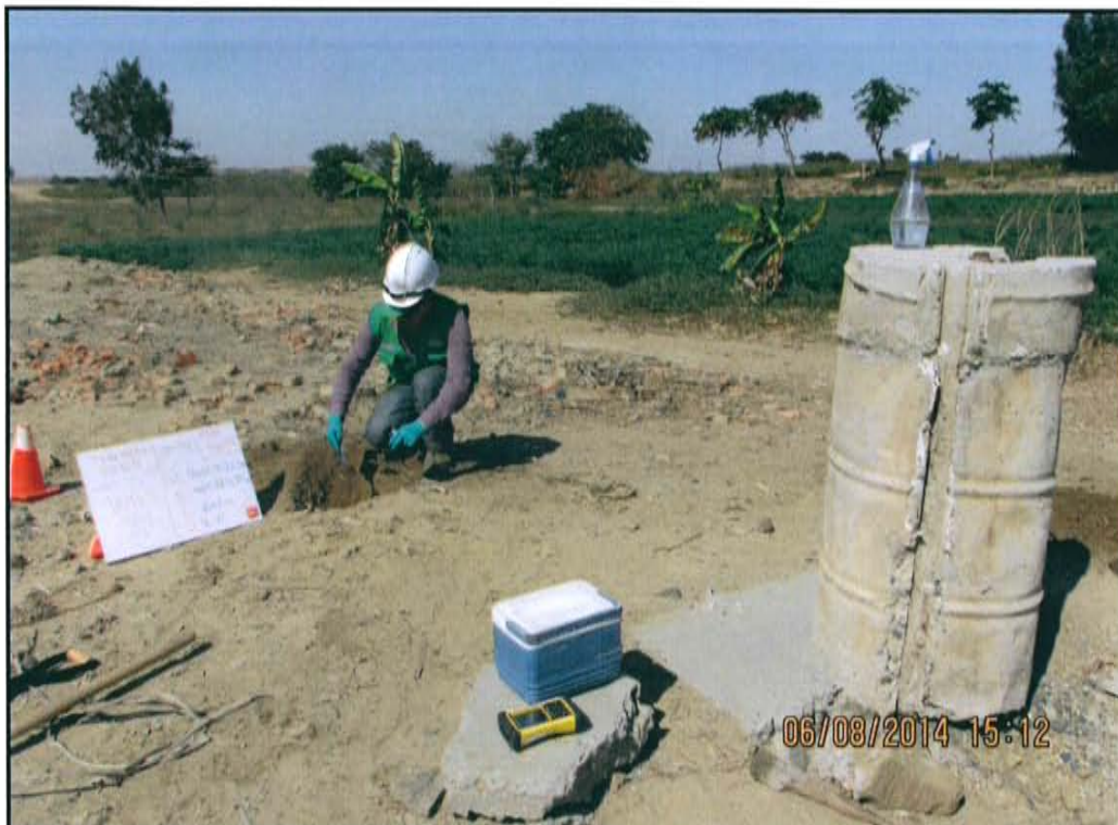
Fotografía N° 4. La muestra de suelo F01678-SU02 se tomó a 3,85 m de distancia del Pozo T8025.