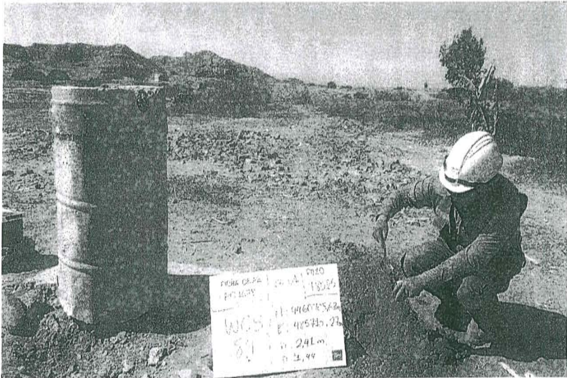
Fotografía N° 1. Toma de muestra de suelo en el punto F01678-SU01, ubicado a 1,1 m del pozo.

"Decenio de las Personas con Discapacidad en el Perú" "Año de la Promoción de la Industria Responsable y del Compromiso Climático"