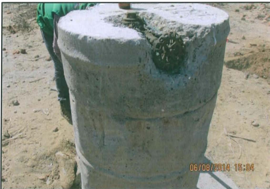
Fotografía N° 2. Pozo T8025 en estado de abandono que cuenta con válvula visible.