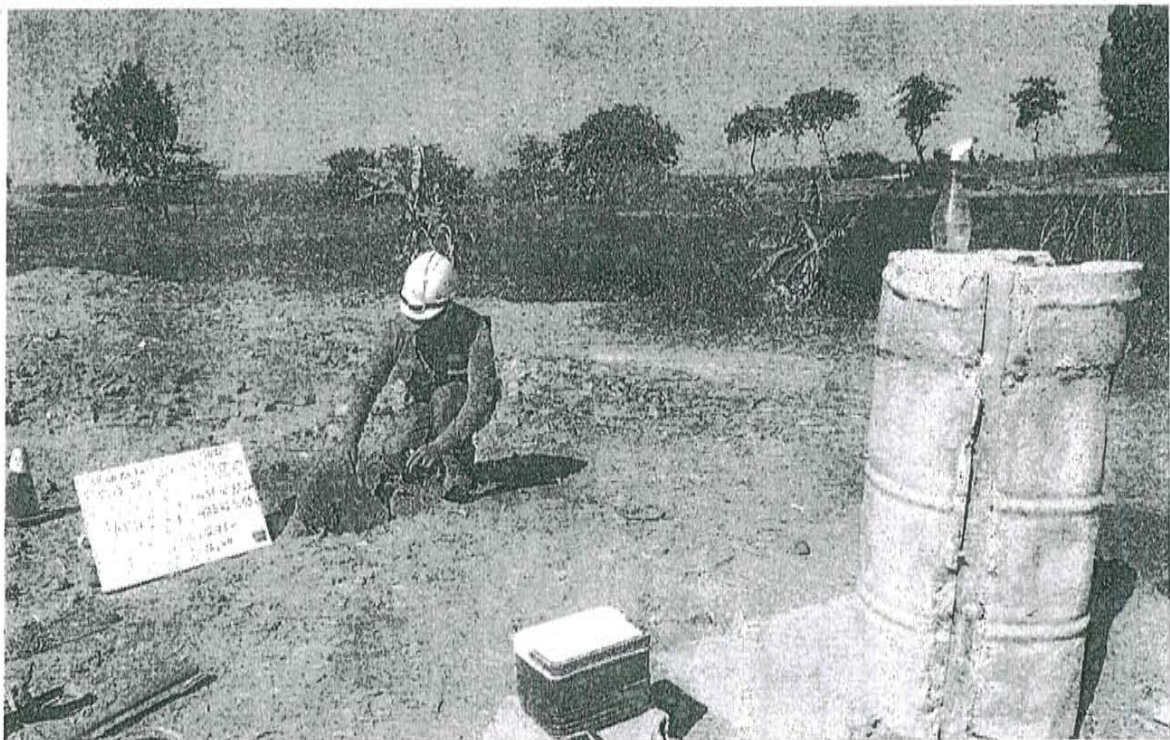
Fotografía N° 2. Toma de muestra de suelo en el punto F01678-SU02, ubicado a 3,85 m del pozo.