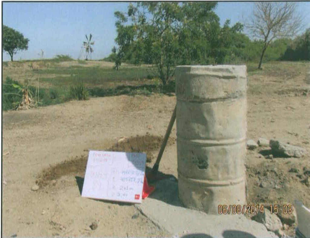
Fotografía N° 1. Pozo T2085 de Ficha OEFA F01678 que ha sido cubierto exteriormente con concreto.

"Año de la Promoción de la Industria Responsable y del Compromiso Climático" "Decenio de las Personas con Discapacidad en el Perú"