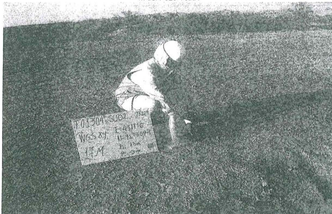
Fotografía N° 2. Toma de muestra de suelo en el punto F01304-SU02 ubicado a 2.0 m del Pozo T5229