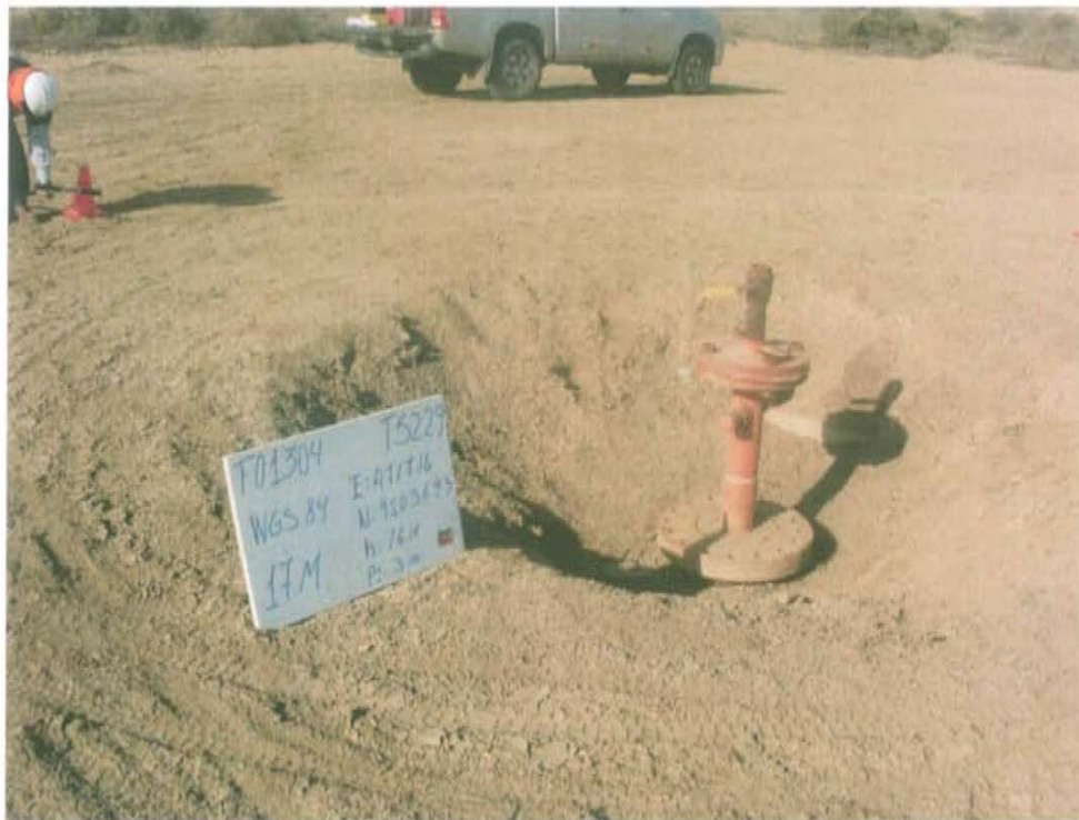
Fotografía N° 1. Se observa que el Pozo T5229 presenta brida superior e inferior y dos válvulas de cierre (concéntrica y lateral), con signos de corrosión.

"Año de la Promoción de la Industria Responsable y del Compromiso Climático" "Decenio de las Personas con Discapacidad en el Perú"