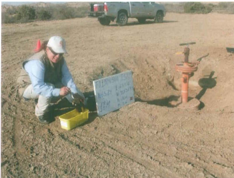
Fotografía N° 3. Toma de muestra F01304-SU01 a una distancia de 0,4 m del Pozo T5229.

"Año de la Promoción de la Industria Responsable y del Compromiso Climático" "Decenio de las Personas con Discapacidad en el Perú"