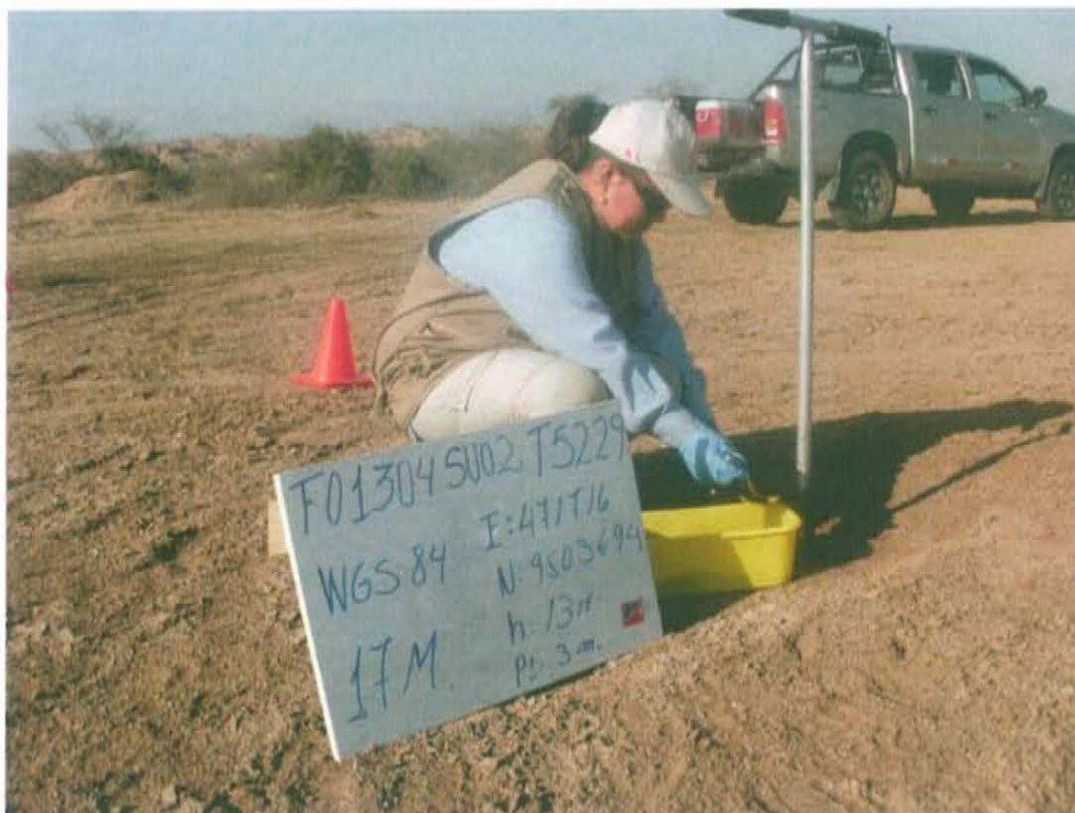
Fotografía N° 4. Toma de muestra F01304-SU02 a una distancia de 2 m del Pozo T5229.