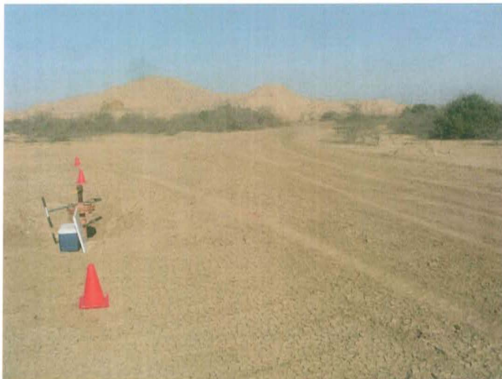
Fotografía N° 2. La zona donde se ubica el Pozo T5229, presenta terraplén habilitado con acceso vehicular.