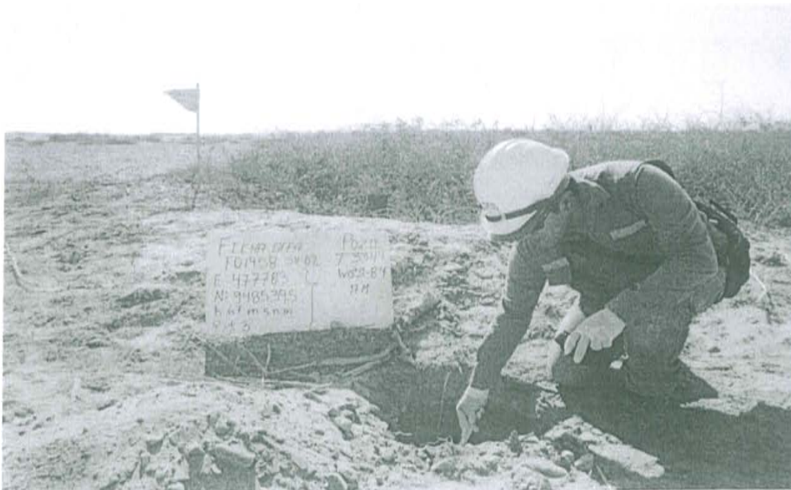
Fotografía N° 2. Toma de muestra de suelo en el punto F01958-SU02, ubicado a 4 m aproximadamente del Pozo.