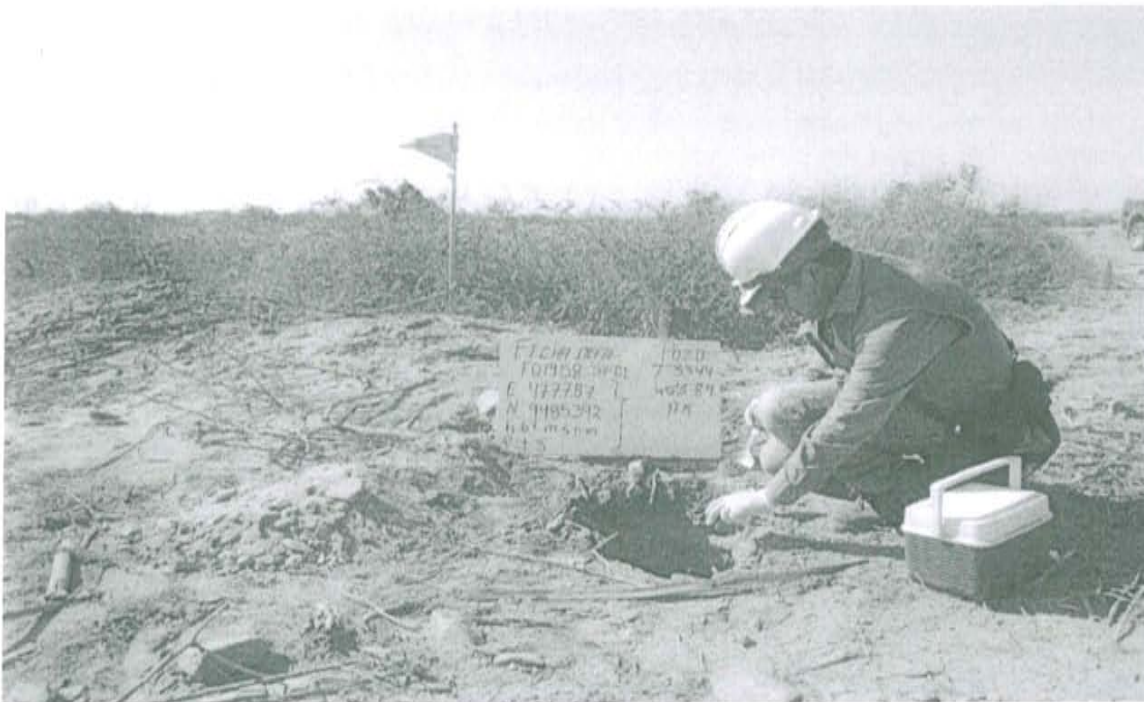
Fotografía N° 1. Toma de muestra de suelo en el punto F01958-SU01, ubicado a 3 m aproximadamente del Pozo.

"Decenio de las Personas con Discapacidad en el Perú" "Año de la Promoción de la Industria Responsable y del Compromiso Climático"