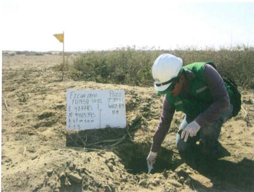
Fotografía N° 4. Toma de muestra de suelo en el punto F01958-SU02, ubicado a 4 m aproximadamente del Pozo.