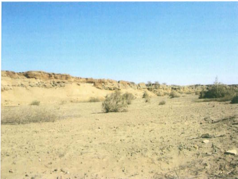
Fotografía N° 2. El pozo con código T3344 se encuentra rodeado de matorrales y vegetación arbustiva.