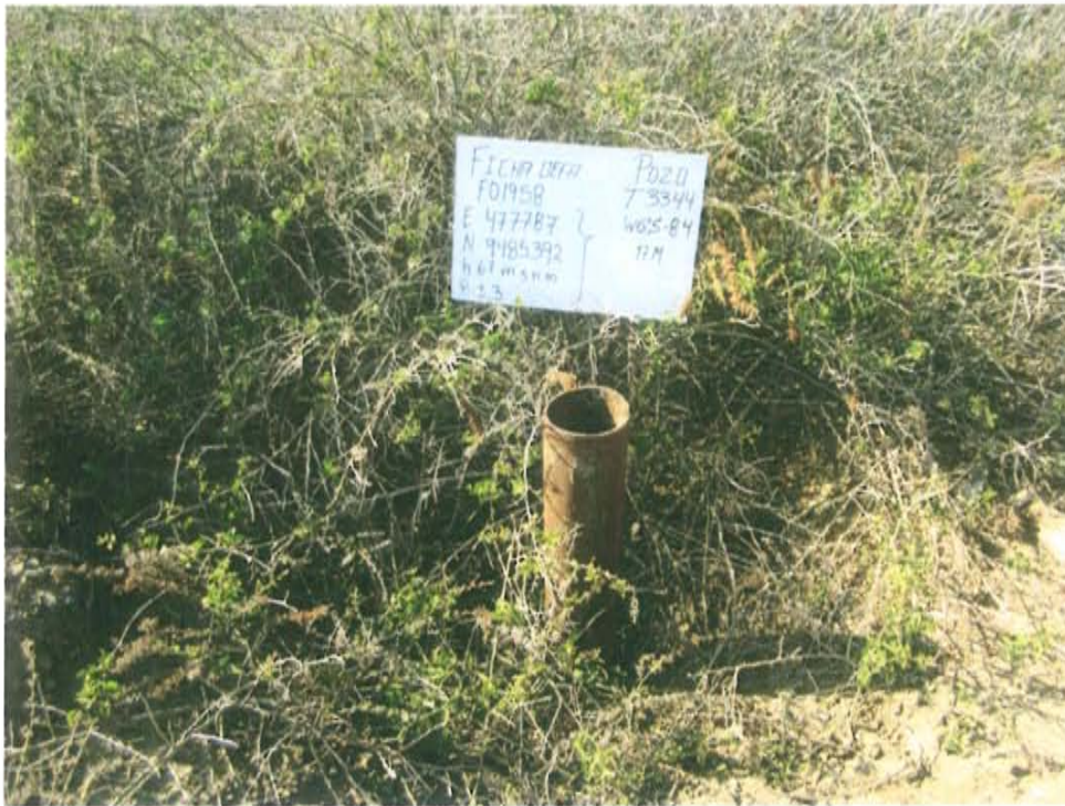
Fotografía N° 1. Se observa el casing que sobresale 0,8 sobre el nivel del suelo correspondiente al pozo inactivo con código PERUPETRO T3344.

"Año de la Promoción de la Industria Responsable y del Compromiso Climático" "Decenio de las Personas con Discapacidad en el Perú"