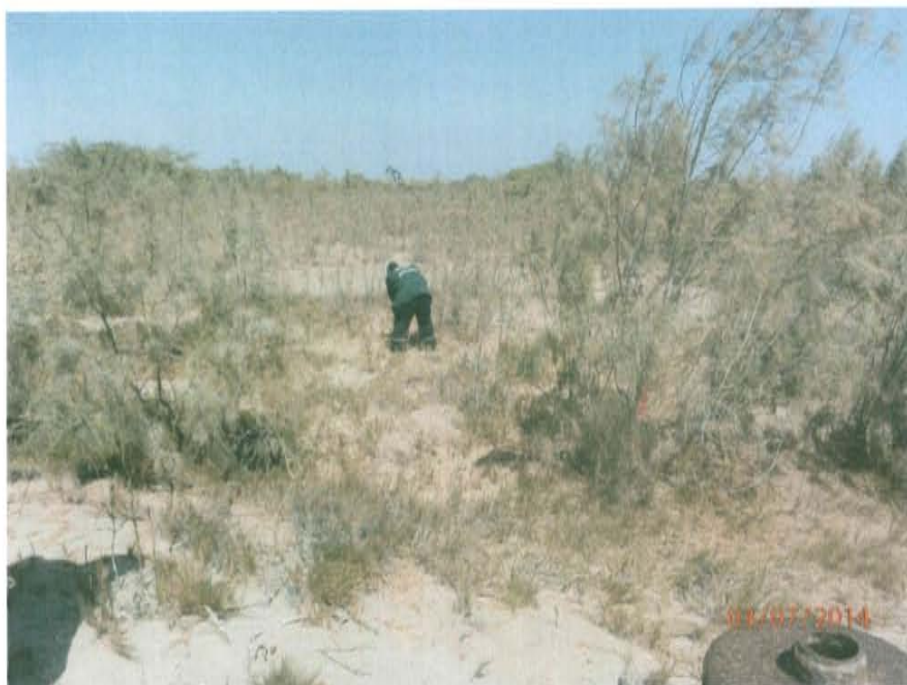
Fotografía N° 2. Vista panorámica del pozo inactivo ubicado en quebrada seca.