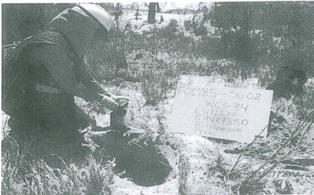
Fotografía N° 2. Toma de muestra de suelo en el punto F01185-SU02, ubicado a 10 m aproximadamente del Pozo T3973.