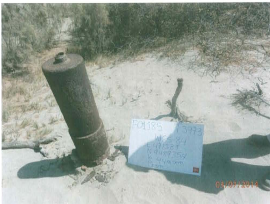
Fotografía N° 1. Pozo inactivo con el casing corroído, se encuentra expuesto al ambiente.

"Año de la Promoción de la Industria Responsable y del Compromiso Climático" "Decenio de las Personas con Discapacidad en el Perú"