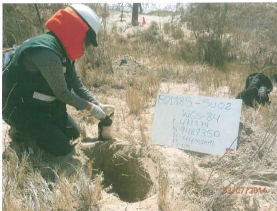
Fotografía N° 4. Toma de muestra de suelo F01185-SU02 a una profundidad de 0,5 m de la superficie del suelo.