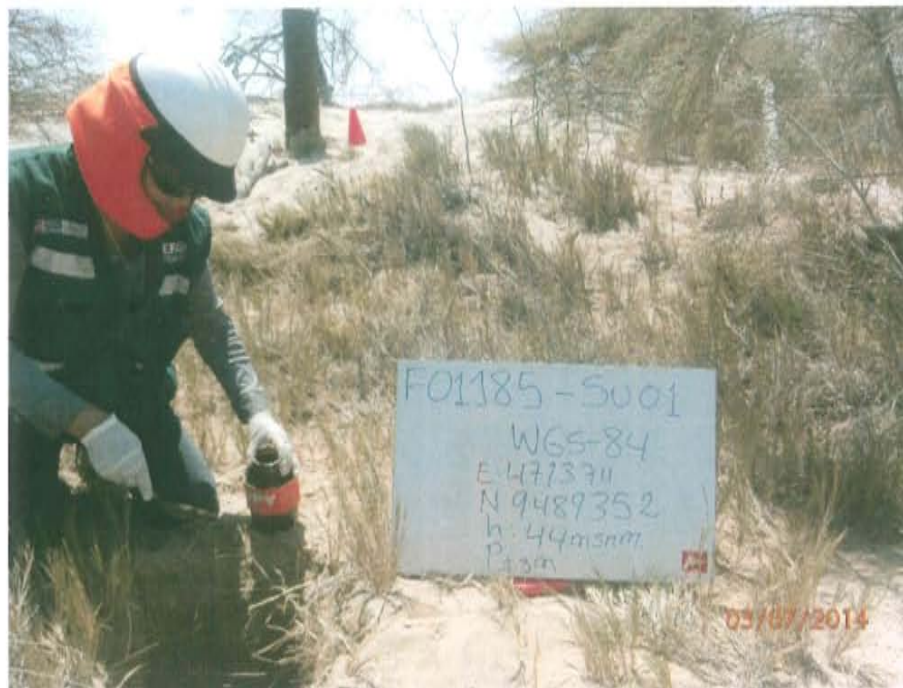
Fotografía N° 3. Punto de muestreo de suelo F01185-SU01 a una profundidad de 0,35 del suelo.

"Año de la Promoción de la Industria Responsable y del Compromiso Climático" "Decenio de las Personas con Discapacidad en el Perú"