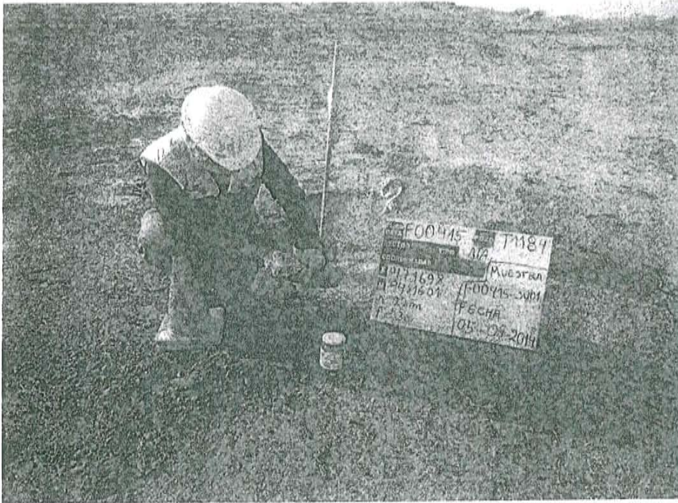
Fotografía N° 1. Toma de muestra de suelo en el punto F00415-SU01, ubicado a 0,50 m aproximadamente del Pozo T1184

"Decenio de las Personas con Discapacidad en el Perú" "Año de la Promoción de la Industria Responsable y del Compromiso Climático"