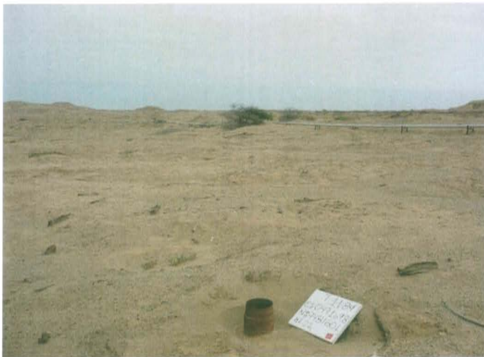
Fotografía N° 2. Vista panorámica del área evaluada del Pozo T1184 (Ficha OEFA F00415), de paisaje dominante caracterizado por planicies o tablazos, de escasa vegetación.