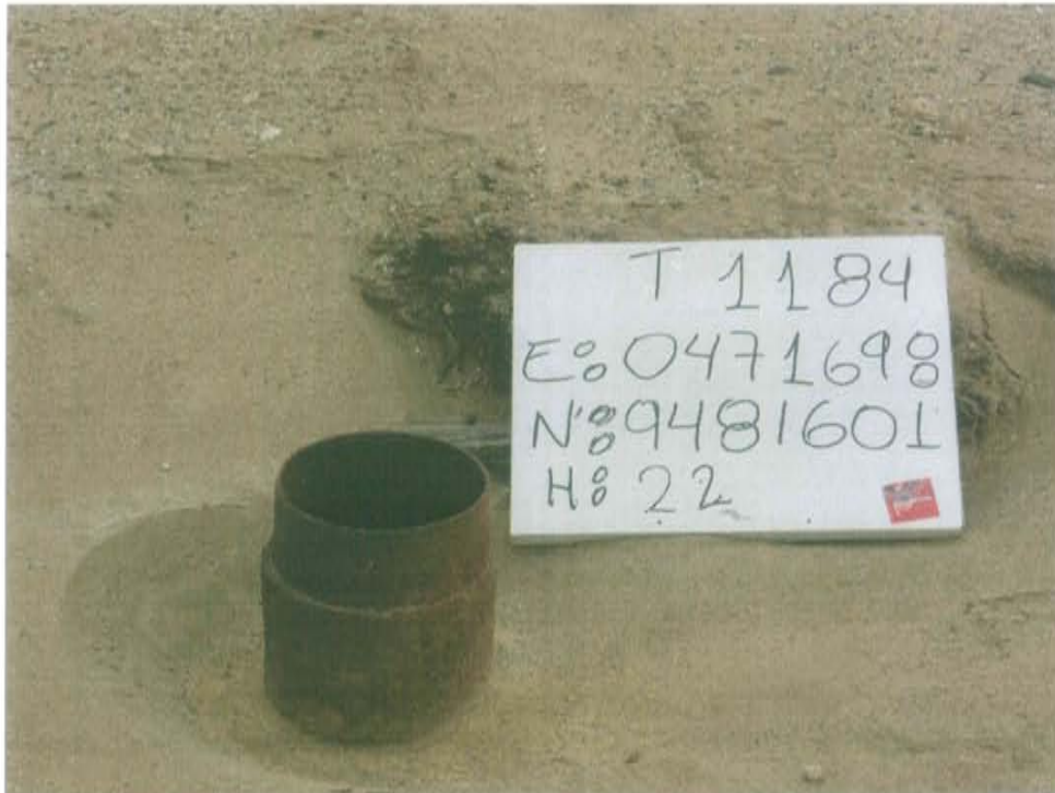
Fotografía N° 1. Pozo inactivo mal abandonado de la Ficha OEFA F00415, presenta casing corroído de 6,6 pulg de diámetro y abierto al ambiente.

"Año de la Promoción de la Industria Responsable y del Compromiso Climático" "Decenio de las Personas con Discapacidad en el Perú"