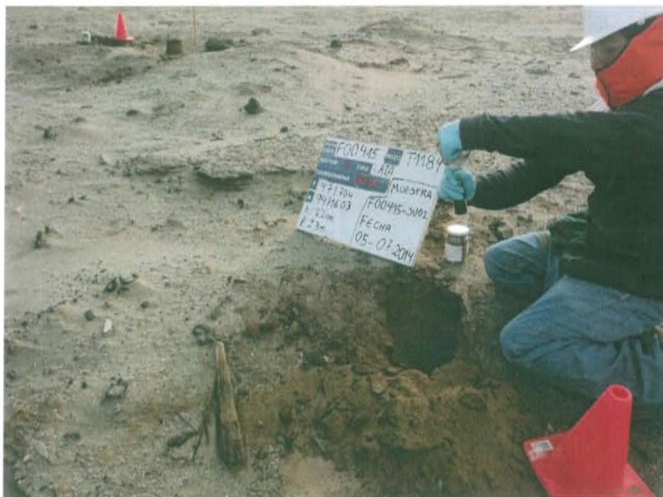
Fotografía N° 4. Toma de muestra de suelo en el punto F00415-SU02, ubicado a 3,5 m aproximadamente del Pozo T1184.