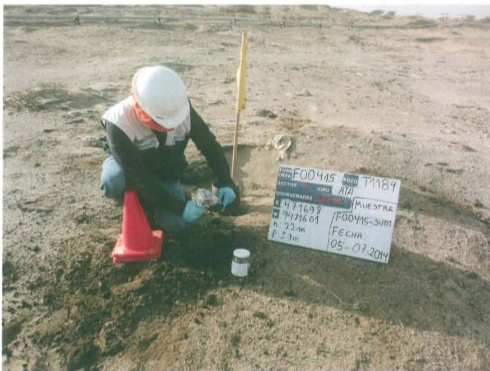
Fotografía N° 3. Toma de muestra de suelo en el punto F00415-SU01, ubicado a 0,5 m aproximadamente del Pozo T1184.

"Año de la Promoción de la Industria Responsable y del Compromiso Climático" "Decenio de las Personas con Discapacidad en el Perú"