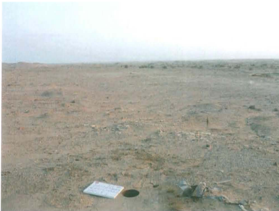
Fotografía N° 3. La zona presenta vegetación escasa, no cuenta con terraplén habilitado ni vía de acceso.