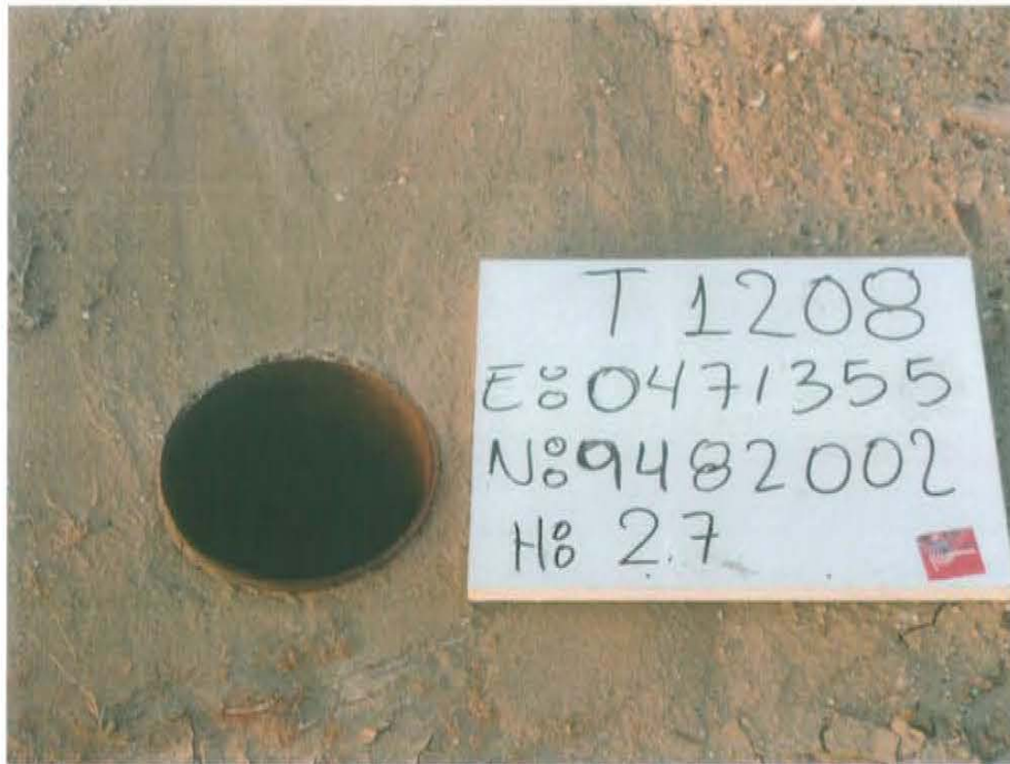
Fotografía N° 1. Pozo T1208 sin cabezal, con presencia de casing de Revestimiento a nivel del suelo del suelo de 8 pulgadas de diámetro.

"Año de la Promoción de la Industria Responsable y del Compromiso Climático" "Decenio de las Personas con Discapacidad en el Perú"