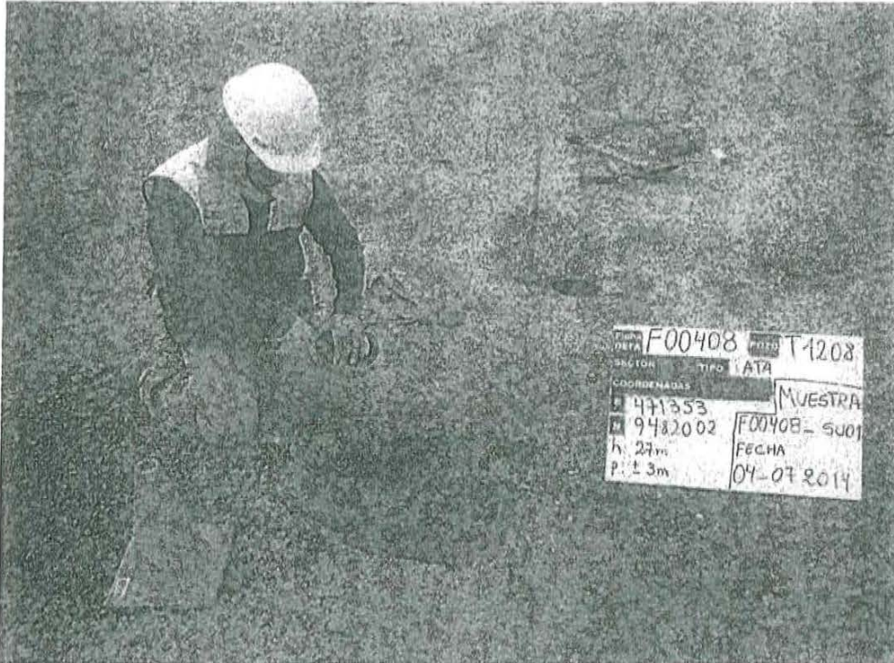
Fotografía N° 1. Toma de muestra de suelo en el punto F00408-SU01, ubicado a 1,10 m aproximadamente del Pozo T1208

"Decenio de las Personas con Discapacidad en el Perú" "Año de la Promoción de la Industria Responsable y del Compromiso Climático"