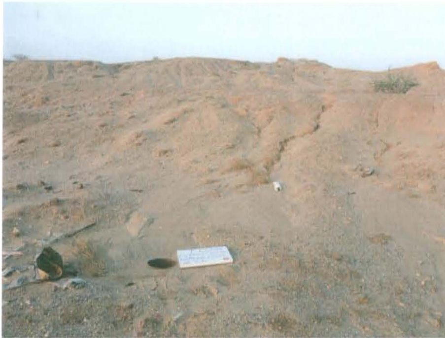
Fotografía N° 2. Zona evaluada presenta un relieve de dunas monticulares al pie de monte con presencia de cárcavas

"Año de la Promoción de la Industria Responsable y del Compromiso Climático" "Decenio de las Personas con Discapacidad en el Perú"