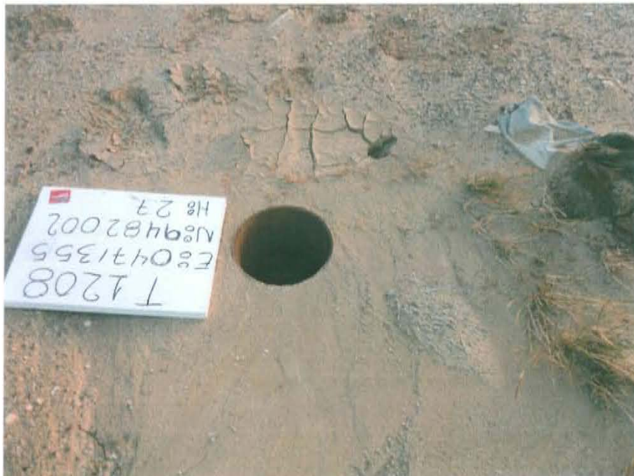
Fotografía N° 2. El pozo se encuentra abierto al ambiente.