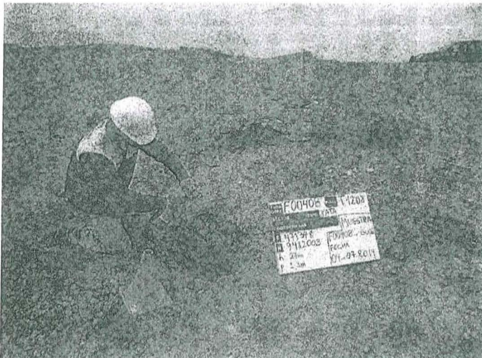
Fotografía N° 2. Toma de muestra de suelo en el punto F00408-SU02, ubicado a 5 m aproximadamente del Pozo T1208