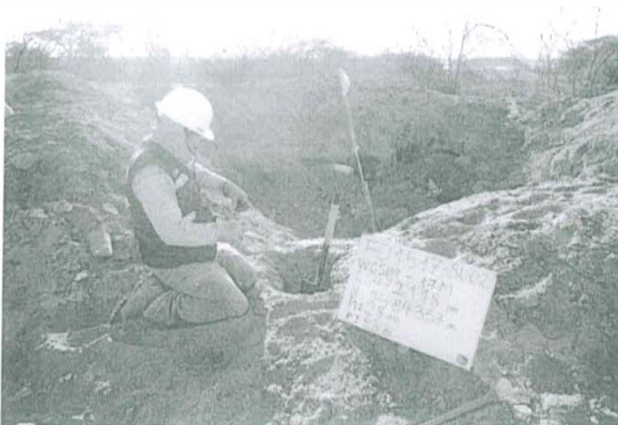
Fotografía N° 2. Toma de muestra de suelo en el punto F01517-SU02, ubicado a 6 m aproximadamente del Pozo T1579.