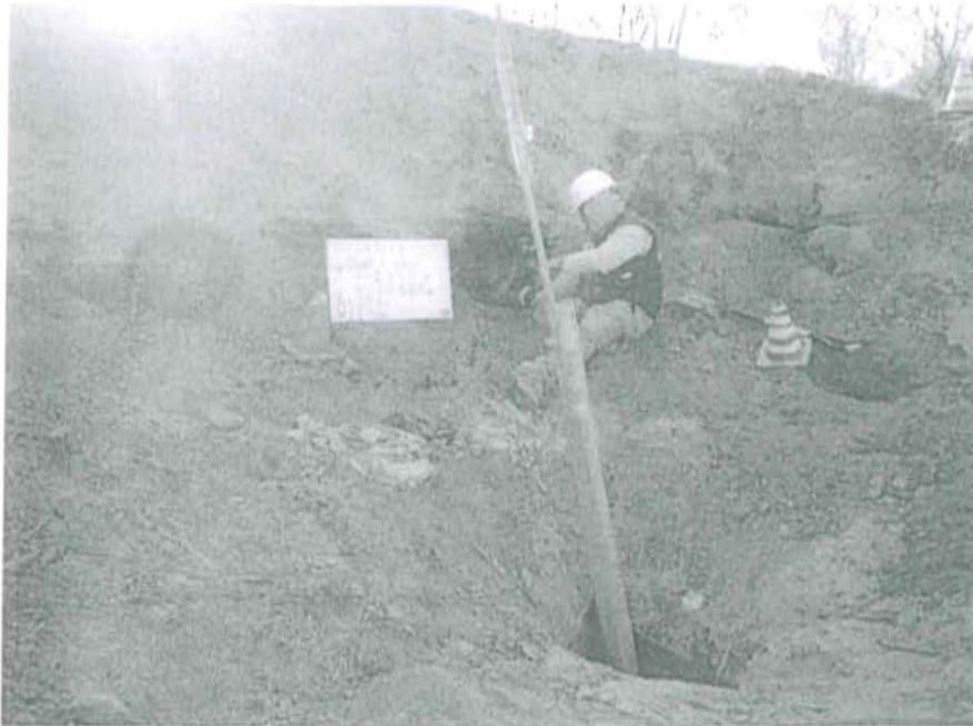
Fotografía N° 1. Toma de muestra de suelo en el punto F01517-SU01, ubicado a 3,7 m aproximadamente del Pozo T1579.

"Decenio de las Personas con Discapacidad en el Perú" "Año de la Promoción de la Industria Responsable y del Compromiso Climático"