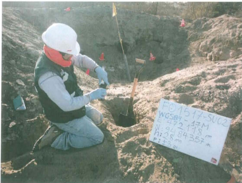
Fotografía N° 3. Toma de muestra de suelo en el punto F01517-SU02, ubicado aproximadamente a 6 m al sureste del Pozo T1579.

"Año de la Promoción de la Industria Responsable y del Compromiso Climático" "Decenio de las Personas con Discapacidad en el Perú"