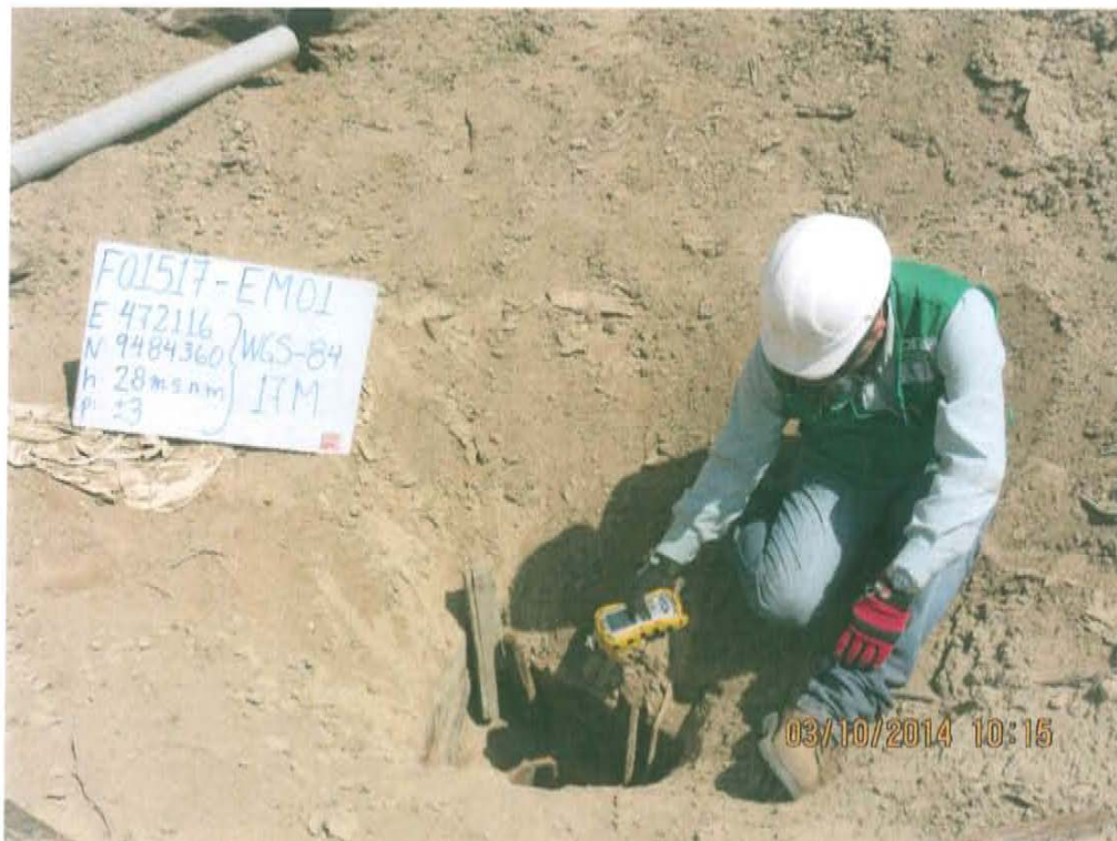
Fotografía N° 4. Medición en el punto F01517-EM01, ubicado en la fuente de emisión en boca del Pozo T1579.