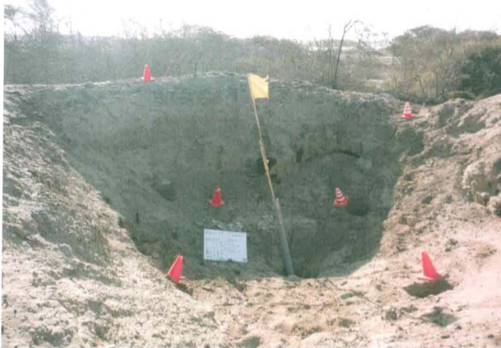
Fotografía N° 2. Vista del área circundante del pozo inactivo T1579.