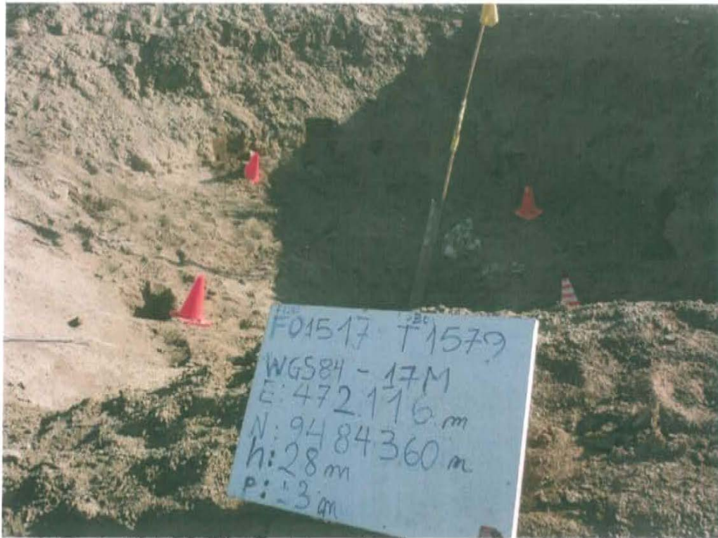
Fotografía N° 1. Identificación del pozo inactivo con código PERUPETRO T1579. Presenta casing abierto al medio ambiente.

"Año de la Promoción de la Industria Responsable y del Compromiso Climático" "Decenio de las Personas con Discapacidad en el Perú"