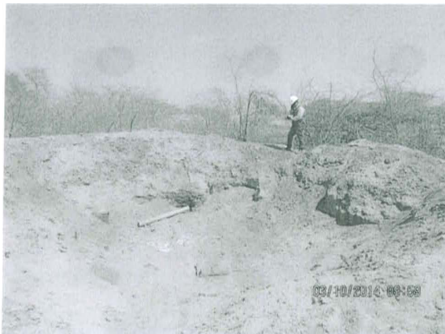
Fotografía N° 2. Mediciones en F01517-VA01, recorrido en el área circundante alrededor del pozo.