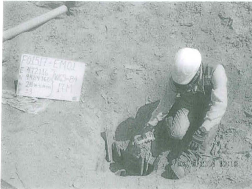
Fotografía N° 1. Medición en el punto F01517-EM01, ubicado en la boca del pozo.

"Año de la Promoción de la Industria Responsable y del Compromiso Climático" "Decenio de las Personas con Discapacidad en el Perú"