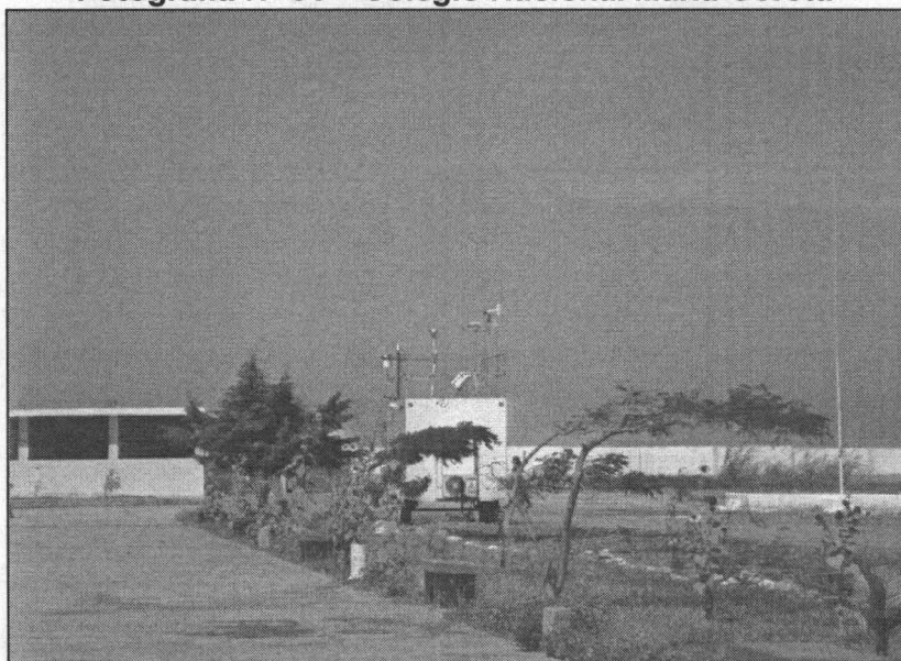
Fotografía N° 01 – Colegio Nacional María Goretti