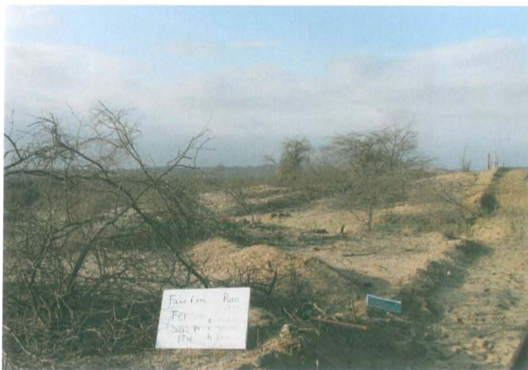
Fotografía N° 2. Alrededores de la posible ubicación del Pozo T2949 donde se observa la presencia de vegetación arbustiva seca y una trocha carrozable.