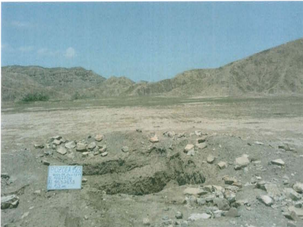
Fotografía N° 2. Vista panorámica de la posible ubicación del pozo A1563, donde se observa restos de concreto dispersos en el área circundante a la posible ubicación del pozo.