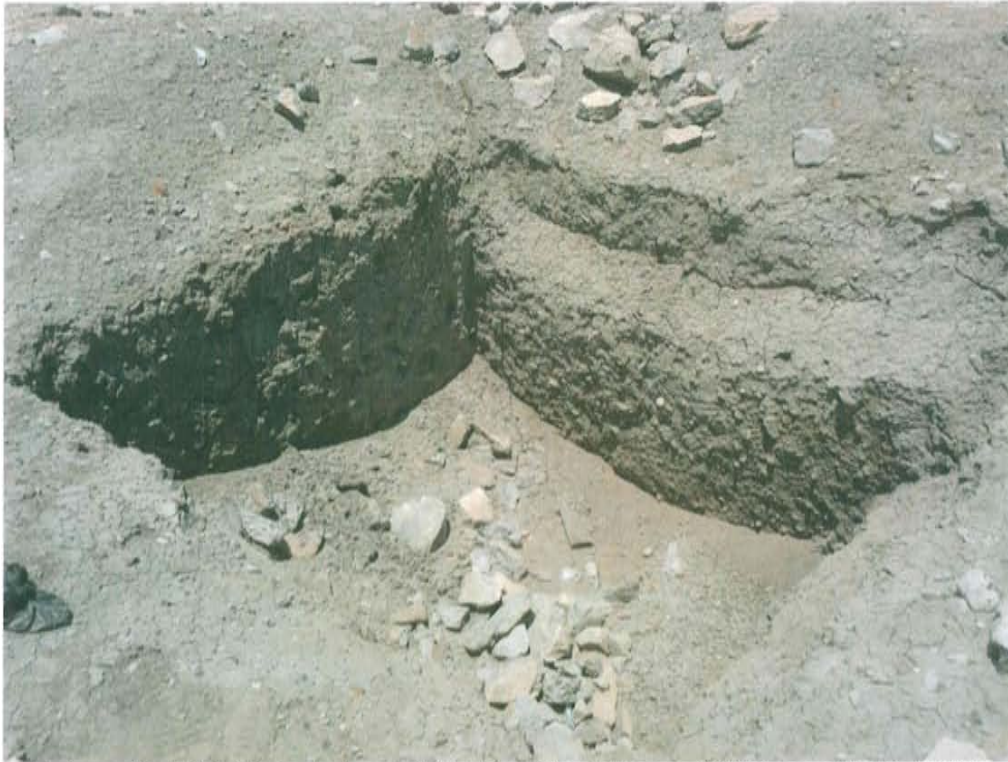
Fotografía N° 1. Vista de la posible ubicación del pozo A1563, se aprecia restos de concreto en el interior y fuera de la posible cantina.

"Año de la Promoción de la Industria Responsable y del Compromiso Climático" "Decenio de las Personas con Discapacidad en el Perú"