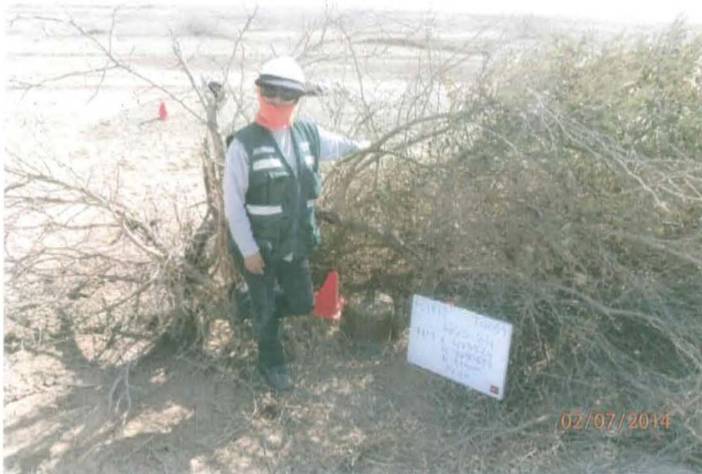
Fotografía N° 1. Pozo inactivo con casing corroído que sobresale 0,35 m sobre la superficie del suelo.

"Año de la Promoción de la Industria Responsable y del Compromiso Climático" "Decenio de las Personas con Discapacidad en el Perú"