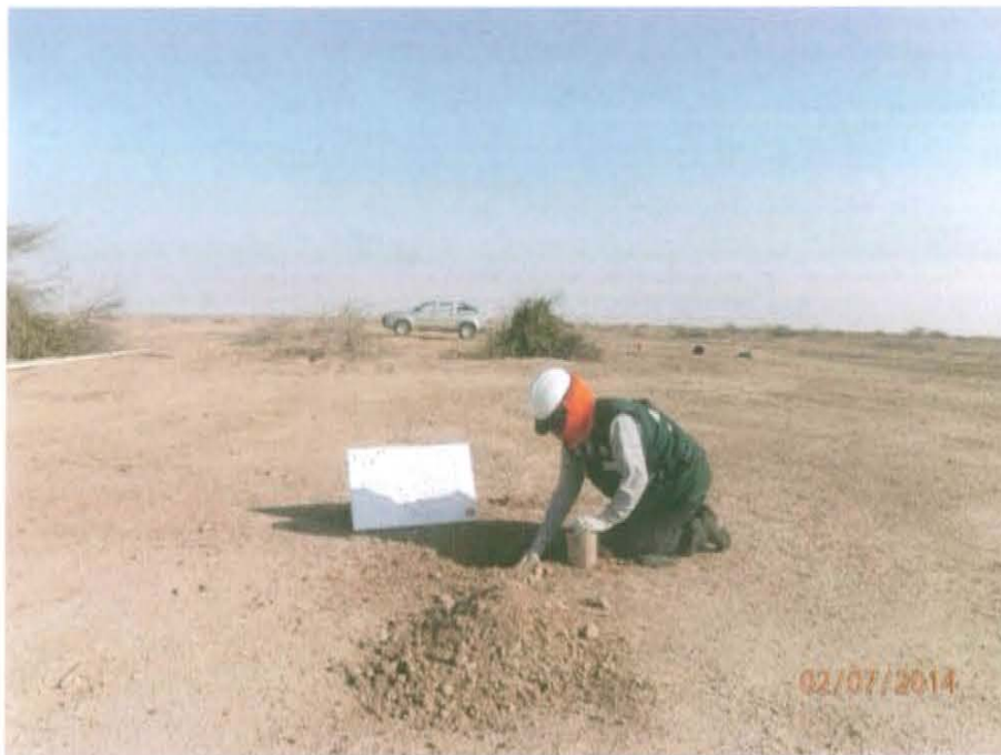
Fotografía N° 2. Vista Panorámica del pozo ubicado en la unidad fisiográfica de planicie.