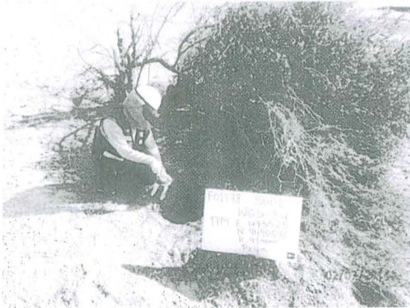
Fotografía N° 1. Toma de muestra de suelo en el punto F01178-SU01, ubicado a 2 m aproximadamente del Pozo T4059.

"Decenio de las Personas con Discapacidad en el Perú" "Año de la Promoción de la Industria Responsable y del Compromiso Climático"