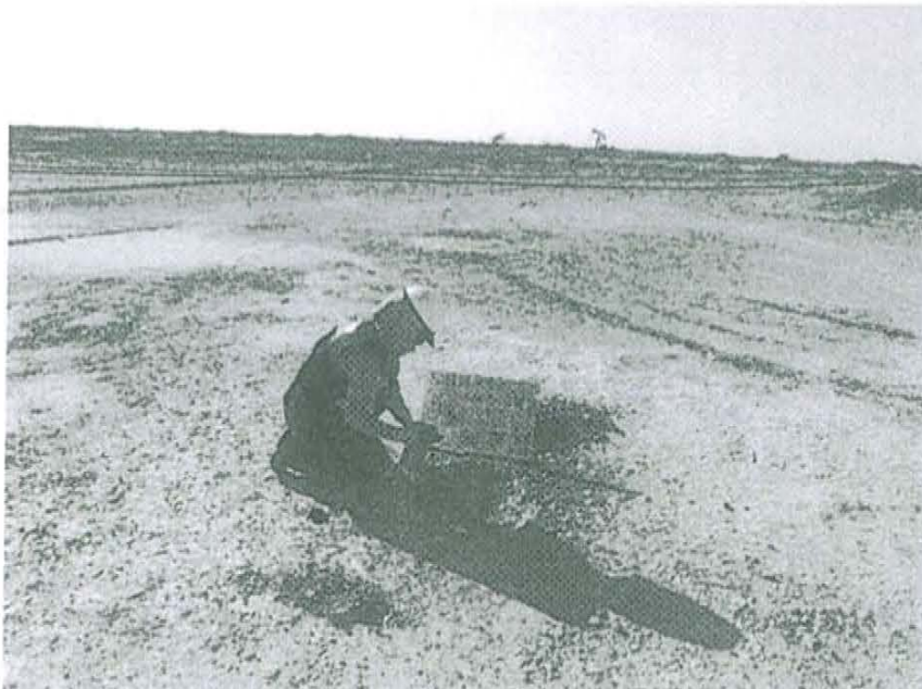
Fotografía N° 2. Toma de muestra de suelo en el punto F01178-SU02, ubicado a 25 m aproximadamente del Pozo T4059.