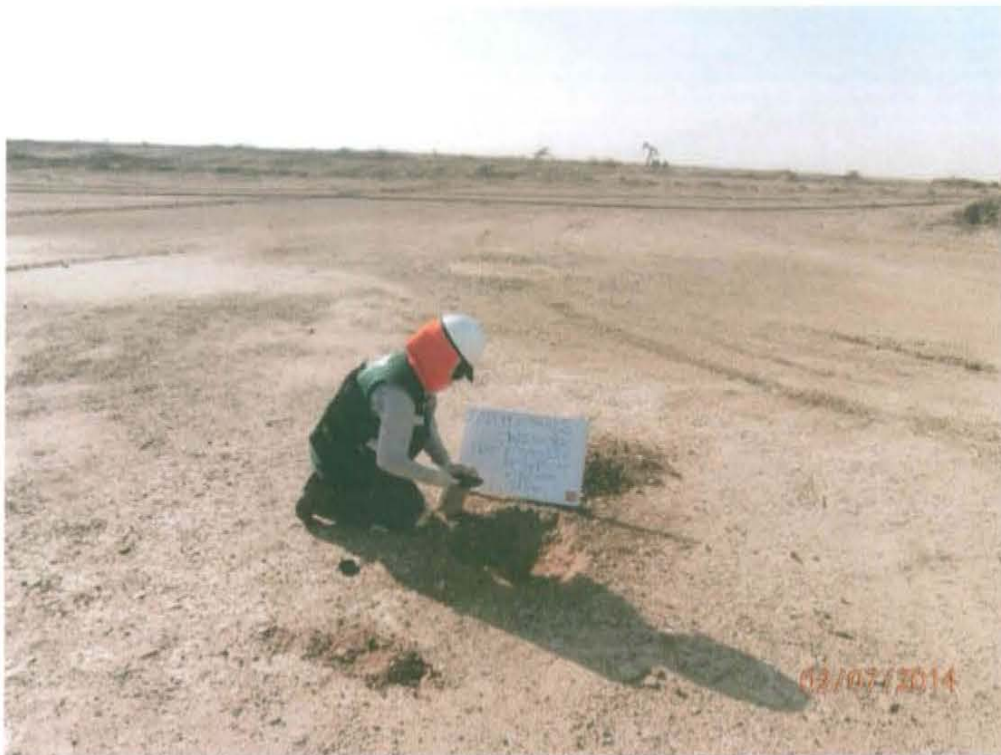
Fotografía N° 4. Toma de muestra de suelo a 25 m del Pozo y a una profundidad de 0,35 m de la superficie del suelo.