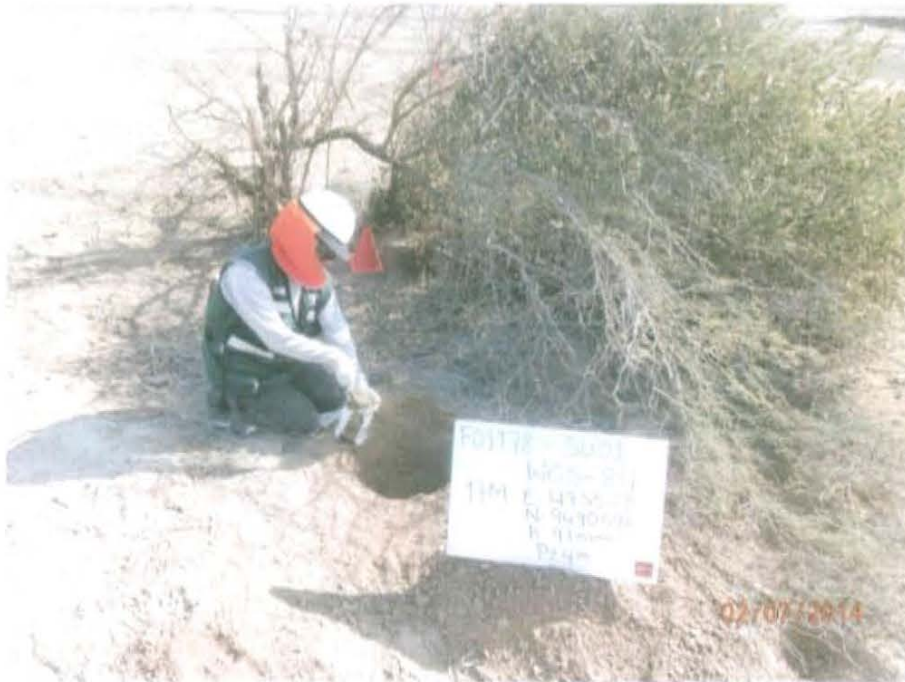
Fotografía N° 3. La muestra de suelo fue tomada a 1 m del pozo y a una profundidad de 0,43 m de la superficie del suelo.

"Año de la Promoción de la Industria Responsable y del Compromiso Climático" "Decenio de las Personas con Discapacidad en el Perú"