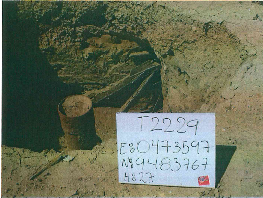
Fotografía N° 1. Pozo inactivo, con tubo expuesto que presenta acumulación de tierra en su interior, dentro de un hoyo de 1,5 m de profundidad.