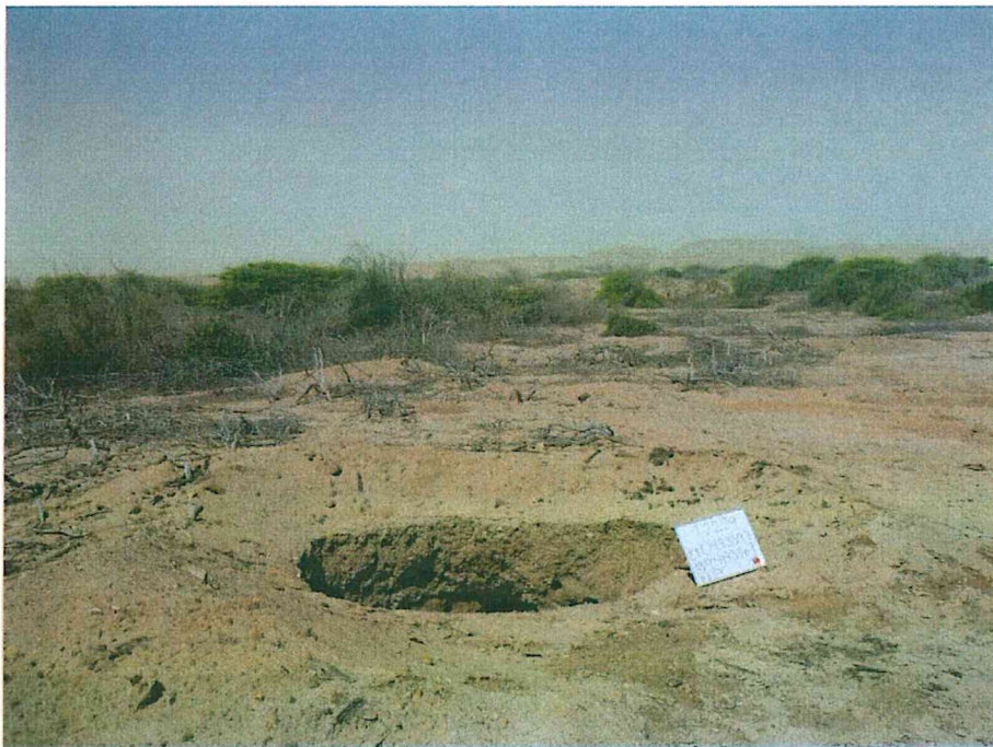
Fotografía N° 2. Área evaluada caracterizada por presentar planicies o tablazos, con algunas zonas ligeramente onduladas como lomas.