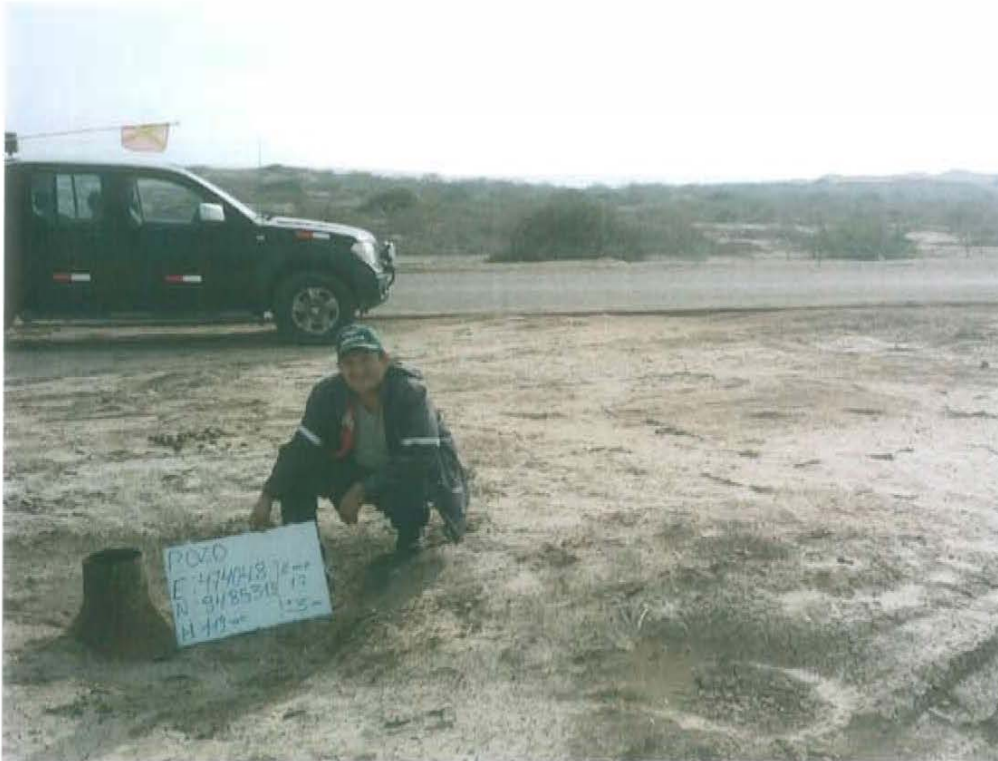
Fotografía N° 1. Vista panorámica del pozo T1633, ubicado en un relieve plano.

"Año de la Promoción de la Industria Responsable y del Compromiso Climático" "Decenio de las Personas con Discapacidad en el Perú"