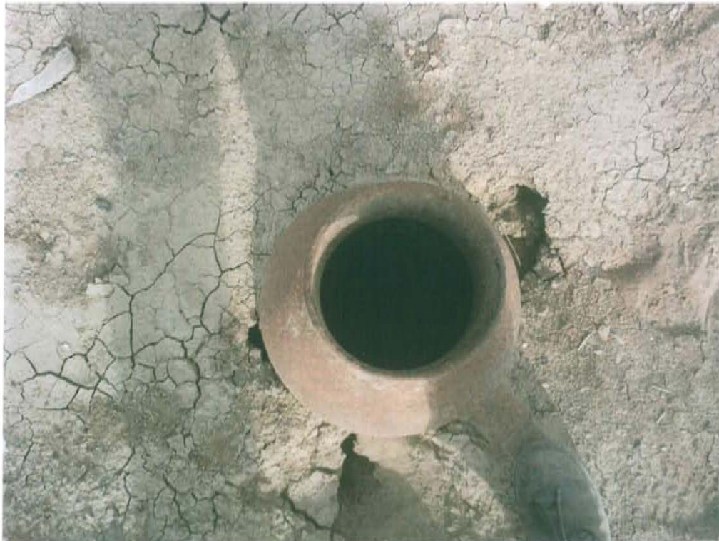
Fotografía N° 2. Vista del casing del pozo T1633, se observa el casing abierto al ambiente.