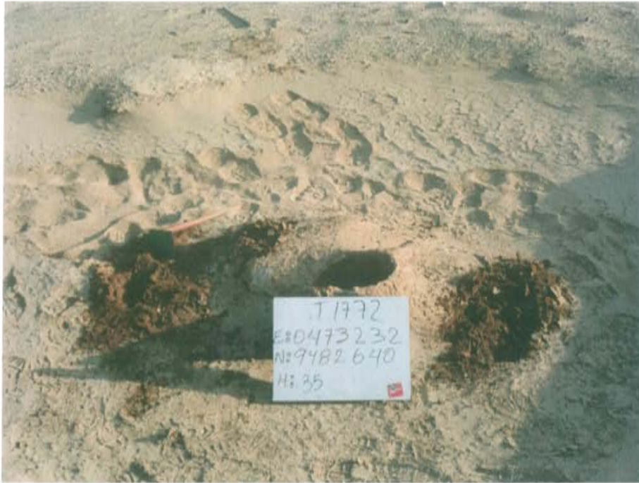
Fotografía N° 1. Pozo inactivo con código PERUPETRO T1772, sin cabezal solo se observa casing de revestimiento a nivel del suelo de 9 pulgadas de diámetro

"Año de la Promoción de la Industria Responsable y del Compromiso Climático" "Decenio de las Personas con Discapacidad en el Perú"