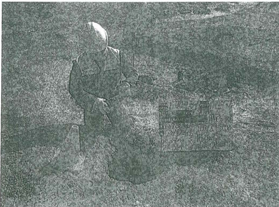
Fotografía N° 2. Toma de muestra de suelo en el punto F00439-SU02, ubicado a 2,20 m aproximadamente del pozo T1772