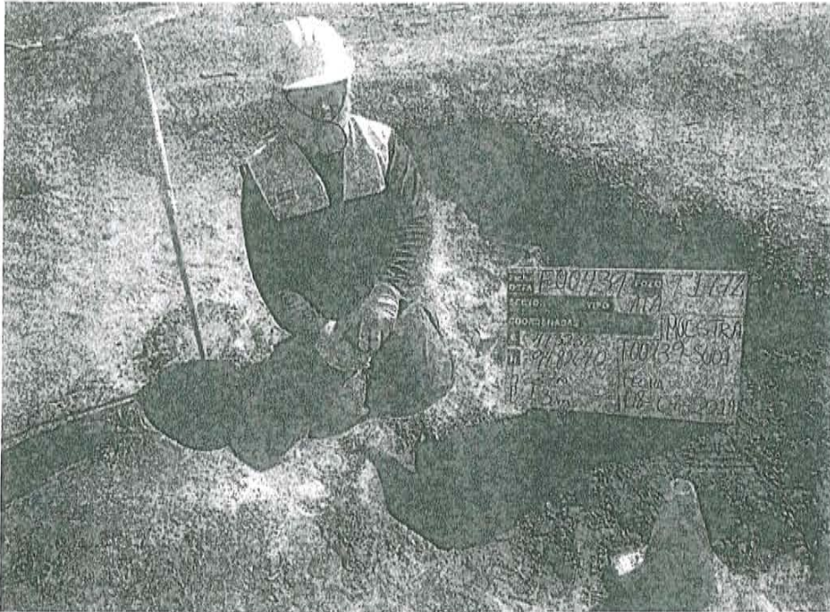
Fotografía N° 1. Toma de muestra de suelo en el punto F00439-SU01, ubicado a 0,80 m aproximadamente del pozo T1772

"Decenio de las Personas con Discapacidad en el Perú" "Año de la Promoción de la Industria Responsable y del Compromiso Climático"