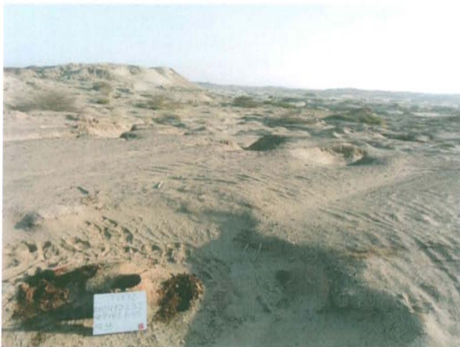
Fotografía N° 2. Área evaluada caracterizada por su relieve llano y árido, de relieves accidentados de 15 a 25% de pendiente con presencia de surcos y cárcavas.