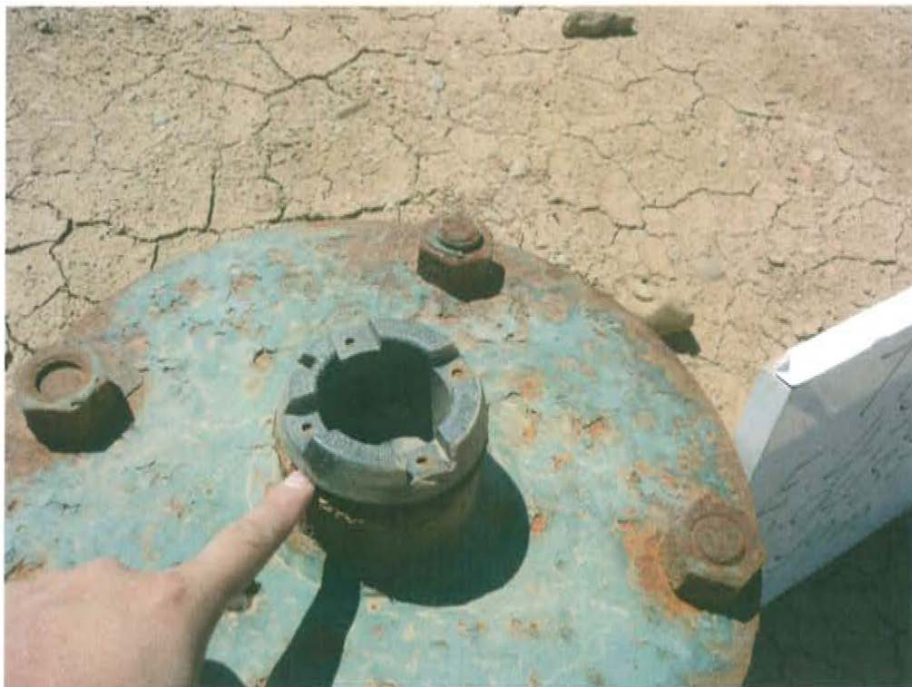
Fotografía N° 2. Tubería de reducción que en la parte superior presenta una tapa rosca, pero que no garantizaría el hermetismo del pozo.