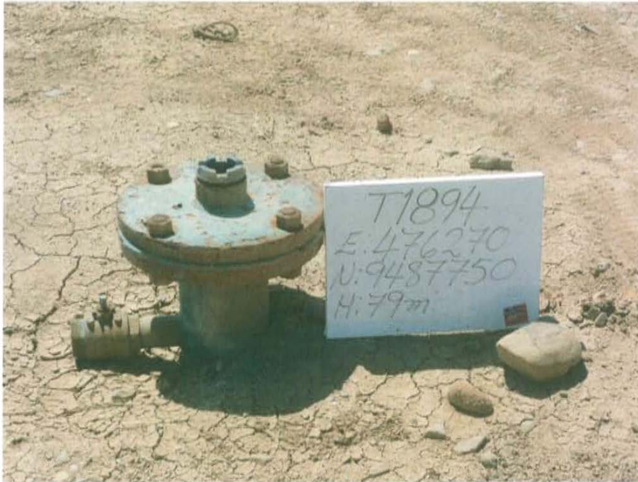
Fotografía N° 1. Pozo inactivo con código PERUPETRO T1894, en terreno habilitado tipo terraplén, el cual posee acceso vehicular directo. El pozo posee cabezal que está compuesto por una brida, la cual posee una salida lateral que une al casing y una tubería de reducción.

"Año de la Promoción de la Industria Responsable y del Compromiso Climático" "Decenio de las Personas con Discapacidad en el Perú"