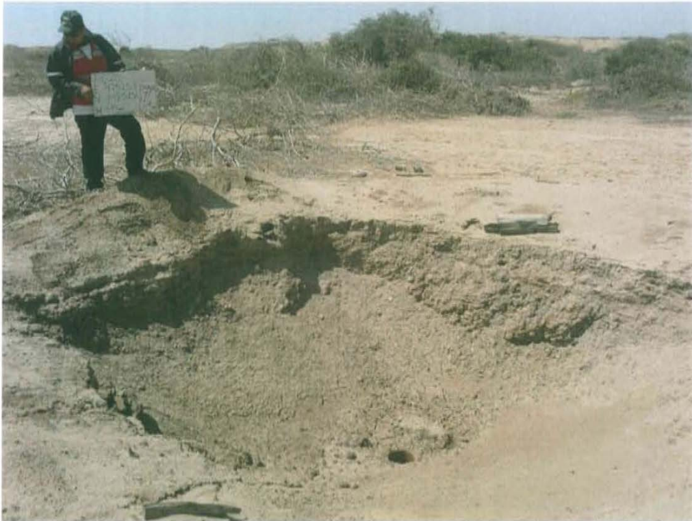
Fotografía N° 1. Vista panorámica del pozo T3007, ubicado dentro de un hoyo.

"Año de la Promoción de la Industria Responsable y del Compromiso Climático" "Decenio de las Personas con Discapacidad en el Perú"