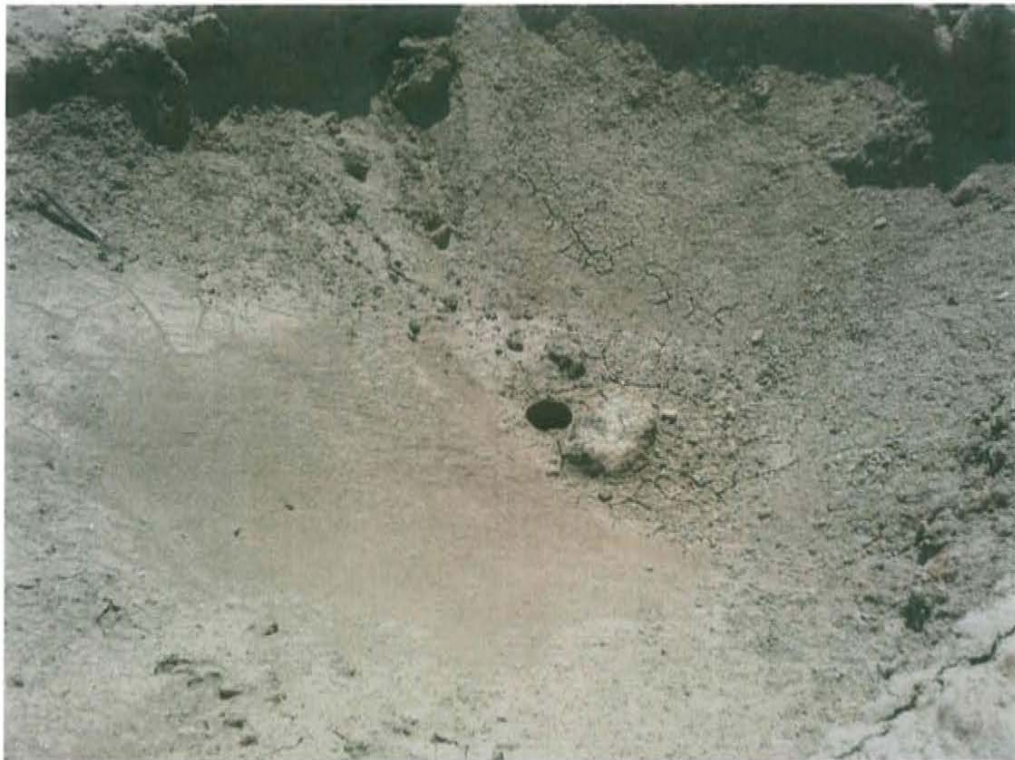
Fotografía N° 2. Vista del casing del pozo T3007, se observa el casing abierto al ambiente a nivel de la superficie del suelo.