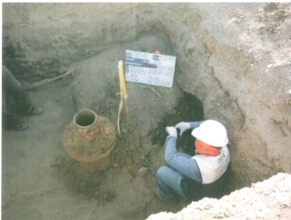
Fotografía N° 3. Toma de muestra de suelo en el punto F00570-SU01, ubicado a 1,2 m aproximadamente del Pozo T2789.

"Año de la Promoción de la Industria Responsable y del Compromiso Climático" "Decenio de las Personas con Discapacidad en el Perú"