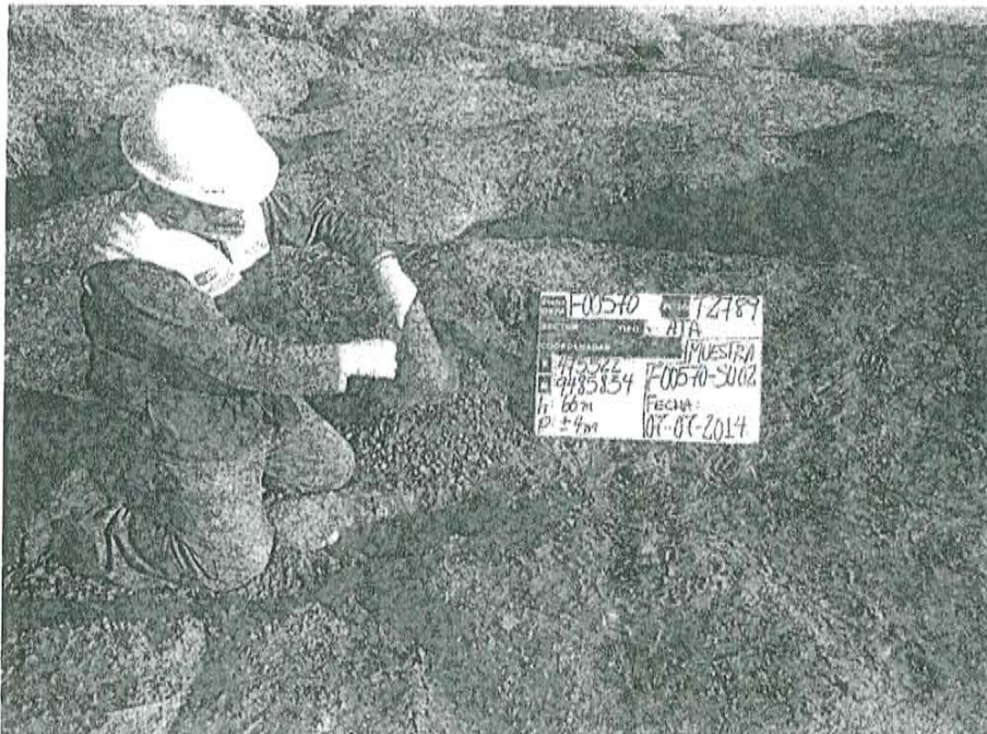
Fotografía N° 2. Toma de muestra de suelo en el punto F00570-SU02, ubicado a 3,6 m aproximadamente del Pozo T2789