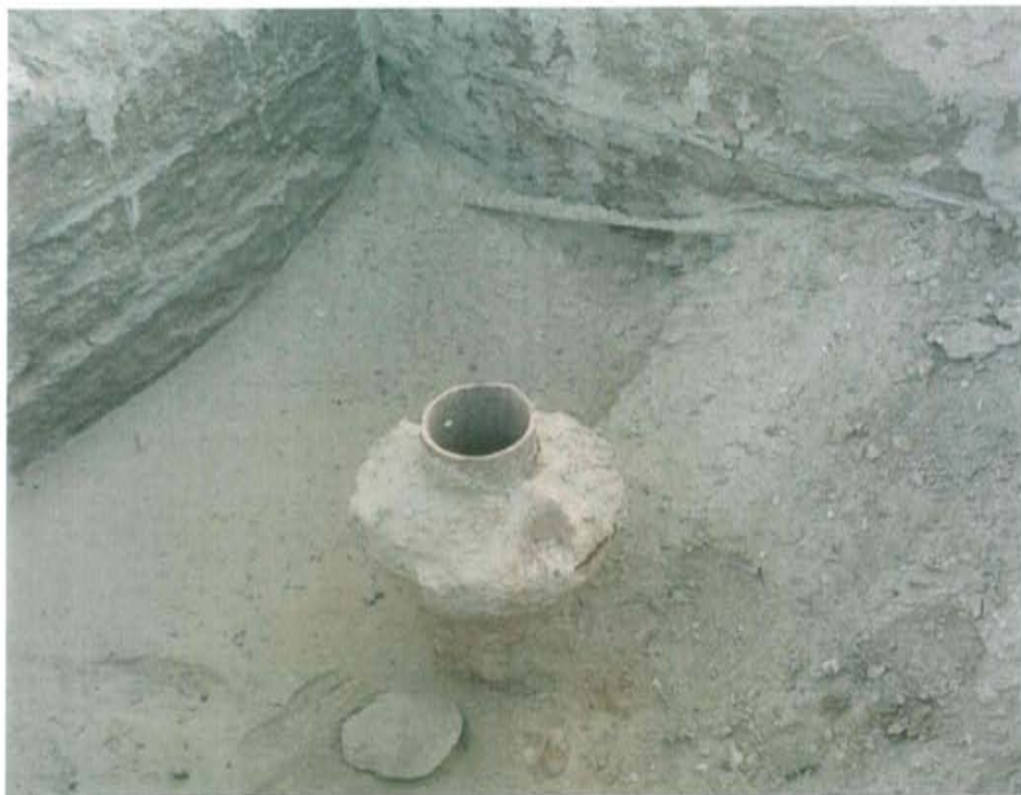
Fotografía N° 2. De la Ficha OEFA F00419, se observa casing que sobresale en el interior de una cantina y se encuentra abierto al ambiente.