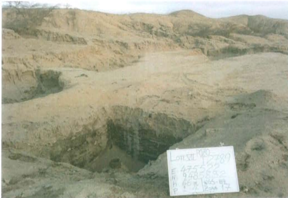
Fotografía N° 1. Vista panorámica del área evaluada del Pozo T2789 (Ficha OEFA F00570), presenta cárcavas producto de la escorrentía pluviales, que han erosionado el suelo en los alrededores

"Año de la Promoción de la Industria Responsable y del Compromiso Climático" "Decenio de las Personas con Discapacidad en el Perú"