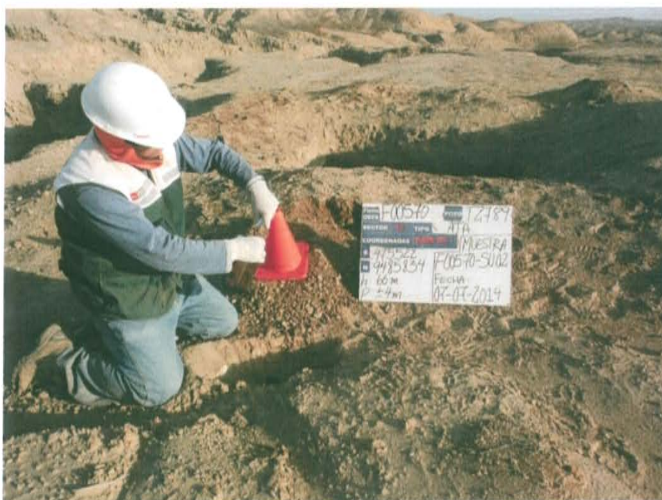
Fotografía N° 4. Toma de muestra de suelo en el punto F00570-SU02, ubicado a 3,6 m aproximadamente del Pozo T2789.