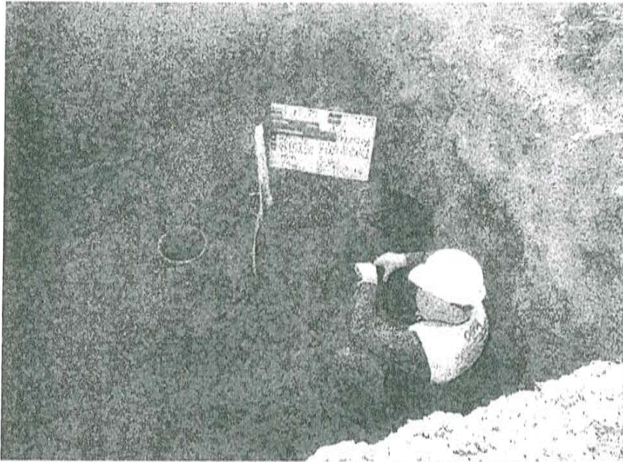
Fotografía N° 1. Toma de muestra de suelo en el punto F00570-SU01, ubicado a 1,2 m aproximadamente del Pozo T2789

"Decenio de las Personas con Discapacidad en el Perú" "Año de la Promoción de la Industria Responsable y del Compromiso Climático"