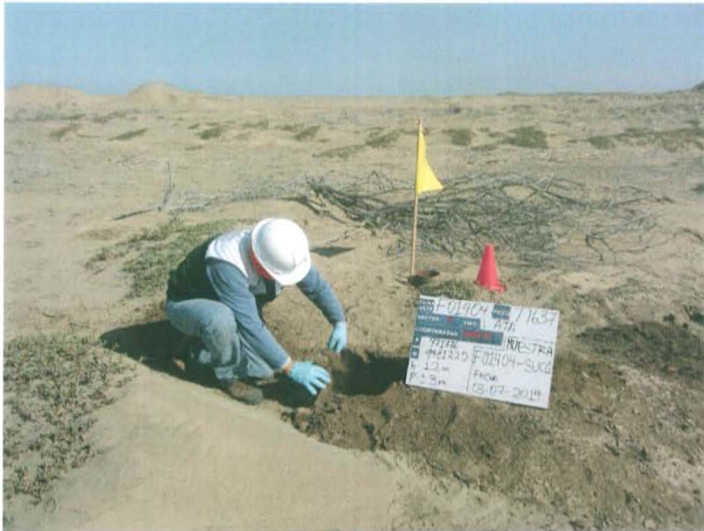
Fotografía N° 3. Toma de muestra de suelo en el punto F01404 -SU01, ubicado a 1,6 m del Pozo T1637.

"Año de la Promoción de la Industria Responsable y del Compromiso Climático" "Decenio de las Personas con Discapacidad en el Perú"