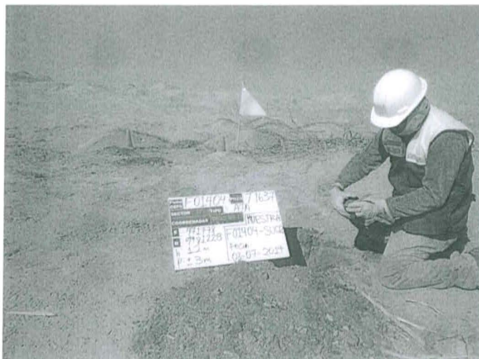
Fotografía N° 2. Toma de muestra de suelo en el punto F01404-SU02, ubicado a 4,20 m de distancia del Casing, Pozo T1637.