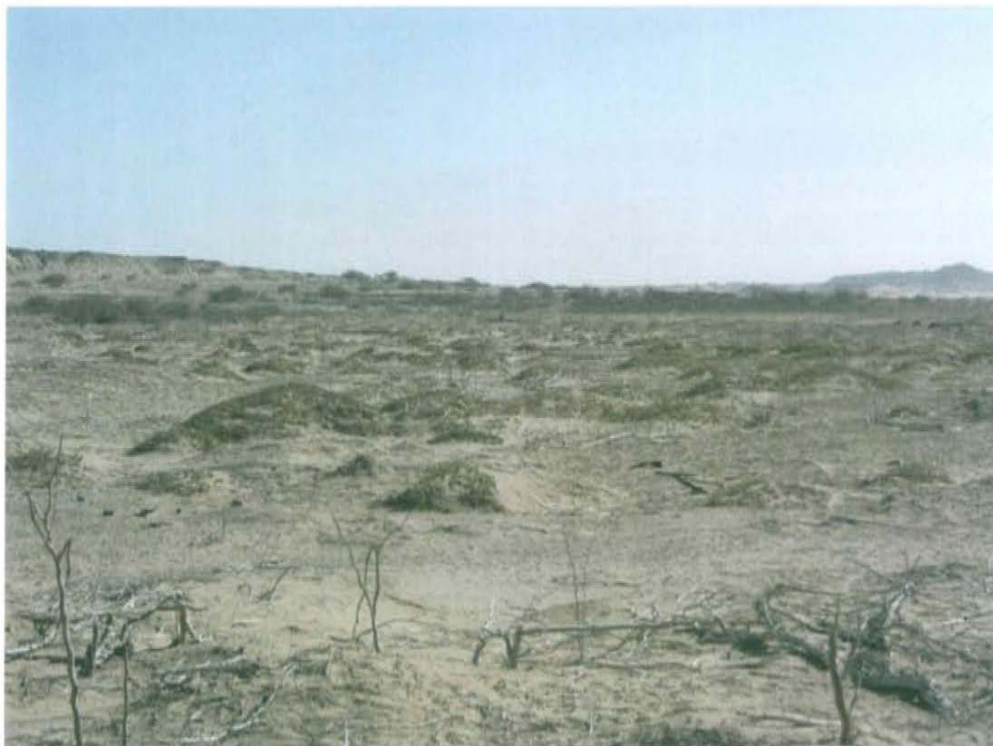
Fotografía N° 2. Vista panorámica donde se ubica el Pozo T1637, no se cuenta con acceso vehicular.