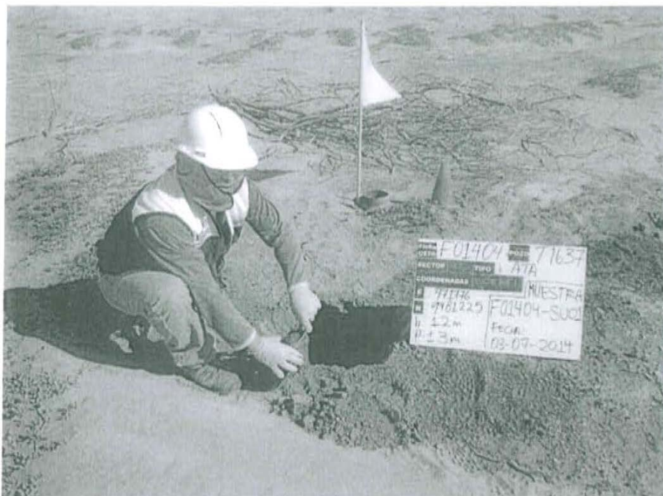
Fotografía N° 1. Toma de muestra de suelo en el punto F01404-SU01, ubicado a 1,60 m de distancia del Casing, Pozo T1637.

"Decenio de las Personas con Discapacidad en el Perú" "Año de la Promoción de la Industria Responsable y del Compromiso Climático"