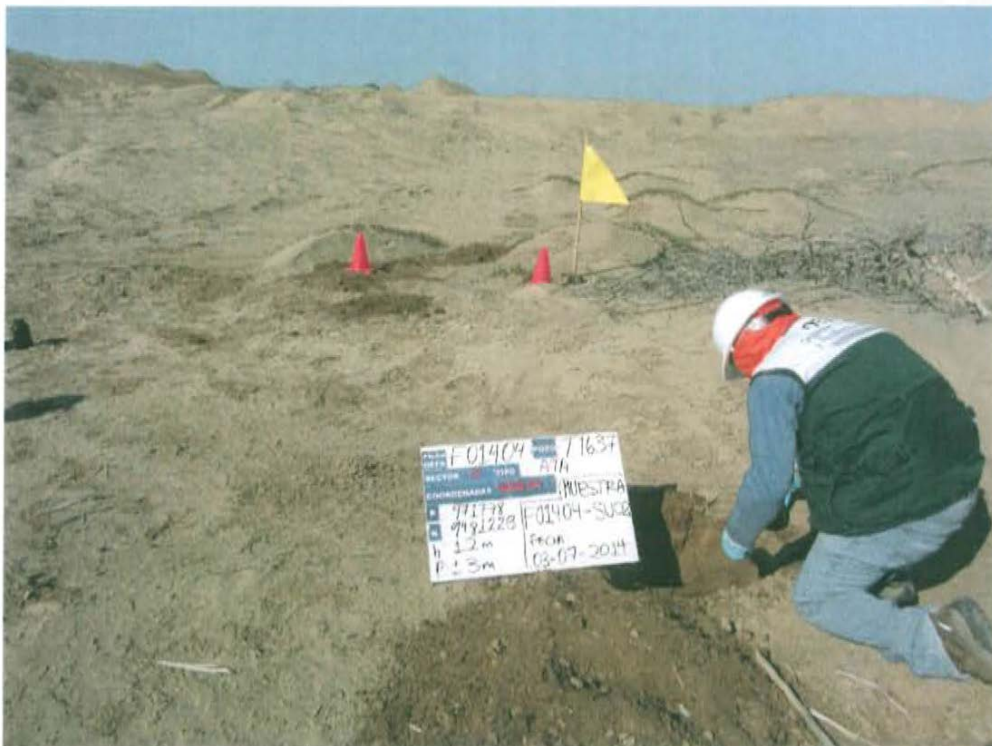
Fotografía N° 4. Toma de muestra de suelo en el punto F01404 -SU02, ubicado a 4,2 m del Pozo T1637.