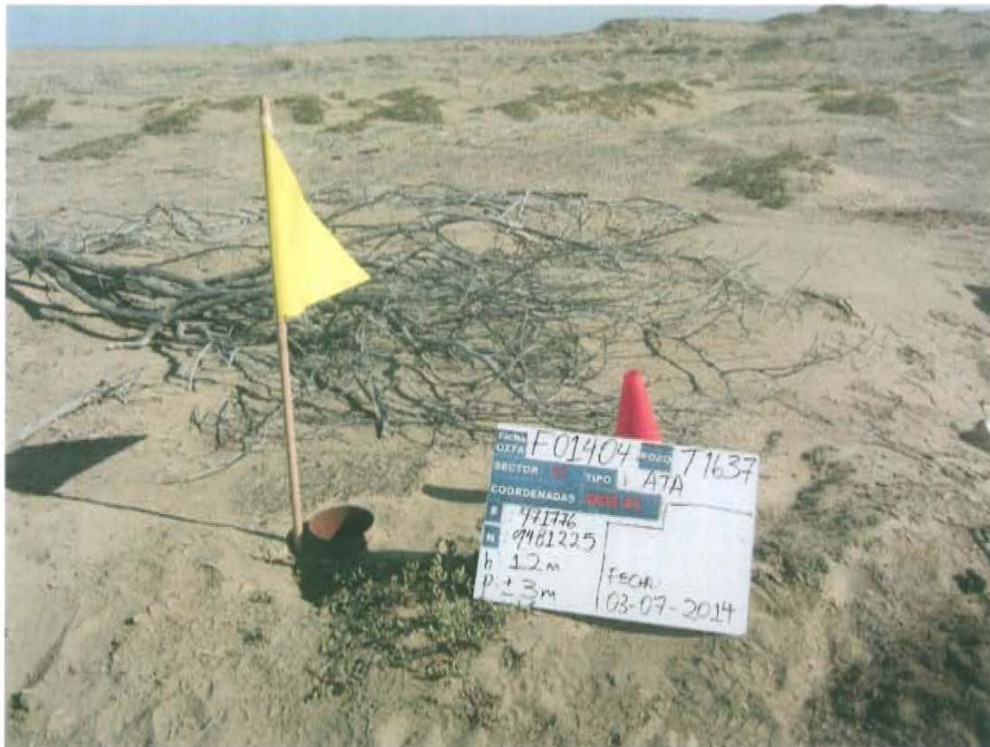
Fotografía N° 1. El Pozo T1637 presenta casing sin cabezal ni válvulas que aseguren su hermetismo por lo que se encuentra abierto y expuesto al ambiente.

"Año de la Promoción de la Industria Responsable y del Compromiso Climático" "Decenio de las Personas con Discapacidad en el Perú"