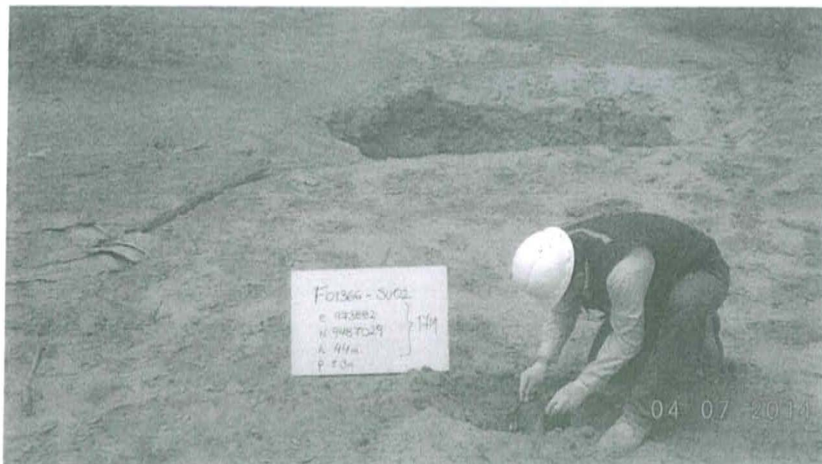
Fotografía N° 2. Toma de muestra de suelo en el punto F01366-SU02, ubicado a 6.2 m aproximadamente del Pozo T3657.