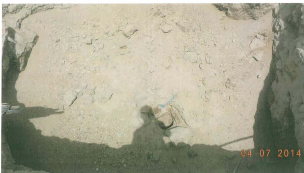
Fotografía N° 2. Se observa pozo inactivo que presenta casing que se encuentra abierto, sin elemento de cierre tales como válvulas, llaves entre otros, que garanticen un cierre hermético del pozo y esta expuesto al ambiente.