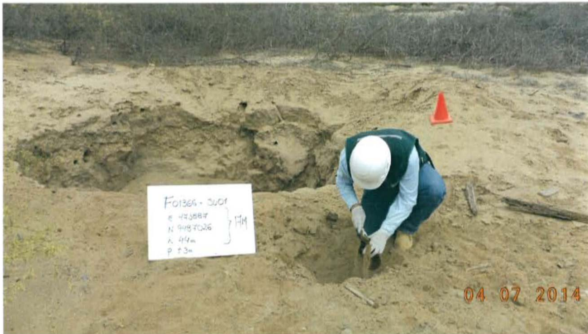
Fotografía N° 3. Toma de muestra de suelo en el punto F01366-SU01, ubicado a 2,9 m aproximadamente del Pozo T3657.

"Año de la Promoción de la Industria Responsable y del Compromiso Climático" "Decenio de las Personas con Discapacidad en el Perú"