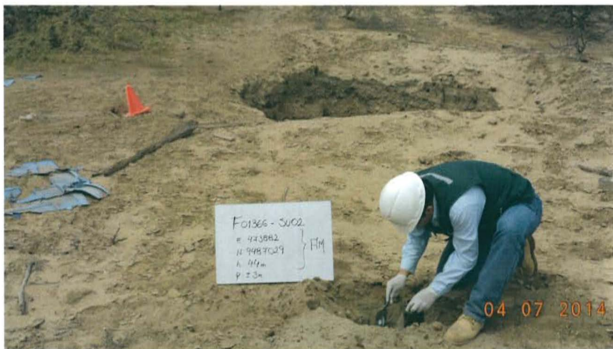
Fotografía N° 4. Toma de muestra de suelo en el punto F01366-SU02, ubicado a 6,2 m aproximadamente del Pozo T3657.