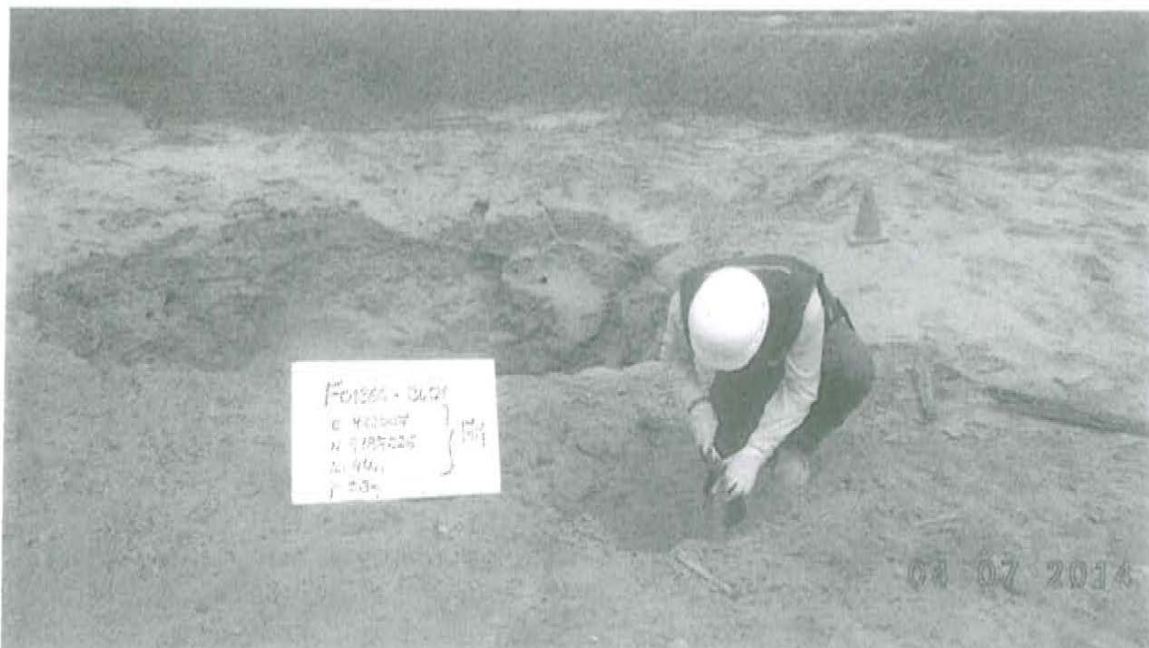
Fotografía N° 1. Toma de muestra de suelo en el punto F01366-SU01, ubicado a 2.9 m aproximadamente del Pozo T3657.

"Decenio de las Personas con Discapacidad en el Perú" "Año de la Promoción de la Industria Responsable y del Compromiso Climático"