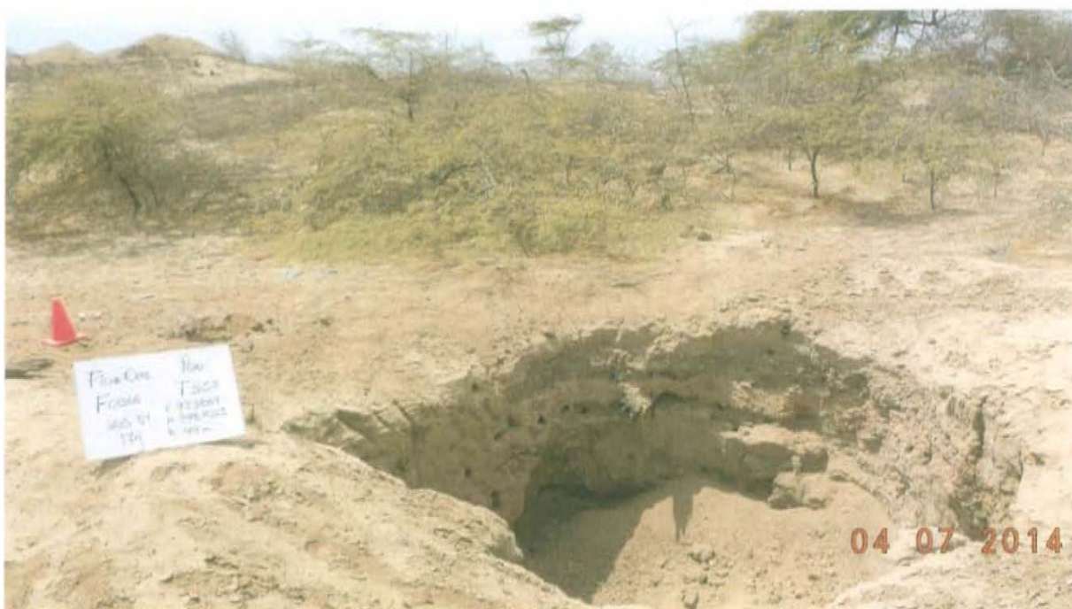
Fotografía N° 1. Se observa la ubicación del pozo inactivo en un terreno no habilitado, observándose también la excavación de 2,1 m de profundidad donde se localizó el pozo.

"Año de la Promoción de la Industria Responsable y del Compromiso Climático" "Decenio de las Personas con Discapacidad en el Perú"