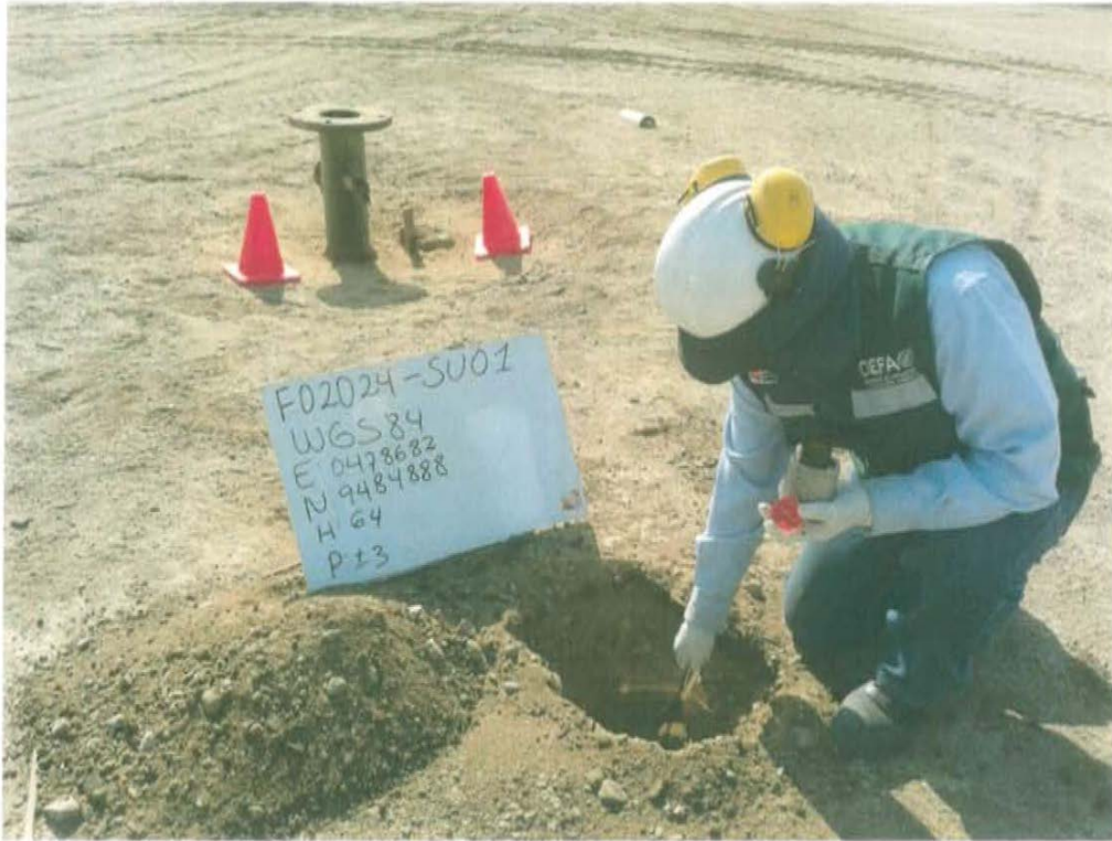
Fotografía N° 3. Toma de muestra de suelo en el punto F02024-SU01, ubicado a 2 m aproximadamente del Pozo T3002.

"Año de la Promoción de la Industria Responsable y del Compromiso Climático" "Decenio de las Personas con Discapacidad en el Perú"