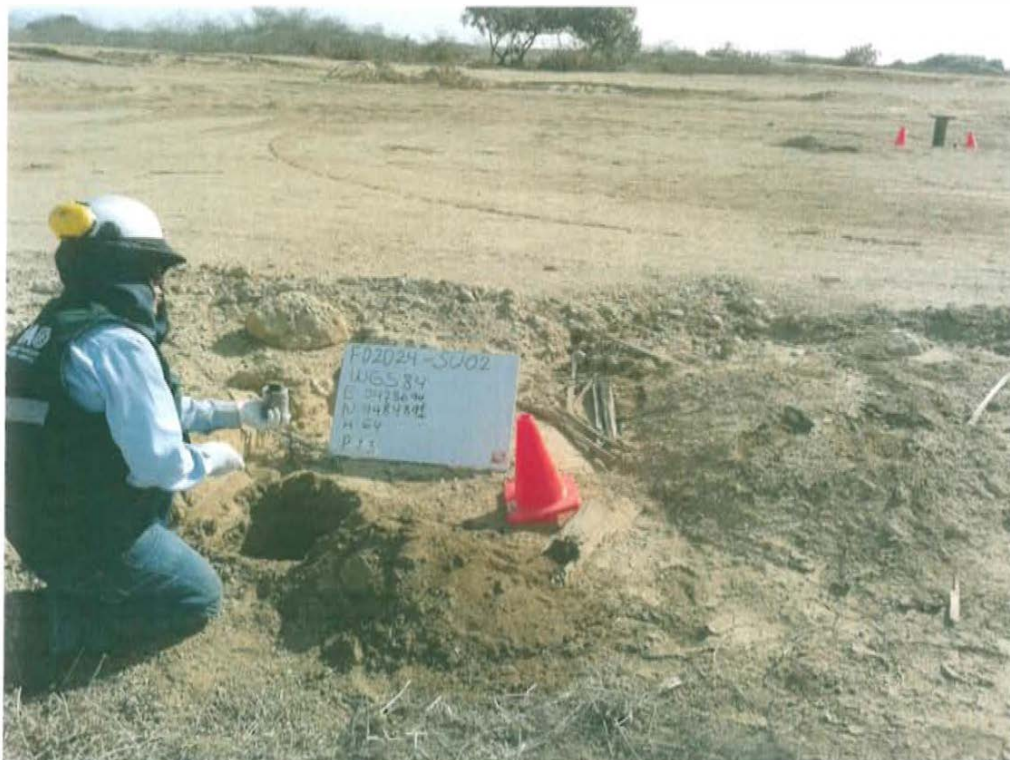
Fotografía N° 4. Toma de muestra de suelo en el punto F02024-SU02, ubicado a 13 m aproximadamente del Pozo T3002.