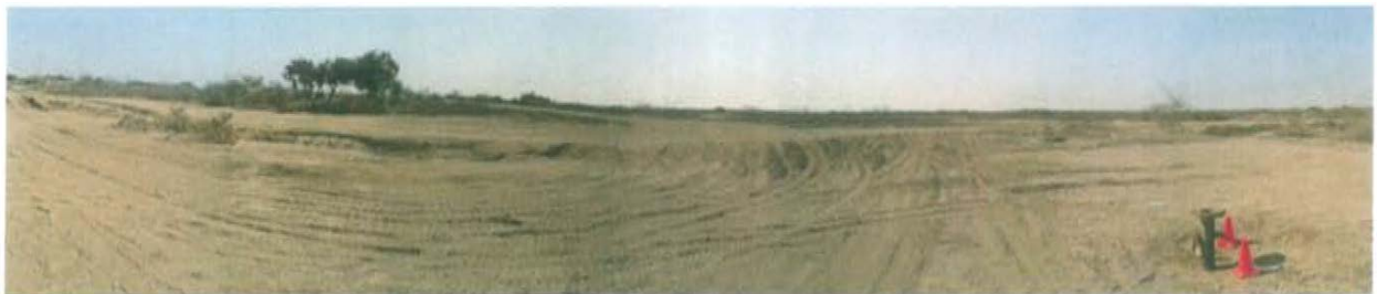
Fotografía N° 2. Vista panorámica del área circundante del pozo inactivo T3002 caracterizado por vegetación conformada por árboles de sapote, algarrobo y pequeñas herbáceas que crecen a nivel del suelo.