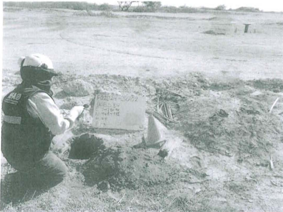
Fotografía N° 2. Toma de muestra de suelo en el punto F02024-SU02, ubicado a 13 m aproximadamente del Pozo T3002.