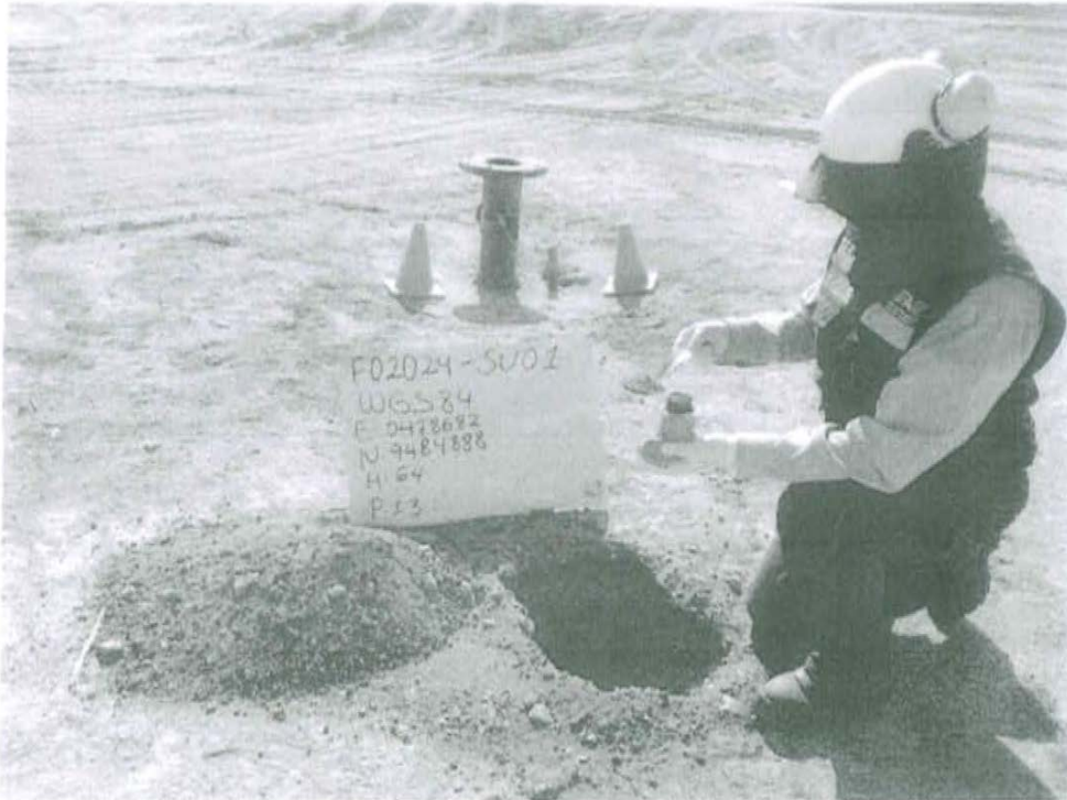
Fotografía N° 1. Toma de muestra de suelo en el punto F02024-SU01, ubicado a 2 m aproximadamente del Pozo T3002.

"Decenio de las Personas con Discapacidad en el Perú" "Año de la Promoción de la Industria Responsable y del Compromiso Climático"