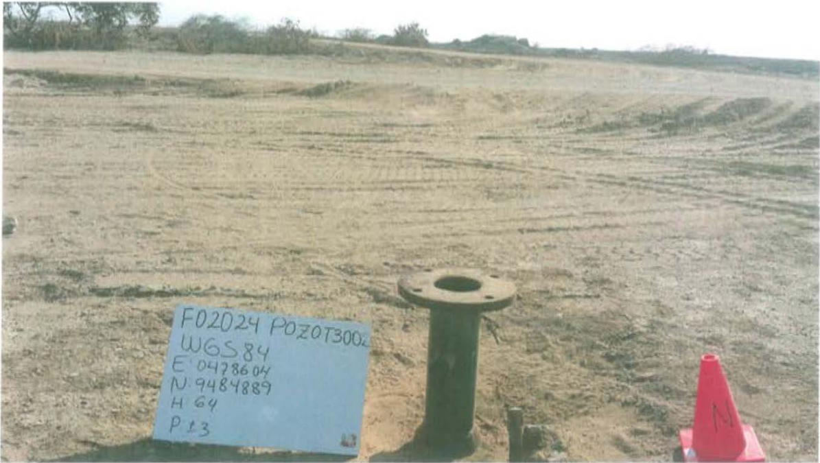
Fotografía N° 1. Pozo T3002, con casing corroído, a 0,25 m de altura sobre el nivel del suelo y 15 plg de diámetro, con brida y sin accesorios que asegure su hermetismo.

"Año de la Promoción de la Industria Responsable y del Compromiso Climático" "Decenio de las Personas con Discapacidad en el Perú"