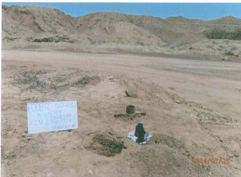
Fotografía N° 3. Toma de muestra de suelo en el punto F00836-SU01 a 0,80 m aproximadamente del pozo y a una profundidad de 0,45 m.

"Año de la Promoción de la Industria Responsable y del Compromiso Climático" "Decenio de las Personas con Discapacidad en el Perú"