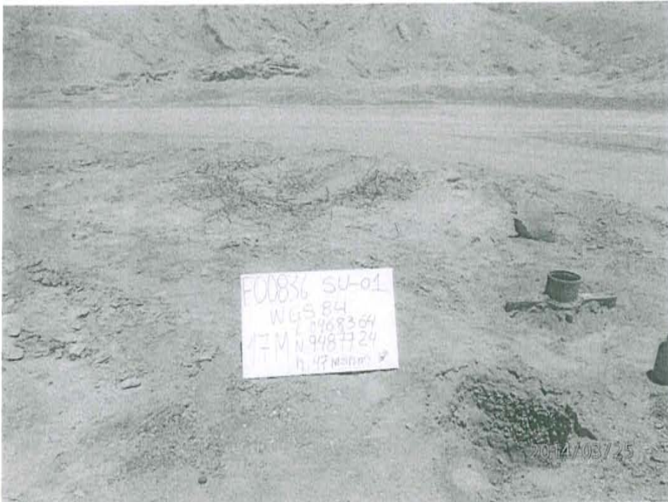
Fotografía N° 1. Toma de muestra de suelo en el punto F00836-SU01, ubicado a 0,80 m aproximadamente del Pozo T_859.

"Decenio de las Personas con Discapacidad en el Perú" "Año de la Promoción de la Industria Responsable y del Compromiso Climático"