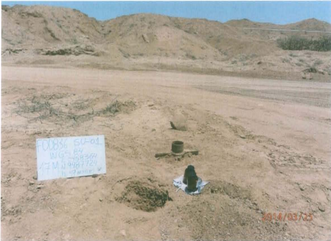
Fotografía N° 1. Pozo inactivo, se observa el casing corrido cortado y abierto expuesto al ambiente.

"Año de la Promoción de la Industria Responsable y del Compromiso Climático" "Decenio de las Personas con Discapacidad en el Perú"