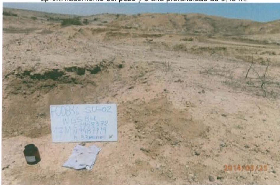
Fotografía N° 4. Punto de muestreo de suelo de F00836-SU02 a 15 m del pozo y a una profundidad de 0,36 m.