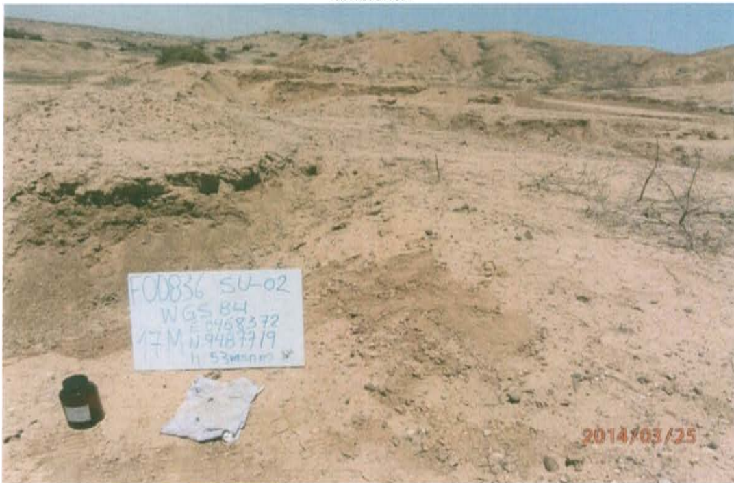
Fotografía N° 2. Vista panorámica de la ubicación del pozo.