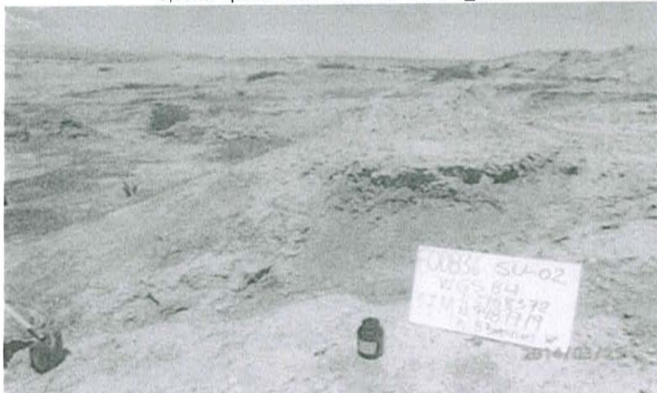
Fotografía N° 2. Toma de muestra de suelo en el punto F00836-SU02, ubicado a 15 m aproximadamente del Pozo T_859.