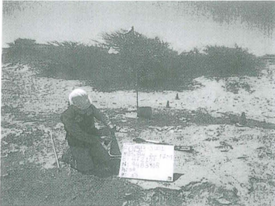
Fotografía N° 1. Toma de muestra de suelo en el punto F01513-SU01, ubicado a 3 m aproximadamente del Pozo T1630.

"Decenio de las Personas con Discapacidad en el Perú" "Año de la Promoción de la Industria Responsable y del Compromiso Climático"