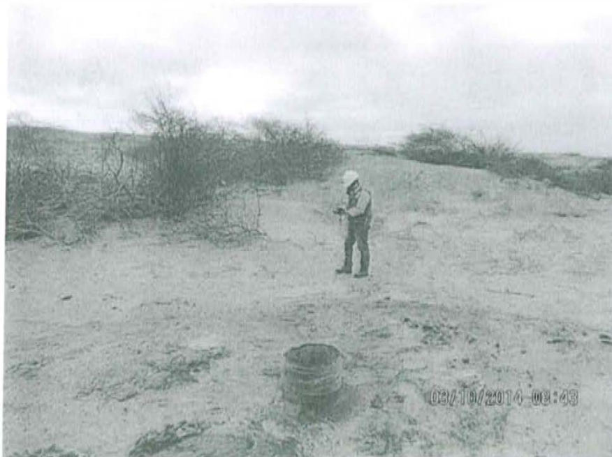
Fotografía N° 2. Mediciones en F01513-VA01, recorrido en el área circundante alrededor del pozo.