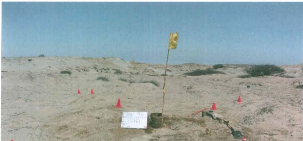
Fotografía N° 2. Vista panorámica del área circundante del pozo inactivo T1630.