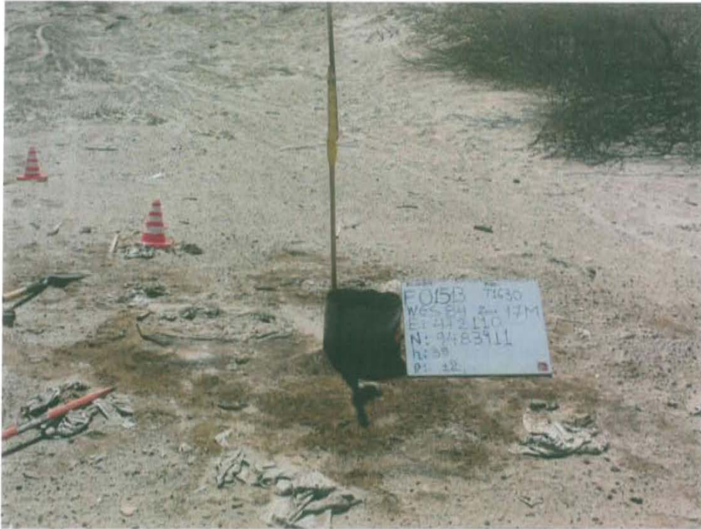
Fotografía N° 1. Identificación del pozo inactivo con código PERUPETRO T1630. Presenta casing abierto al medio ambiente.

"Año de la Promoción de la Industria Responsable y del Compromiso Climático" "Decenio de las Personas con Discapacidad en el Perú"