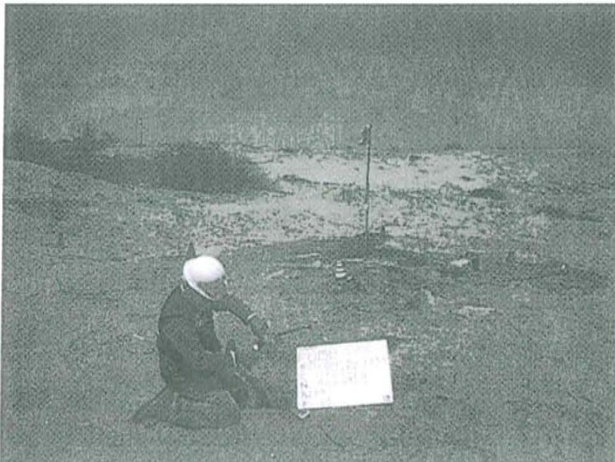
Fotografía N° 2. Toma de muestra de suelo en el punto F01513-SU02, ubicado a 6 m aproximadamente del Pozo T1630.