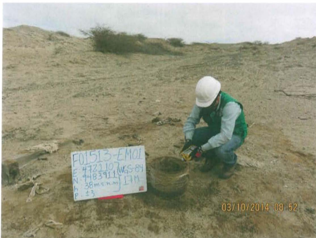
Fotografía N° 4. Medición en el punto F01513-EM01, ubicado en la fuente de emisión en boca del Pozo T1630.