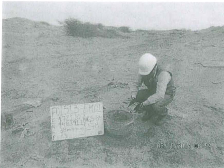
Fotografía N° 1. Medición en el punto F01513-EM01, ubicado en la boca del pozo.

"Año de la Promoción de la Industria Responsable y del Compromiso Climático" "Decenio de las Personas con Discapacidad en el Perú"