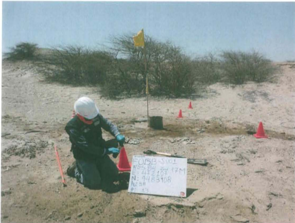
Fotografía N° 3. Toma de muestra de suelo en el punto F01513-SU01, ubicado aproximadamente a 3 m al oeste del Pozo T1630.

"Año de la Promoción de la Industria Responsable y del Compromiso Climático" "Decenio de las Personas con Discapacidad en el Perú"