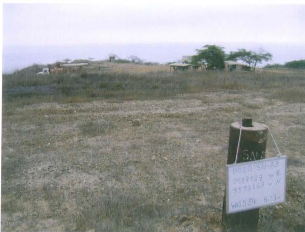
Fotografía N° 2. No se observa afloramientos de fluidos ni derrames recientes alrededor del pozo y no se perciben olores característicos a hidrocarburos procedentes de emisiones desde el pozo.