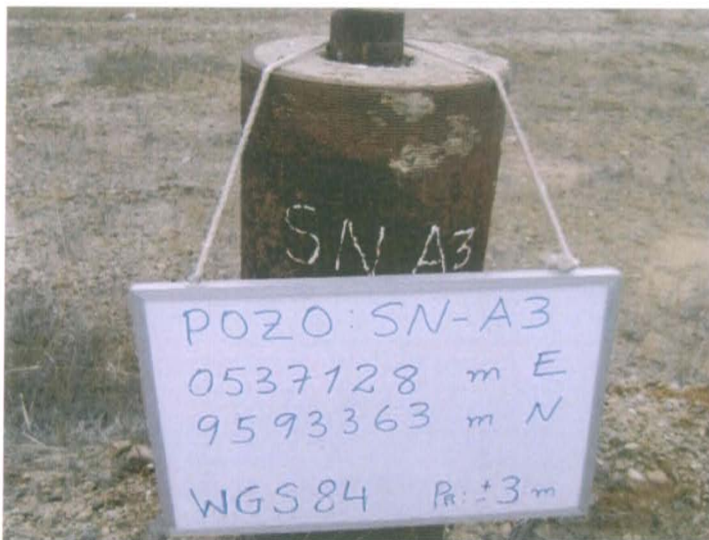
Fotografía N° 1. Se observa un pozo inactivo, que presenta un casing que sobresale 0,7 m sobre el nivel de superficie del suelo, no cuenta con cabezal ni válvulas que aseguren su hermetismo.