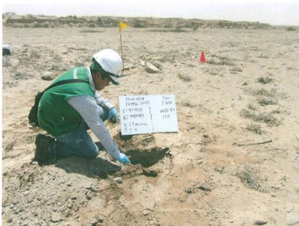
Fotografía N° 4. Toma de muestra de suelo en el punto F01956 -SU02, ubicado a 4 m en dirección este del Pozo T3232.