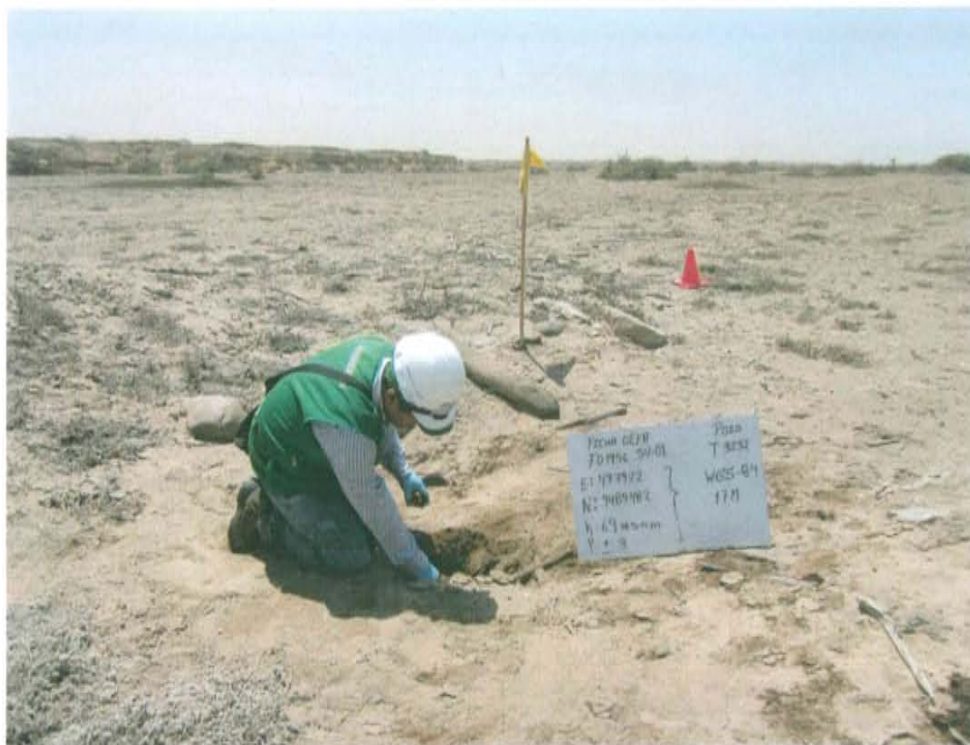
Fotografía N° 3. Toma de muestra de suelo en el punto F01956 -SU01, ubicado a 1 m en dirección sur del Pozo T3232.

"Año de la Promoción de la Industria Responsable y del Compromiso Climático" "Decenio de las Personas con Discapacidad en el Perú"