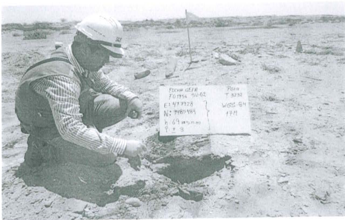
Fotografía N° 2. Toma de muestra de suelo en el punto F01956-SU02, ubicado a 4 m aproximadamente del Pozo.