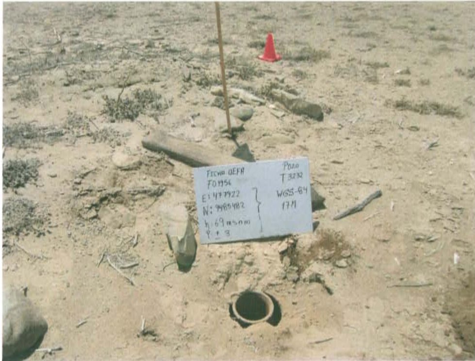
Fotografía N° 1. Se observa casing del Pozo T3232 al ras del suelo abierto y expuesto al ambiente.

"Año de la Promoción de la Industria Responsable y del Compromiso Climático" "Decenio de las Personas con Discapacidad en el Perú"