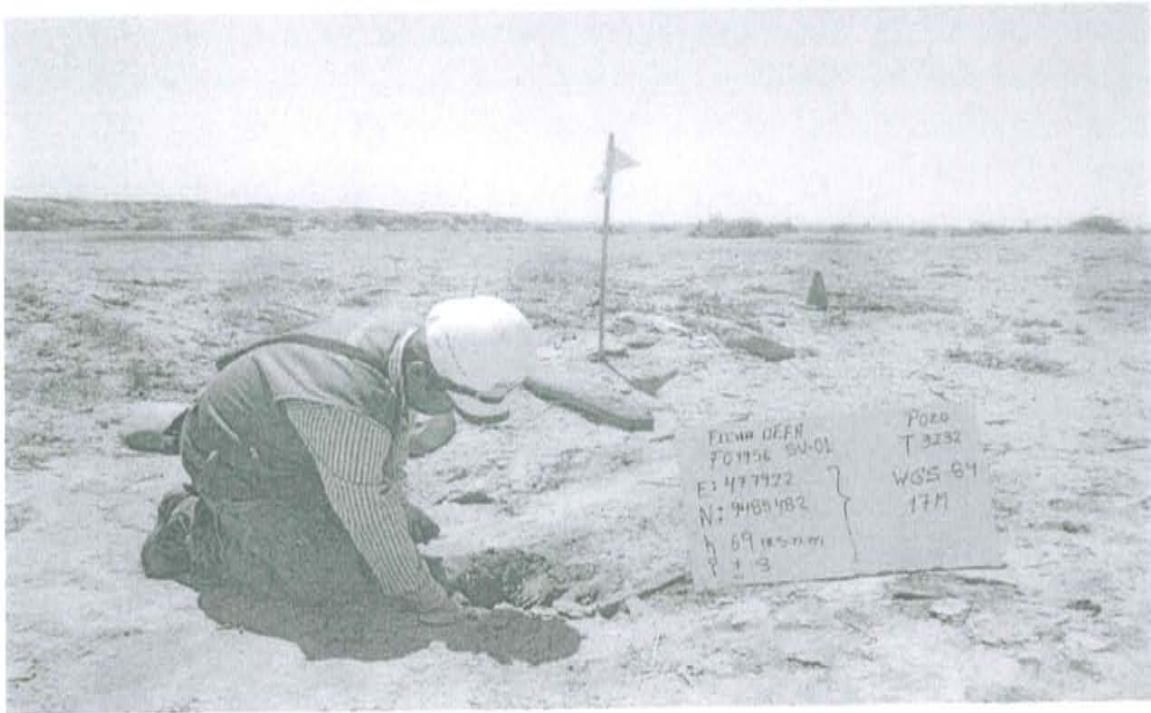
Fotografía N° 1. Toma de muestra de suelo en el punto F01956-SU01, ubicado a 1 m aproximadamente del Pozo.

"Decenio de las Personas con Discapacidad en el Perú" "Año de la Promoción de la Industria Responsable y del Compromiso Climático"