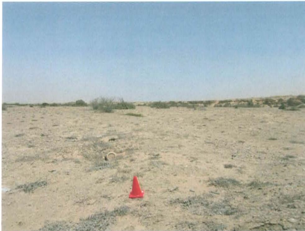
Fotografía N° 2. Vista panorámica donde se ubica el Pozo T3232.