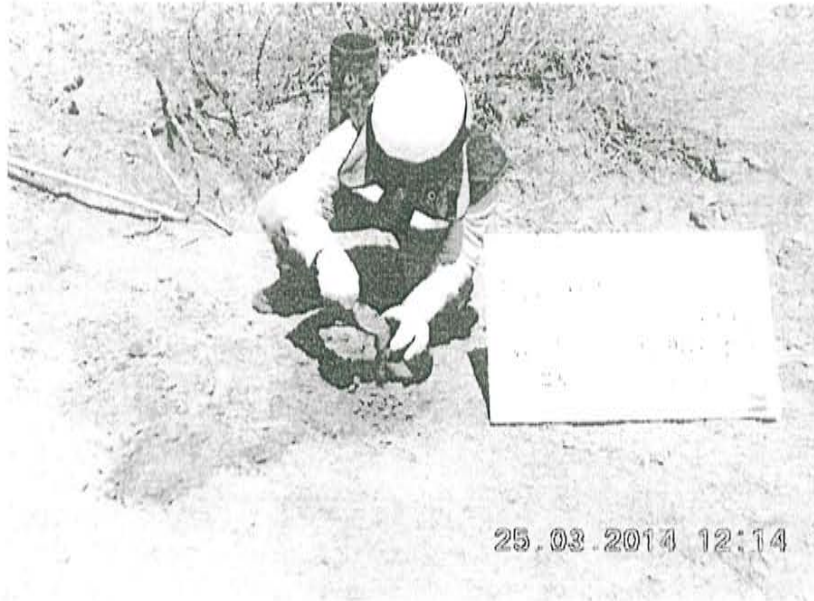
Fotografía N° 1. Toma de muestra de suelo en el punto F00849-SU01, ubicado a 1,4 m aproximadamente del Pozo T5192.

"Decenio de las Personas con Discapacidad en el Perú" "Año de la Promoción de la Industria Responsable y del Compromiso Climático"