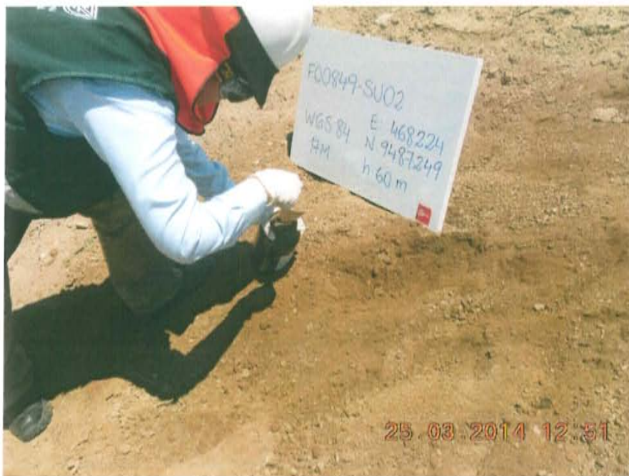
Fotografía N° 4. Punto (F00849-SU02) donde se recolectó la muestra de suelo, ubicado a 20-m de la ubicación del pozo.