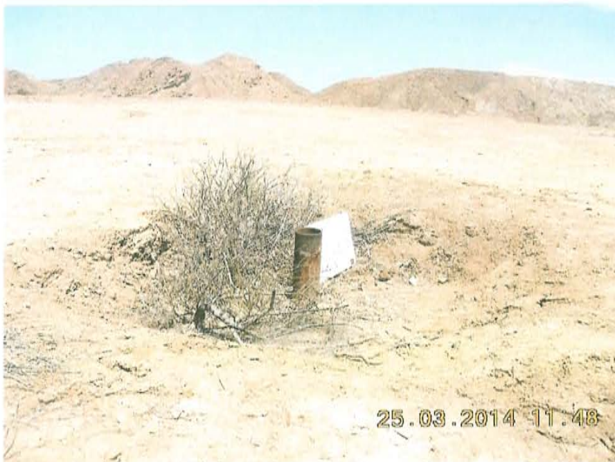
Fotografía N° 2. El casing sobresale 0,2 m del interior de un hoyo de 4 m 2 y 0,45 m de profundidad, junto a un arbusto seco.