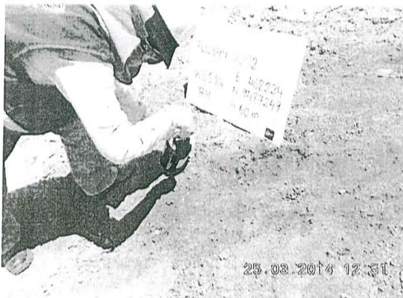
Fotografía N° 2. Toma de muestra de suelo en el punto F00849-SU02, ubicado a 27,6 m aproximadamente del Pozo T5192, en una pendiente.