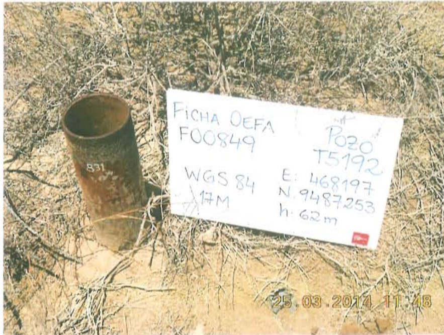
Fotografía N° 1. Vista superior del Casing de 6-pulg de diámetro, abierto, sin cabezal ni válvulas que aseguren su hermetismo.

"Año de la Promoción de la Industria Responsable y del Compromiso Climático" "Decenio de las Personas con Discapacidad en el Perú"