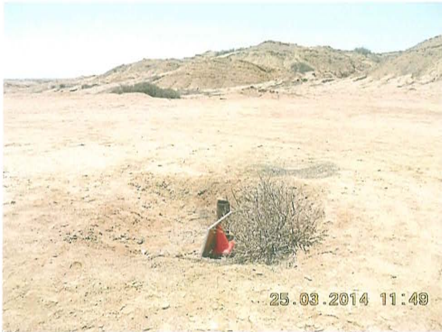
Fotografía N° 3. El Pozo T5192 estaba ubicado en un suelo cuya geomorfología era de tipo llanura o planicie aluvial.

"Año de la Promoción de la Industria Responsable y del Compromiso Climático" "Decenio de las Personas con Discapacidad en el Perú"