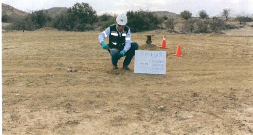
Fotografía N° 4. Toma de muestra de suelo en el punto F01709-SU02, ubicado a 6 m aproximadamente del Pozo T2969.