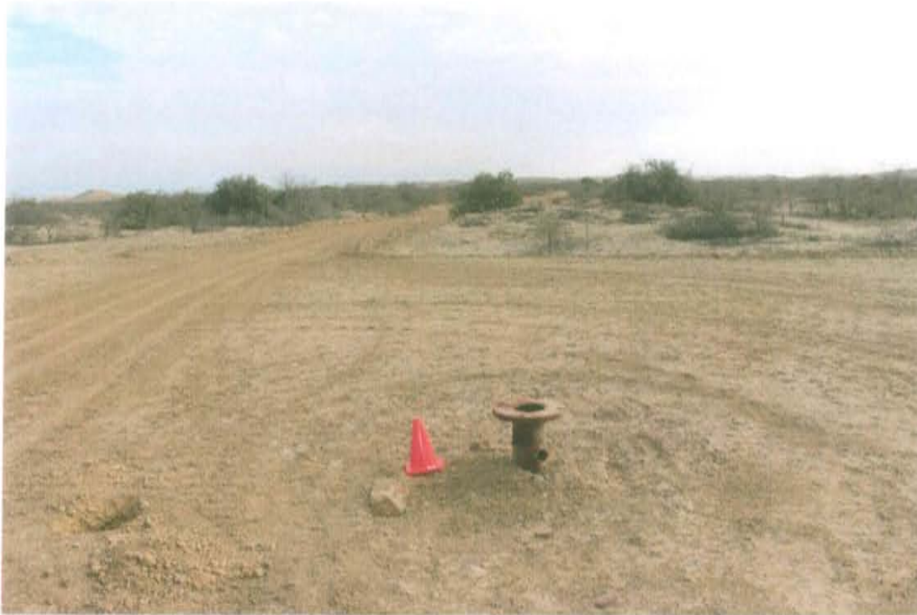
Fotografía N° 1. Vista panorámica de Pozo inactivo, ubicado un terreno plano, presenta acceso vehicular.

"Año de la Promoción de la Industria Responsable y del Compromiso Climático" "Decenio de las Personas con Discapacidad en el Perú"