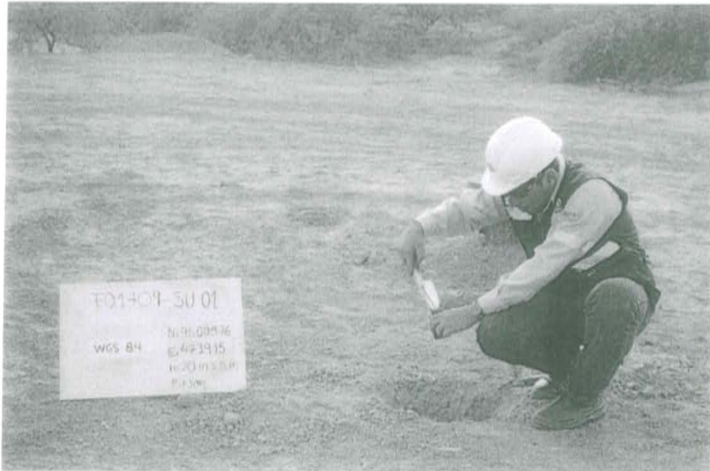
Fotografía N° 1. Toma de muestra de suelo en el punto F01709-SU01, ubicado a 2 m. aproximadamente del Pozo T2969.

"Decenio de las Personas con Discapacidad en el Perú" "Año de la Promoción de la Industria Responsable y del Compromiso Climático"