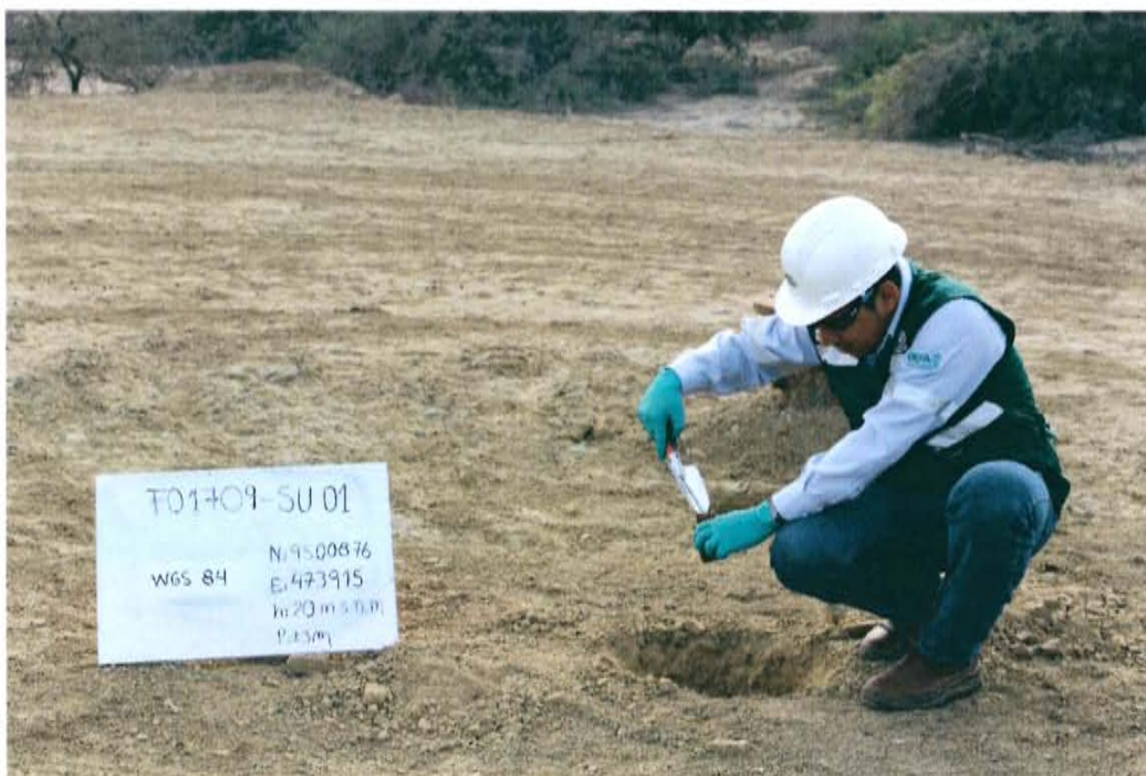
Fotografía N° 3. Toma de muestra de suelo en el punto F01709-SU01, ubicado a 2 m aproximadamente del Pozo T2969.

"Año de la Promoción de la Industria Responsable y del Compromiso Climático" "Decenio de las Personas con Discapacidad en el Perú"