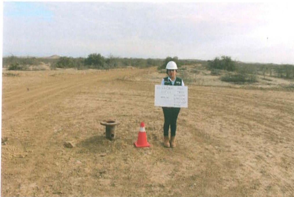
Fotografía N° 2. Se observa casing unido la parte inferior correspondiente a la brida que se encuentra abierta y expuesta al ambiente.