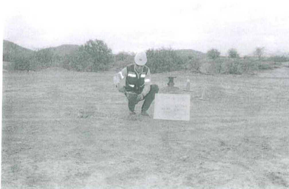
Fotografía N° 2. Toma de muestra de suelo en el punto F01709-SU02, ubicado a 6 m. aproximadamente del Pozo T2969.