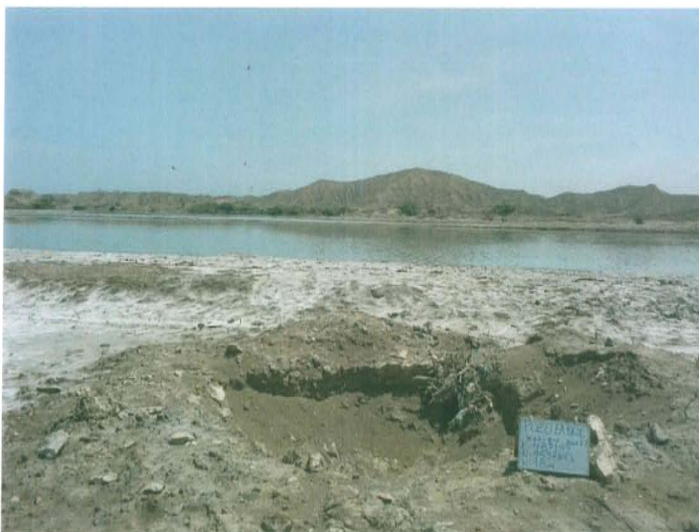
Fotografía N° 2. Vista panorámica de la posible ubicación del pozo A10606, ubicado a 10 m de pozas de tratamiento de agua.