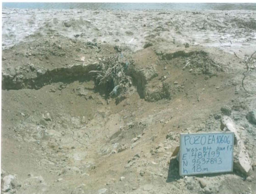
Fotografía N° 1. Vista de la posible ubicación del pozo A10606, se aprecia restos de concreto y residuos sólidos en el interior y fuera del hoyo.

"Año de la Promoción de la Industria Responsable y del Compromiso Climático" "Decenio de las Personas con Discapacidad en el Perú"