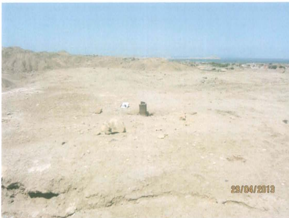
Fotografía N° 1. La zona evaluada se caracteriza por tener un relieve llano y árido, asimismo se observó algunas formas que incide sobre el relieve del área como lomas y colinas.

"Año de la Promoción de la Industria Responsable y del Compromiso Climático" "Decenio de las Personas con Discapacidad en el Perú"