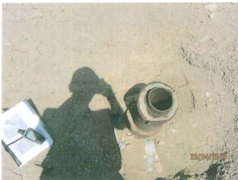
Fotografía N° 2. Pozo inactivo mal abandonado sin cabezal, con casing cementado y dos tubos internos, no sellado herméticamente.