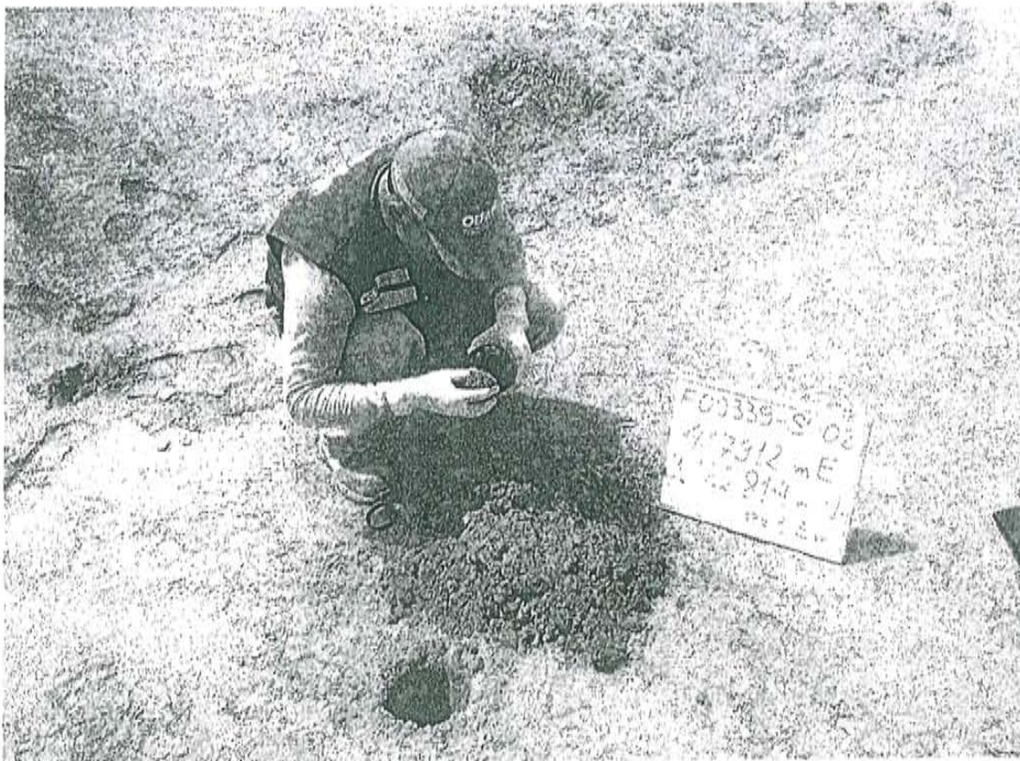
Fotografía N° 2. Toma de muestra de suelo en el punto F00339-SU02, ubicado a 13 m aproximadamente del Pozo T_447.