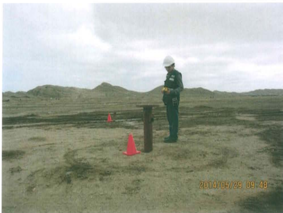
Fotografía N° 6. Medición en los alrededores, a 1 m aproximadamente del pozo.