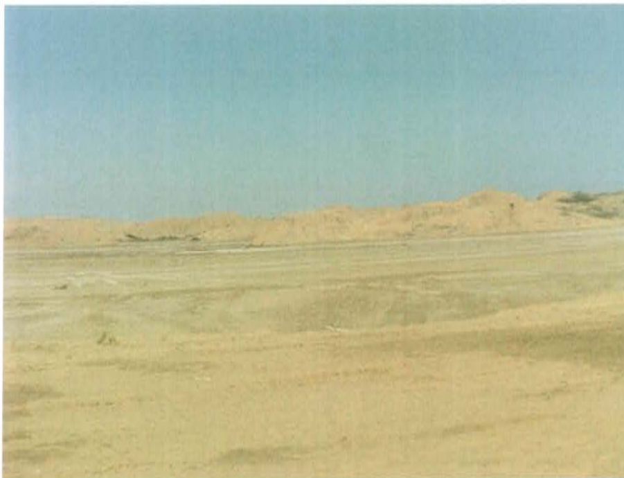
Fotografía N° 2. Vista del área evaluada, zona desértica de topografía plana.