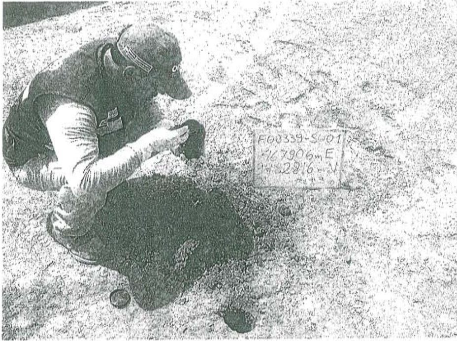
Fotografía N° 1. Toma de muestra de suelo en el punto F00339-SU01, ubicado a 5 m aproximadamente del Pozo T_447.

"Decenio de las Personas con Discapacidad en el Perú" "Año de la Promoción de la Industria Responsable y del Compromiso Climático"