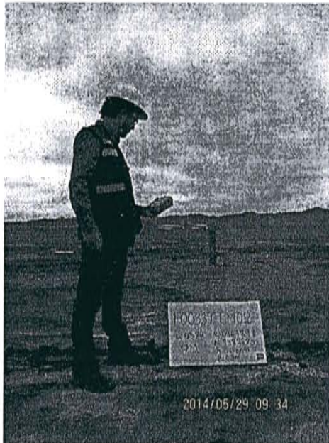
Fotografía N° 3. Medición en el punto F00339-EM02, ubicado a 6 m del Pozo T_447 sotavento.

"Decenio de las Personas con Discapacidad en el Perú" "Año de la Promoción de la Industria Responsable y del Compromiso Climático"