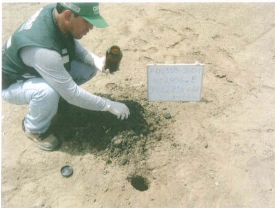
Fotografía N° 3. Toma de muestra de suelo en el punto F00339-SU01, a 5 m aproximadamente del pozo.

"Año de la Promoción de la Industria Responsable y del Compromiso Climático" "Decenio de las Personas con Discapacidad en el Perú"