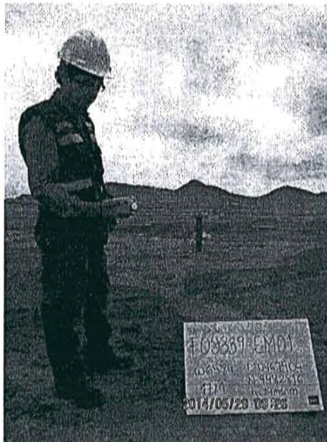
Fotografía N° 4. Medición en el punto F00339-EM01, ubicado a 6 m del Pozo T_447 a barlovento.