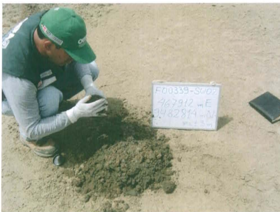
Fotografía N° 4. Toma de muestra de suelo en el punto F00339-SU02, a una distancia de aproximadamente 13 m del pozo.