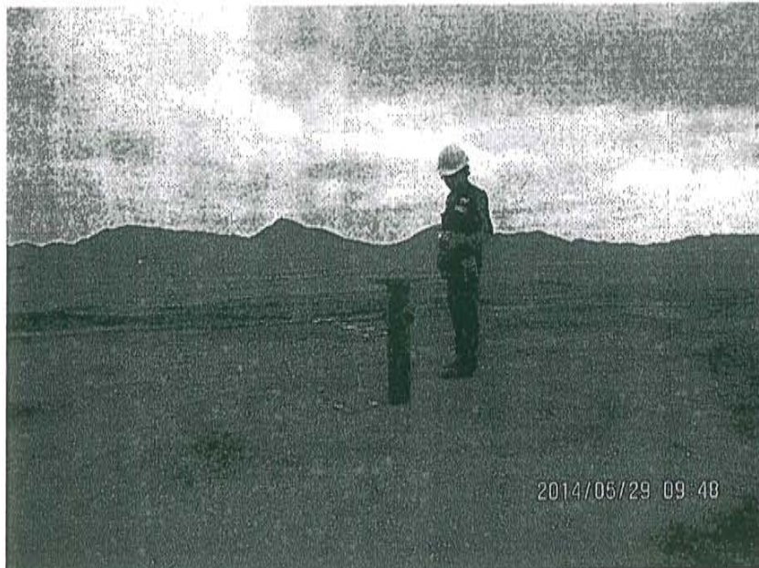
Fotografía N° 2. Mediciones en el punto F00339-EM03, se realizó en un recorrido en el área circundante alrededor del Pozo T_447 en un radio de 1 m, con una duración de 10 minutos.