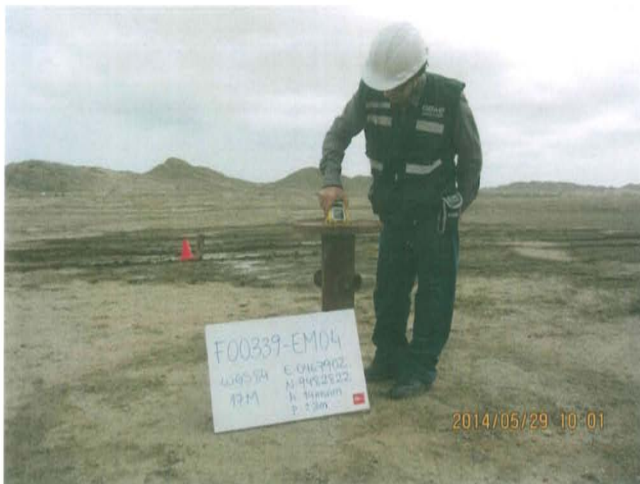
Fotografía N° 5. Medición de emisiones gaseosas fugitivas en boca de pozo.

"Año de la Promoción de la Industria Responsable y del Compromiso Climático" "Decenio de las Personas con Discapacidad en el Perú"