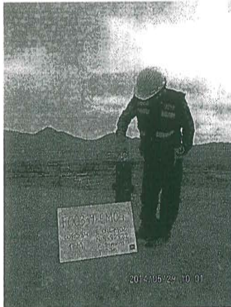
Fotografía N° 1. Medición en el punto F00339-EM04, ubicado en la fuente de emisión, en boca del Pozo T_447.

"Decenio de las Personas con Discapacidad en el Perú" "Año de la Promoción de la Industria Responsable y del Compromiso Climático"