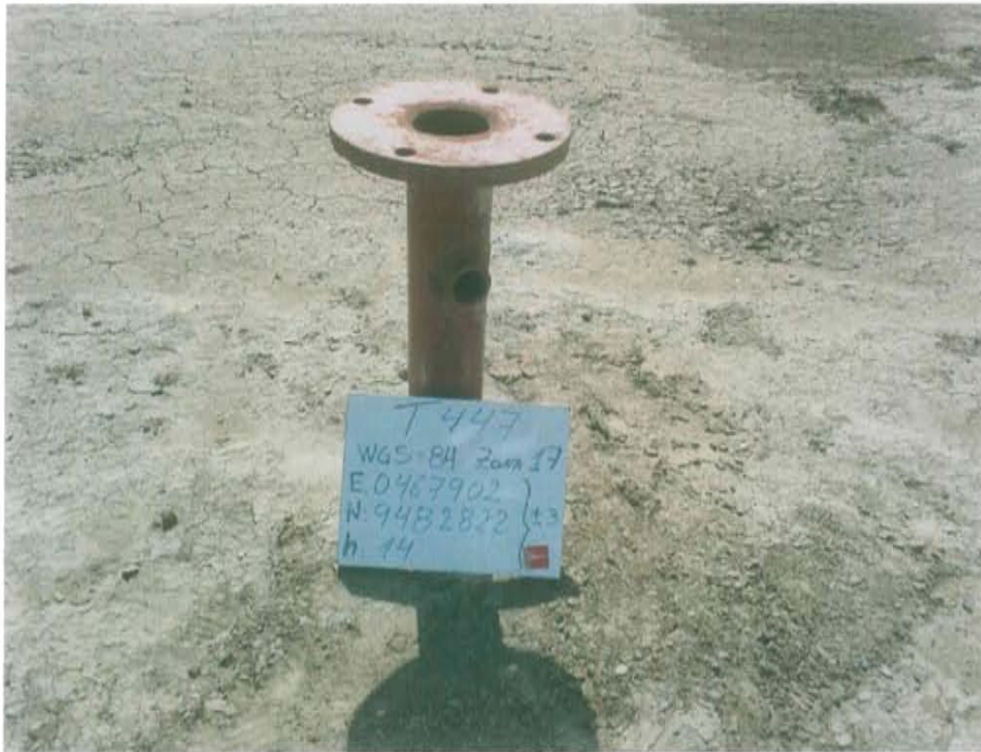
Fotografía N° 1. Pozo inactivo T_447, presenta tubería con brida abierta al ambiente.

"Año de la Promoción de la Industria Responsable y del Compromiso Climático" "Decenio de las Personas con Discapacidad en el Perú"