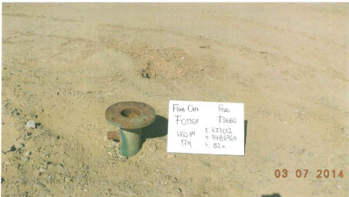
Fotografía N° 2. Se observa pozo inactivo que presenta casing con la parte inferior de la brida adaptadora que se encuentra abierto, sin elemento de cierre tales como válvulas, llaves entre otros, que garantizan un cierre hermético del pozo.