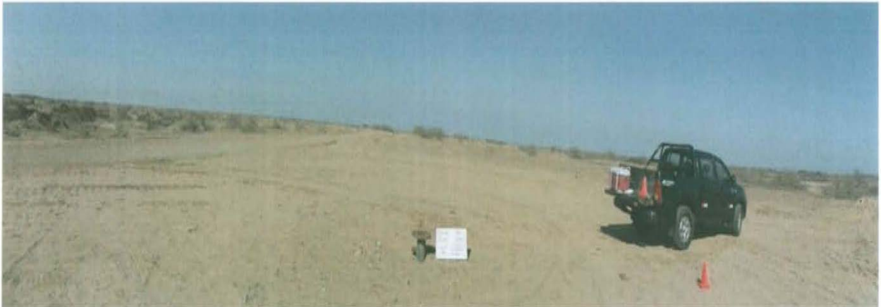
Fotografía N° 1. Se observa la ubicación del pozo inactivo en un terreno habilitado.

"Año de la Promoción de la Industria Responsable y del Compromiso Climático" "Decenio de las Personas con Discapacidad en el Perú"