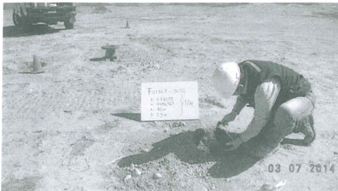
Fotografía N° 2. Toma de muestra de suelo en el punto F01367-SU01, ubicado a 3.8 m aproximadamente del Pozo T2660.