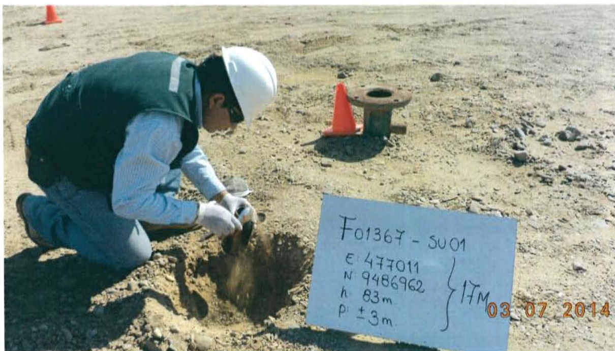
Fotografía N° 3. Toma de muestra de suelo en el punto F01367-SU01, ubicado a 1,3 m aproximadamente del Pozo T2660.

"Año de la Promoción de la Industria Responsable y del Compromiso Climático" "Decenio de las Personas con Discapacidad en el Perú"