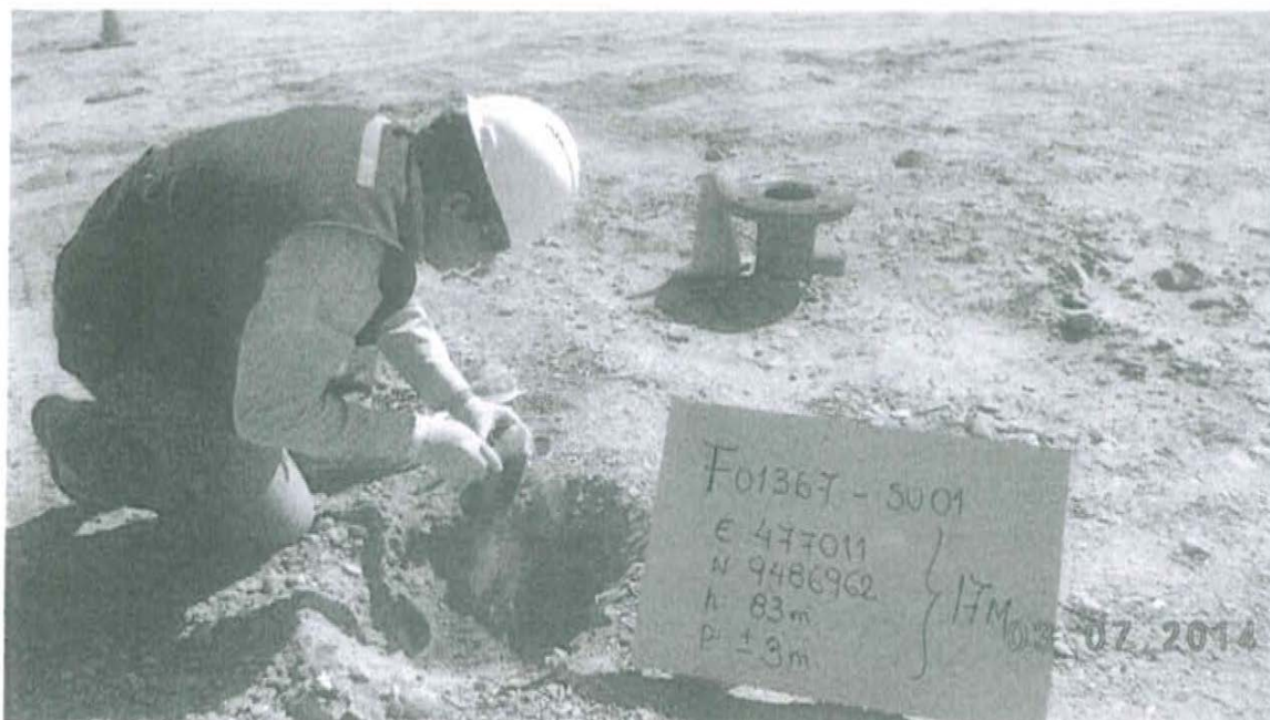
Fotografía N° 1. Toma de muestra de suelo en el punto F01367-SU01, ubicado a 1.3 m aproximadamente del Pozo T2660.

"Decenio de las Personas con Discapacidad en el Perú" "Año de la Promoción de la Industria Responsable y del Compromiso Climático"