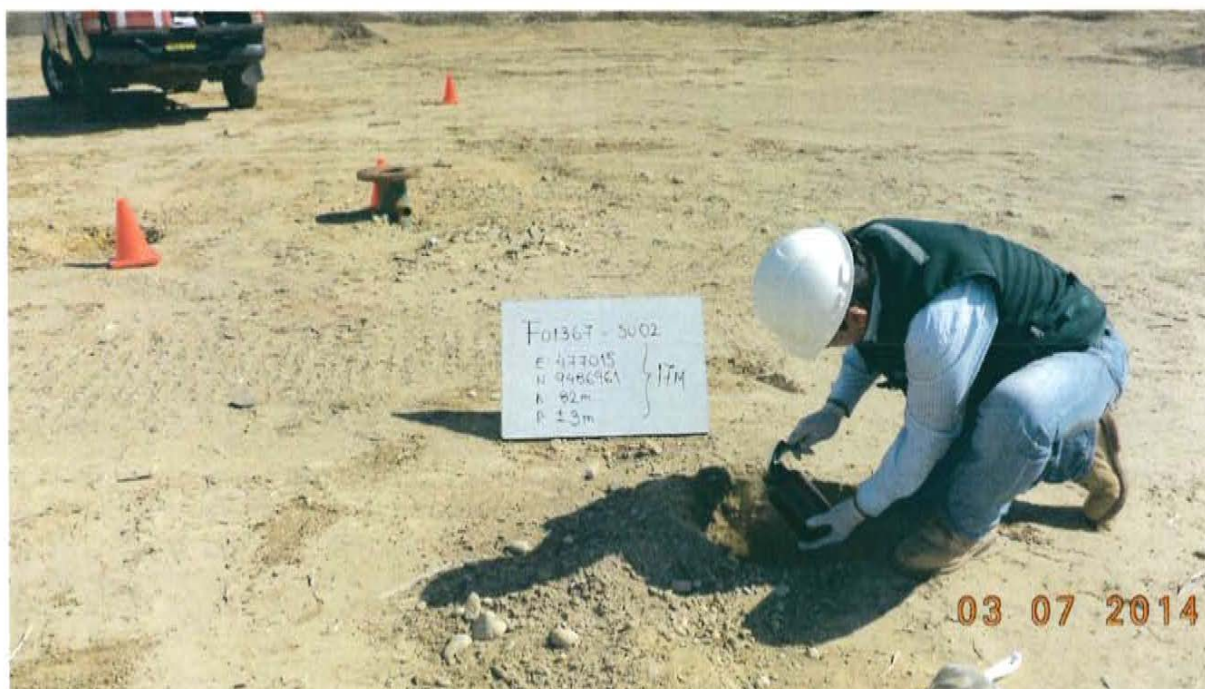
Fotografía N° 4. Toma de muestra de suelo en el punto F01367-SU01, ubicado a 3,8 m aproximadamente del Pozo T2660.