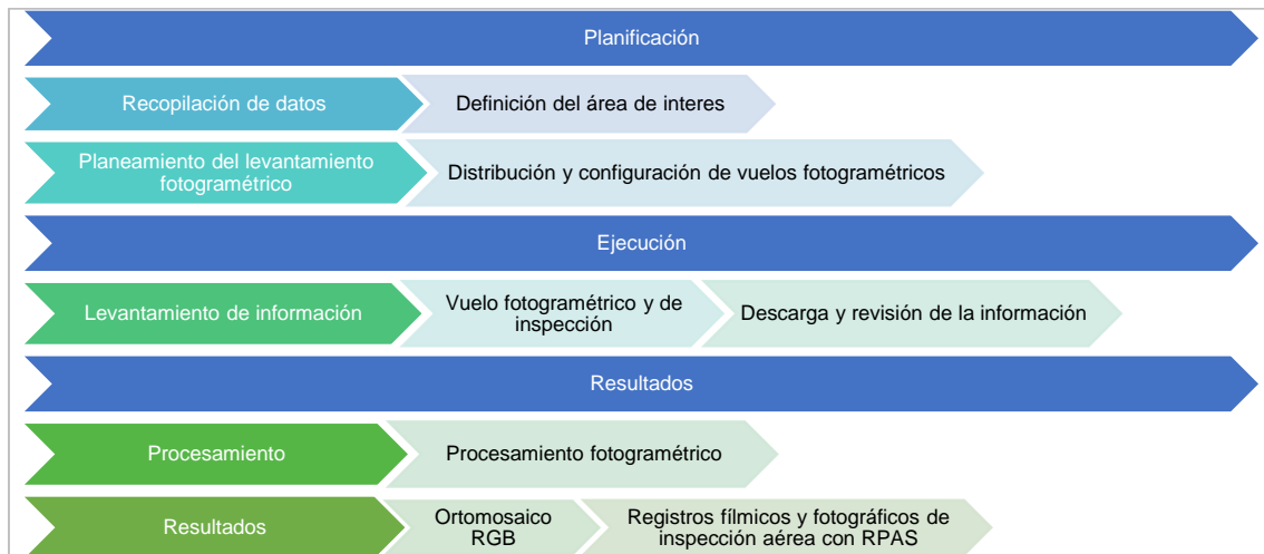
Figura 5.1. Esquema metodológico

Para exploración aérea mediante levantamiento fotogramétrico con RPAS se utilizó como referencia la Guía Metodológica para la Obtención de Productos Cartográficos generados a partir de Imágenes RPAS a escala 1:1000 elaborada por el Instituto Geográfico Nacional (en adelante IGN), teniendo en cuenta las siguientes etapas y consideraciones: