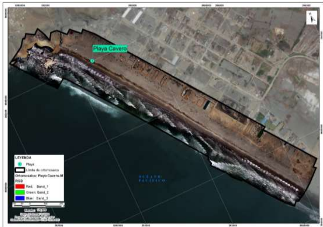
Figura 6.1. Ortomosaico RGB de la Zona I: playa Cavero.

«Decenio de la igualdad de oportunidades para mujeres y hombres» «Año del fortalecimiento de la soberanía nacional»