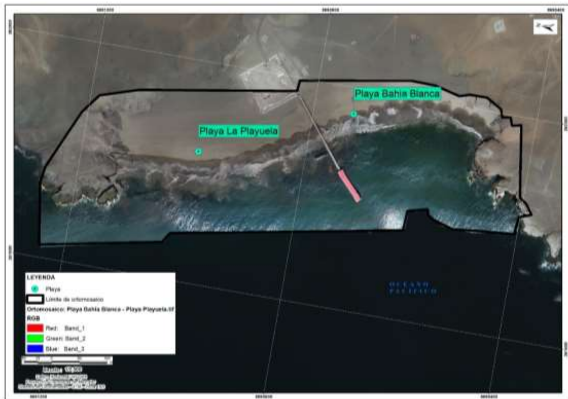
Figura 6.2. Ortomosaico RGB de la Zona II: playas Bahía Blanca y Playuela.