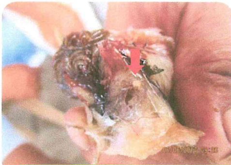
Figura 1. Quiste en músculos laterales