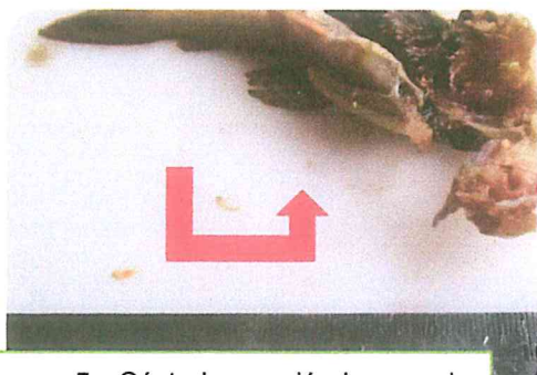
Figura 5. Céstodo moviéndose a la izquierda