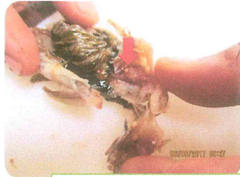
Figura 2. Quistes en la cabeza