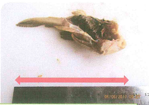
Figura 3. Tamaño de pez (aprox. 11 cm)