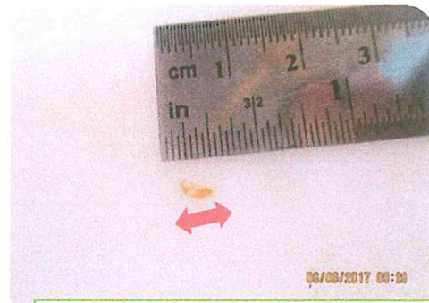
Figura 4. Tamaño del quiste (aprox. 3 mm)