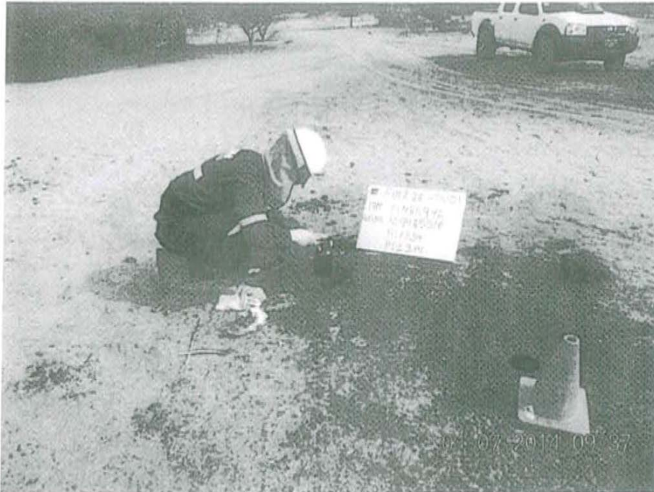
Fotografía N° 1. Toma de muestra de suelo en el punto F01226-SU01, ubicado a 1,07 m aproximadamente del Pozo T2548.

"Decenio de las Personas con Discapacidad en el Perú" "Año de la Promoción de la Industria Responsable y del Compromiso Climático"