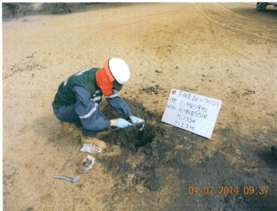
Fotografía N° 4. Toma de muestras de suelo en el punto F01226-SU01 ubicado a 1,07·m del pozo T2548, donde el suelo presenta hidrocarburos