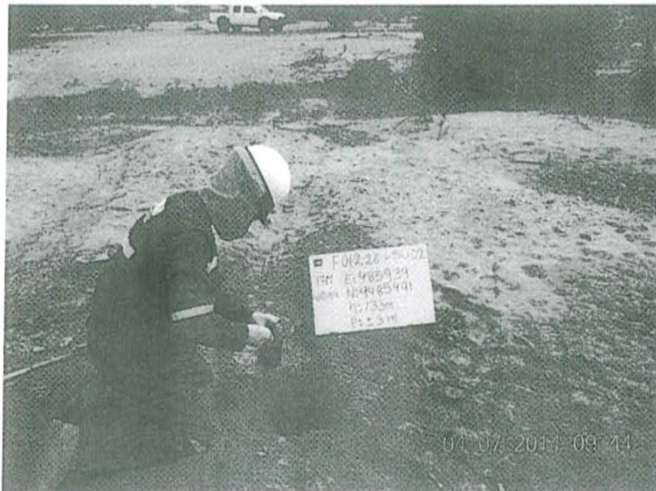
Fotografía N° 2. Toma de muestra de suelo en el punto F01226-SU02, ubicado a 33 m aproximadamente del Pozo T2548.