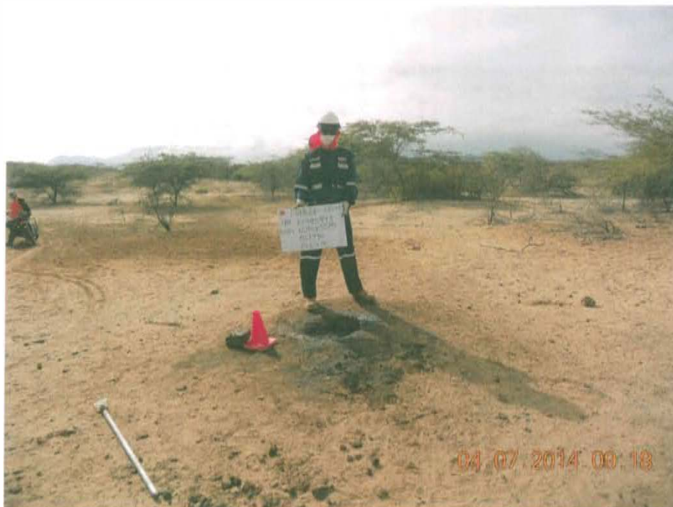
Fotografía N° 2. Coordenadas de ubicación del pozo T2548.