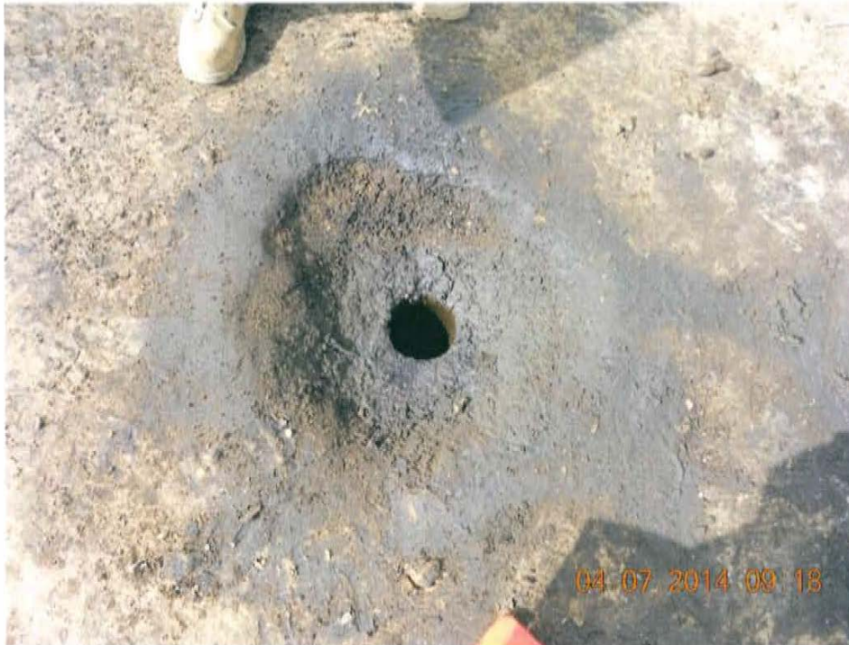
Fotografía N° 3. Se observa casing de 5 pulg de diámetro en el interior de un hoyo de sección circular de 0,2 m 2 x 0,1 m de profundidad, impregnado con hidrocarburos.

"Año de la Promoción de la Industria Responsable y del Compromiso Climático" "Decenio de las Personas con Discapacidad en el Perú"