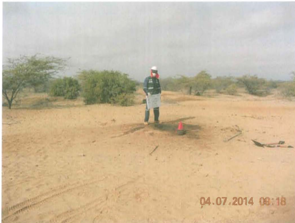
Fotografía N° 1. Vista panorámica de la ubicación del pozo T2548.

"Año de la Promoción de la Industria Responsable y del Compromiso Climático" "Decenio de las Personas con Discapacidad en el Perú"