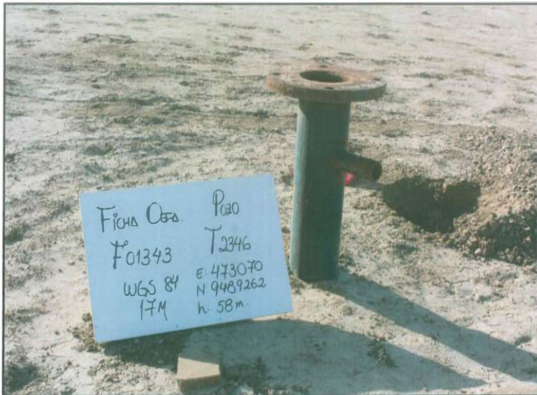
Fotografía N° 1. Pozo T 2346 presenta cabezal de pozo que emerge a una altura de 0,6 m desde la superficie del suelo y cuenta con un tubo de salida lateral de 2,5 plg.

"Año de la Promoción de la Industria Responsable y del Compromiso Climático" "Decenio de las Personas con Discapacidad en el Perú"