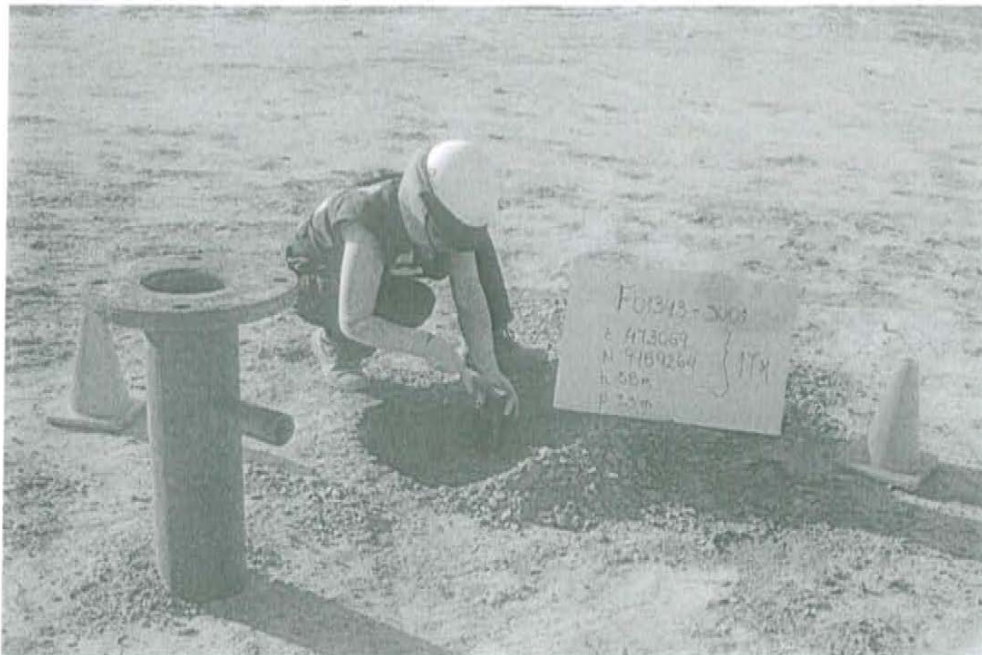
Fotografía N° 1. Toma de muestra en el punto F01343-SU01, ubicado a 0,8 m de distancia del casing del pozo T 2346 a una profundidad de 0,3 m de la superficie del suelo.

"Decenio de las Personas con Discapacidad en el Perú" "Año de la Promoción de la Industria Responsable y del Compromiso Climático"