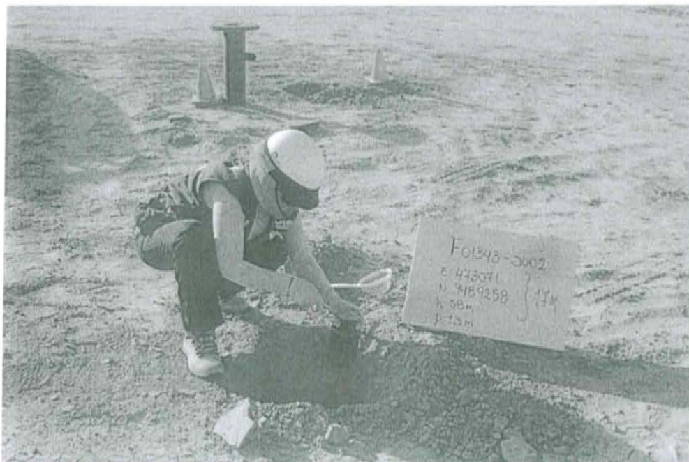
Fotografía N° 2. Toma de muestra en el punto F01343-SU02, ubicado a 4,1 m de distancia del casing del pozo T 2346 a una profundidad de 0,5 m de la superficie del suelo.