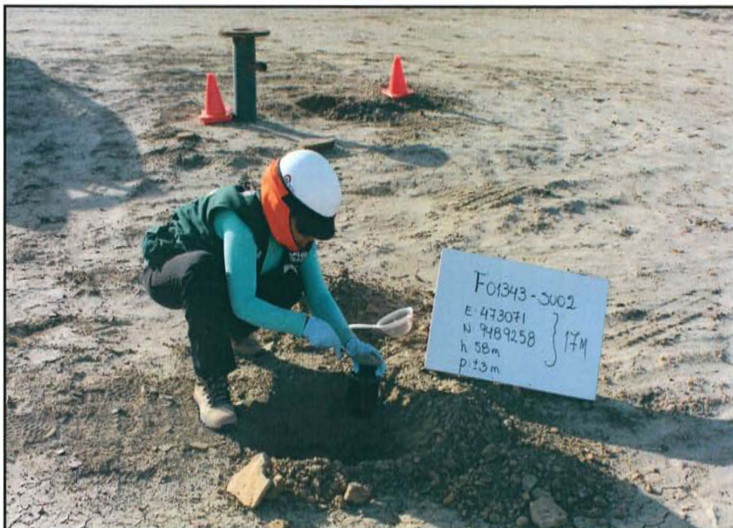
Fotografía N° 4. Toma de muestra en el punto F01343-SU02, ubicado a 4,1 m de distancia del casing del pozo T 2346 a una profundidad de 0,5 m de la superficie del suelo.