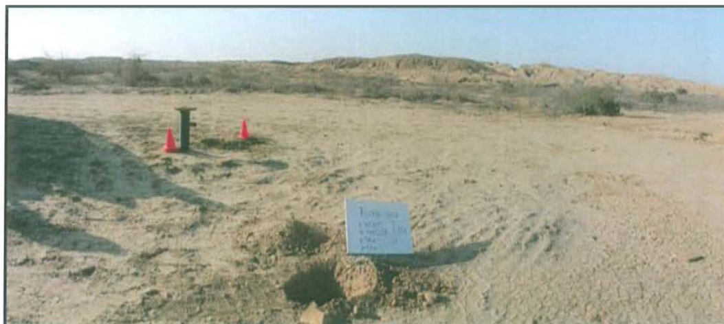
Fotografía N° 2. Vista panorámica del pozo T 2346.