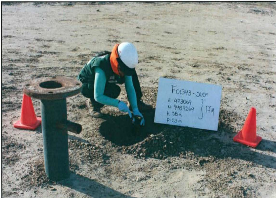
Fotografía N° 3. Toma de muestra en el punto F01343-SU01, ubicado a 0,8 m de distancia del casing del pozo T 2346 a una profundidad de 0,3 m de la superficie del suelo.

"Año de la Promoción de la Industria Responsable y del Compromiso Climático" "Decenio de las Personas con Discapacidad en el Perú"