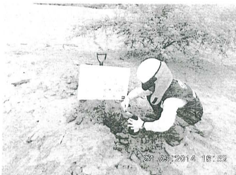
Fotografía N° 2. Toma de muestra de suelo en el punto F00830-SU02, ubicado a 4,2 m aproximadamente del Pozo T3480.