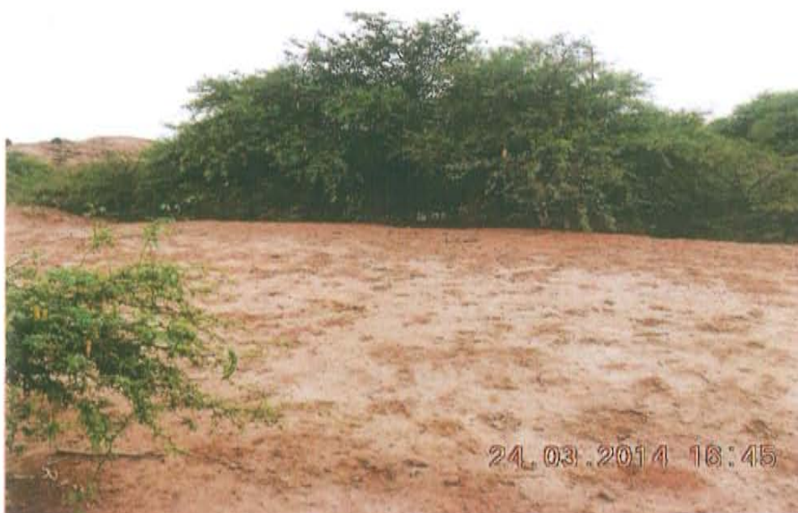
Fotografía N° 3. El área circundante al lugar donde se ubicaría el pozo T3480 presenta suelo impregnado con hidrocarburos y vegetación de tipo arbustiva.

"Año de la Promoción de la Industria Responsable y del Compromiso Climático" "Decenio de las Personas con Discapacidad en el Perú"