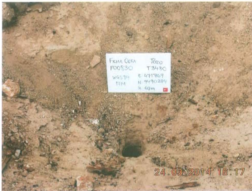
Fotografía N° 1. Pozo no ubicado a nivel superficial, posiblemente esté enterrado el casing dentro de un pequeño hoyo de 0,15 m de diámetro.

"Año de la Promoción de la Industria Responsable y del Compromiso Climático" "Decenio de las Personas con Discapacidad en el Perú"