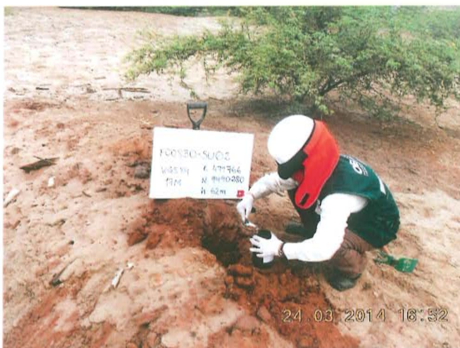
Fotografía N° 4. Toma de muestras de suelo impregnado con hidrocarburos (F00830-SU02), ubicado a 4,2 m de donde se ubicaría el pozo T3480.