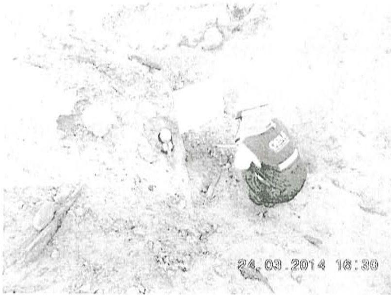
Fotografía N° 1. Toma de muestra de suelo en el punto F00830-SU01, ubicado a 1,9 m aproximadamente del Pozo T3480.

"Decenio de las Personas con Discapacidad en el Perú" "Año de la Promoción de la Industria Responsable y del Compromiso Climático"