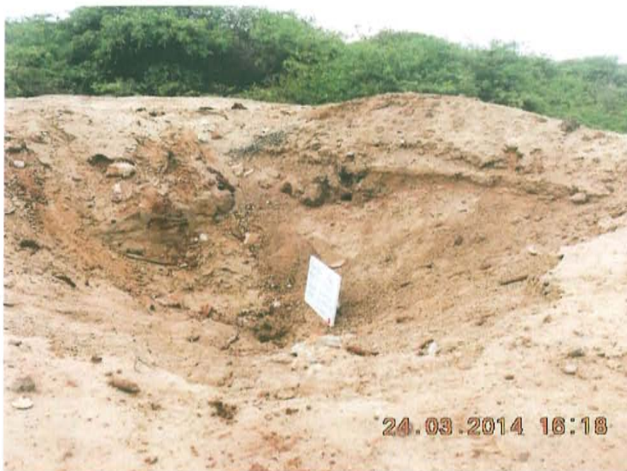
Fotografía N° 2. Vista panorámica donde se ubicaría el pozo T3480, donde se observan residuos y suelo impregnado con hidrocarburos.