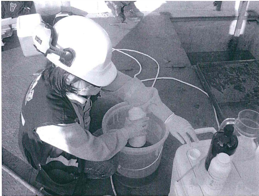
Fotografía N°4. Personal del OEFA efectuando la medición de parámetros en campo.