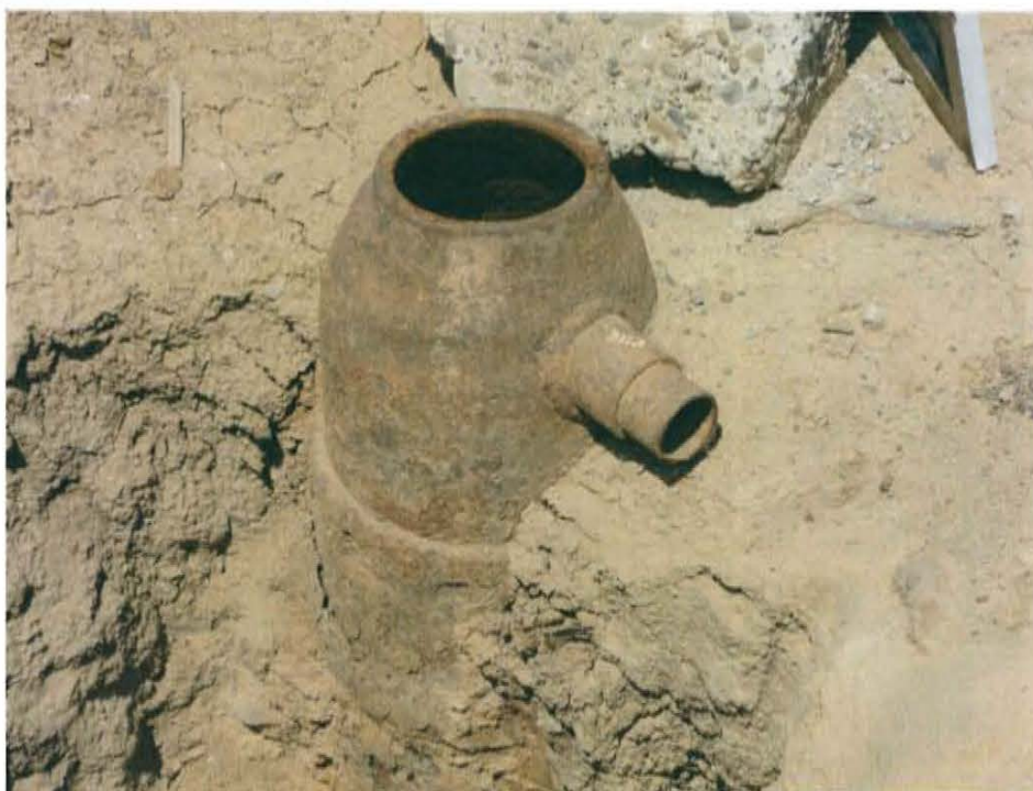
Fotografía N° 3. Casing de 6 pulgadas de diámetro sin cabezal ni válvulas, ubicado a 0,8 m por debajo del nivel del suelo.

"Año de la Promoción de la Industria Responsable y del Compromiso Climático" "Decenio de las Personas con Discapacidad en el Perú"