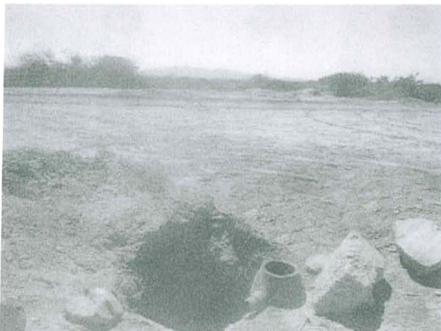
Fotografía N° 2. Mediciones en el F00648-VA01, se realizó en un recorrido en el área circundante alrededor del Pozo en un radio de 1 m, con una duración de 10 minutos.