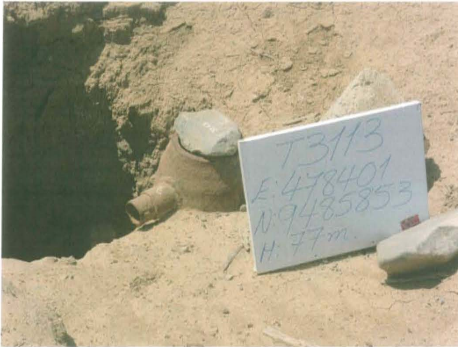
Fotografía N° 1. Pozo inactivo con código PERUPETRO T3113, se observa una roca tapando cabezal.

"Año de la Promoción de la Industria Responsable y del Compromiso Climático" "Decenio de las Personas con Discapacidad en el Perú"