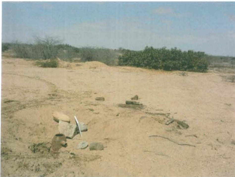
Fotografía N° 2. Vista panorámica de la ubicación del pozo con presencia de vegetación alrededor, el área del terreno presenta algunos residuos de madera.