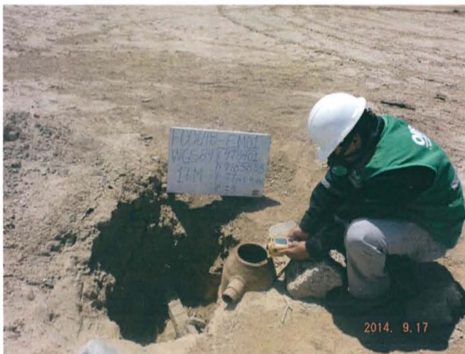
Fotografía N° 4. Medición de emisiones fugitivas en boca de pozo.