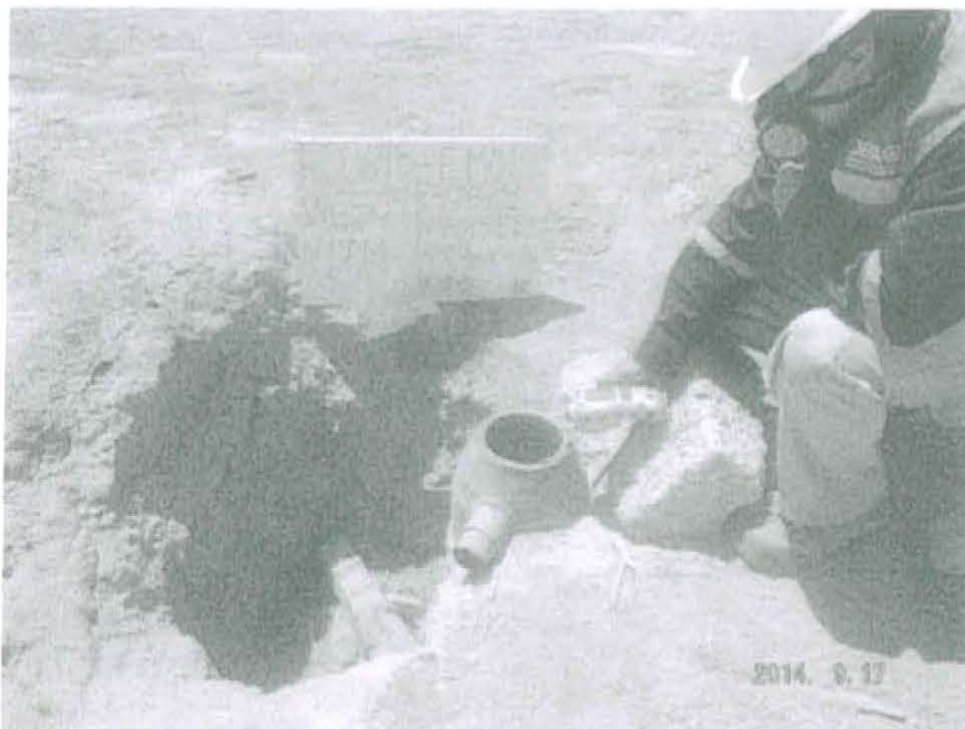
Fotografía N° 1. Medición en el punto F00648-EM01, ubicado en la fuente de emisión en boca del Pozo T3113.

"Año de la Promoción de la Industria Responsable y del Compromiso Climático" "Decenio de las Personas con Discapacidad en el Perú"