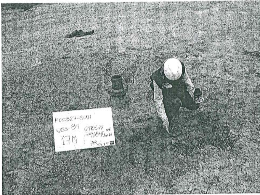
Fotografía N° 1. Toma de muestra de suelo en el punto F00827-SU01, ubicado a 1,5 m aproximadamente del Pozo T4391.

"Decenio de las Personas con Discapacidad en el Perú" "Año de la Promoción de la Industria Responsable y del Compromiso Climático"