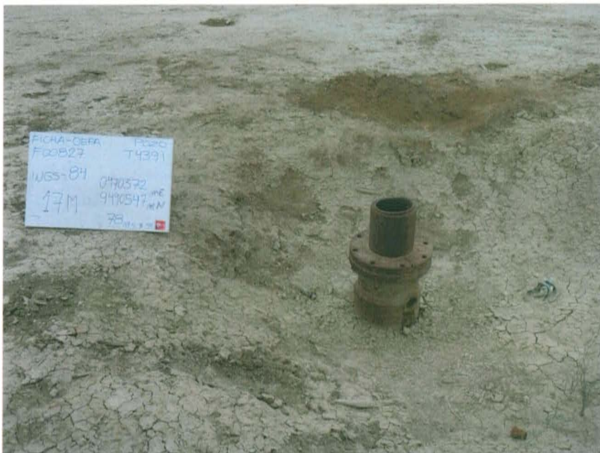
Fotografía N° 1. Pozo inactivo con código PERUPETRO T4391, presenta parte de cabezal con brida y expuesto al ambiente.

"Año de la Promoción de la Industria Responsable y del Compromiso Climático" "Decenio de las Personas con Discapacidad en el Perú"