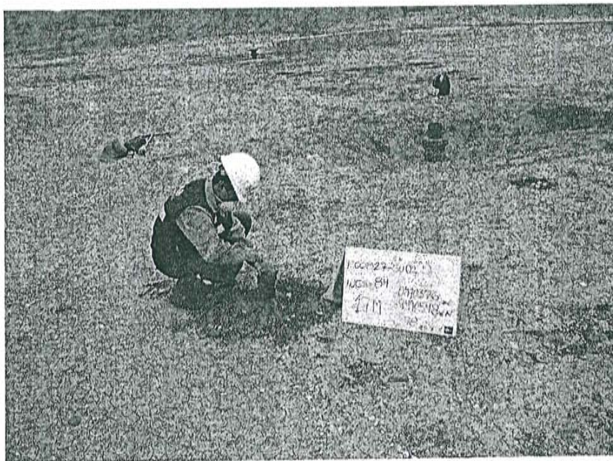
Fotografía N° 2. Toma de muestra de suelo en el punto F00827-SU02, ubicado a 4,8 m aproximadamente del Pozo T4391.