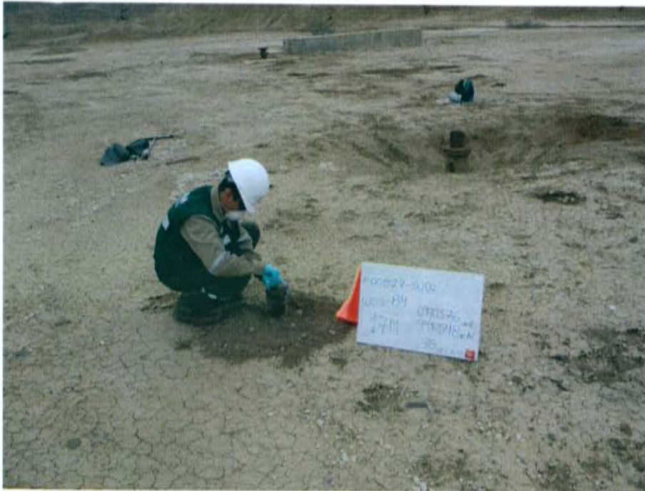
Fotografía N° 3. Recojo de muestra de suelo en zonas con posible presencia de residuos de hidrocarburo.

"Año de la Promoción de la Industria Responsable y del Compromiso Climático" "Decenio de las Personas con Discapacidad en el Perú"