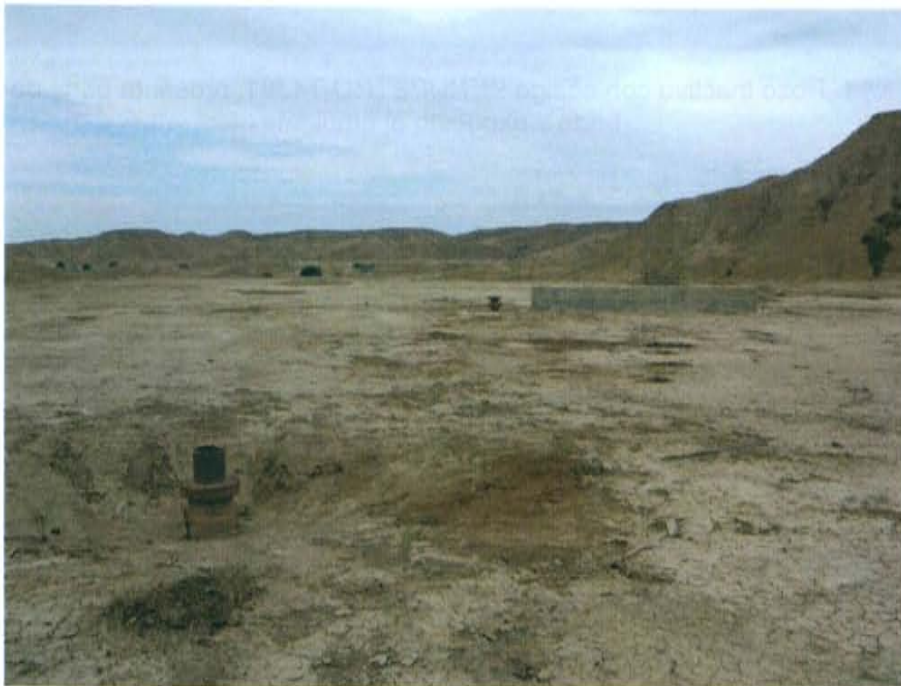
Fotografía N° 4. Vista en las zonas circundantes al pozo, se puede observar El pozo T4248.