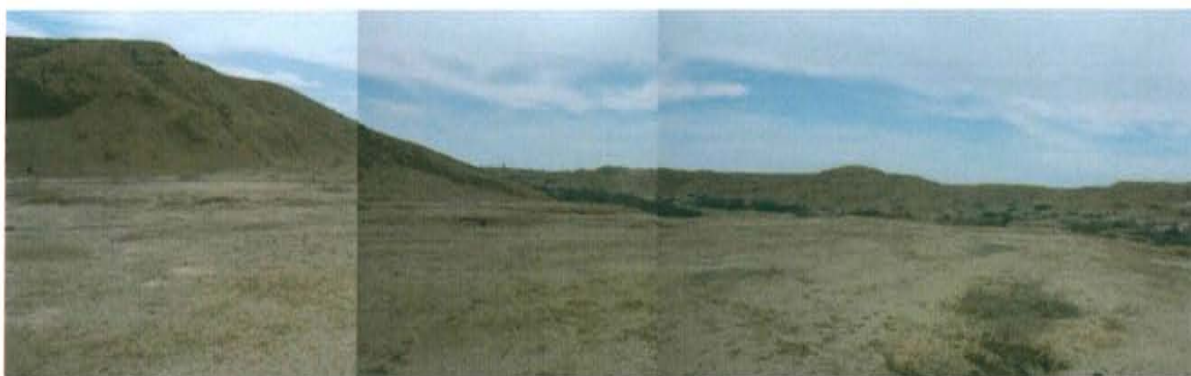
Fotografía N° 2. Vista panorámica del área circundante al pozo, presencia de pequeñas lomas, y de escasa vegetación en terreno seco.