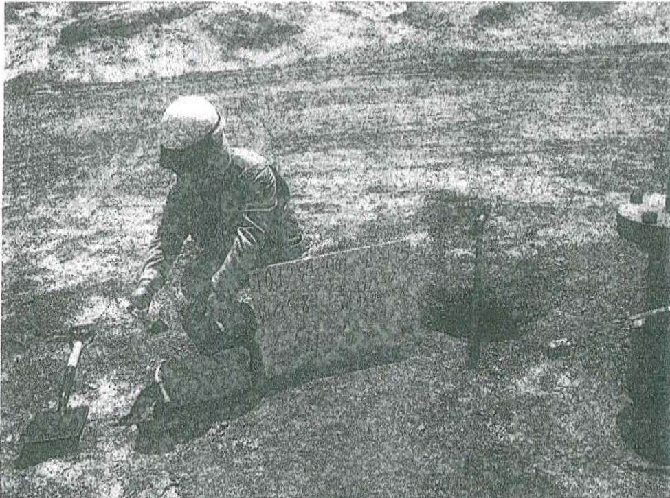
Fotografía N° 1. Toma de muestra de suelo en el punto F01290-SU01 ubicado a 0.6 m del Pozo L_475

"Decenio de las Personas con Discapacidad en el Perú" "Año de la Promoción de la Industria Responsable y del Compromiso Climático"