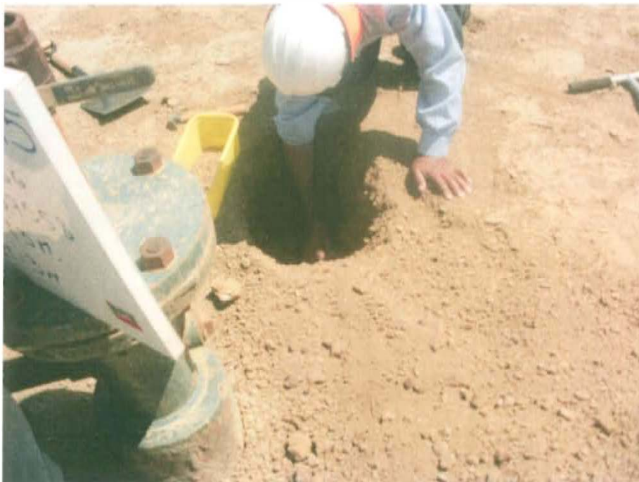
Fotografía N° 4. superficialmente no se observa suelos con hidrocarburos, pero al aperturar hoyos se percibe cambio de coloracion y ligero olor a hidrocarburos.