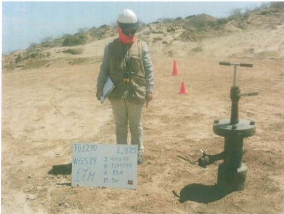
Fotografía N° 1. Pozo expuesto al ambiente, cuenta con cabezal formado por una brida y tubería de reducción cerrada, que sobresale 1 m sobre la base del terraplén.

"Año de la Promoción de la Industria Responsable y del Compromiso Climático" "Decenio de las Personas con Discapacidad en el Perú"