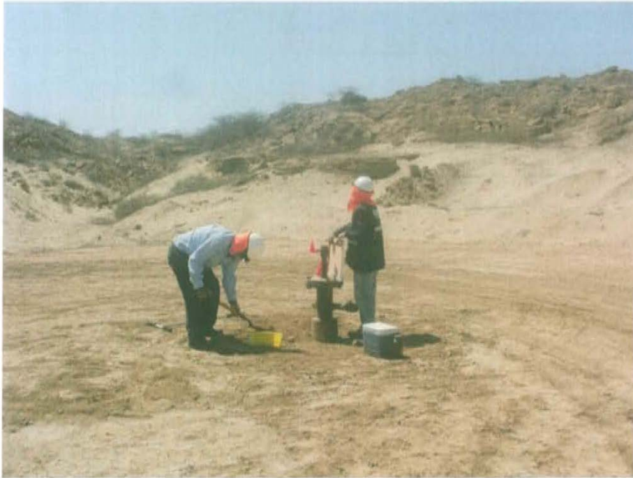
Fotografía N° 3. EL pozo se ubica en una zona de colinas bajas moderadamente disectadas con vegetación predominante de algarrobos, ubicados fuera del terraplen no se observa cursos de agua activos

"Año de la Promoción de la Industria Responsable y del Compromiso Climático" "Decenio de las Personas con Discapacidad en el Perú"