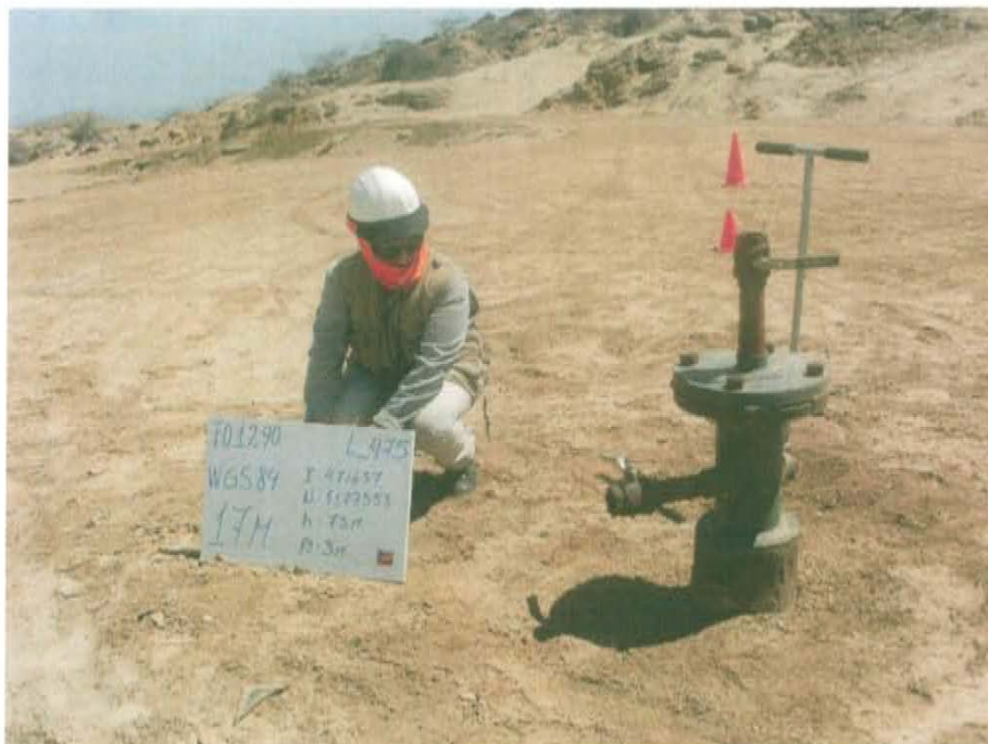
Fotografía N° 2. Terraplén con ligera pendiente del 8-12%, recientemente habilitado y con vía de acceso directo al pozo.