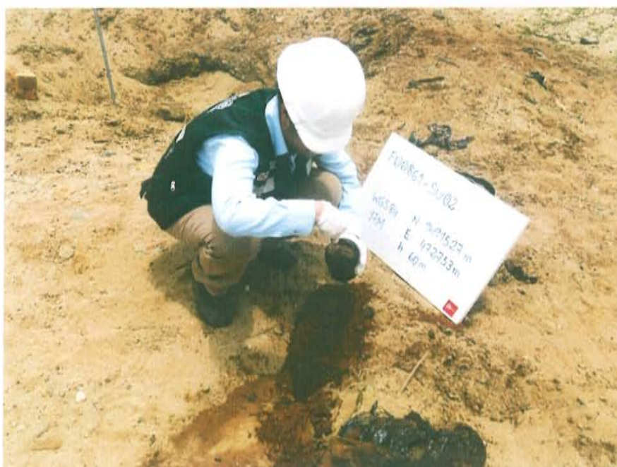
Fotografía N° 4. Punto (F00861-SU02) donde se recolectó la muestra de suelo, ubicado a 3,5-m de donde probablemente se encuentre el pozo T4727.