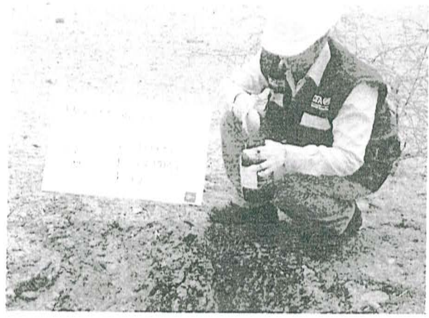
Fotografía N° 1. Toma de muestra de suelo en el punto F00861-SU01, ubicado a 1,5 m aproximadamente del Pozo T4727.

"Decenio de las Personas con Discapacidad en el Perú" "Año de la Promoción de la Industria Responsable y del Compromiso Climático"