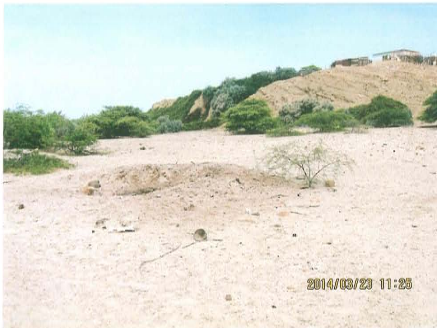
Fotografía N° 2. Vista panorámica del área donde se presume se encuentre ubicado el pozo T4727, en un zona con suelo arenoso, vegetación arbórea predominante de algarrobo y existen viviendas cercanas.