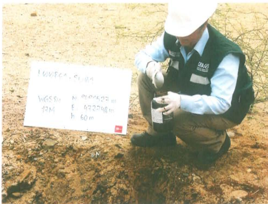
Fotografía N° 3. Punto (F00861-SU01) donde se recolectó la muestra de suelo, ubicado a 1,5-m de donde probablemente se encuentre el pozo T4727.

"Año de la Promoción de la Industria Responsable y del Compromiso Climático" "Decenio de las Personas con Discapacidad en el Perú"