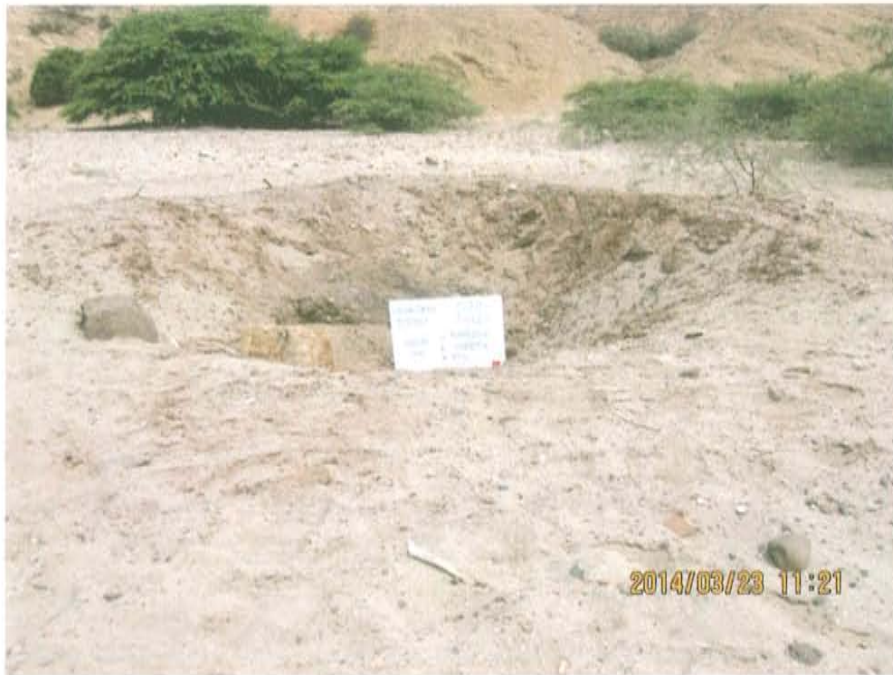
Fotografía N° 1. Se observa un hoyo de 0,15 m de diámetro en cuyo interior se presume se encuentre enterrado el casing del pozo T4727, se observan residuos y suelo impregnados con hidrocarburos.

"Año de la Promoción de la Industria Responsable y del Compromiso Climático" "Decenio de las Personas con Discapacidad en el Perú"