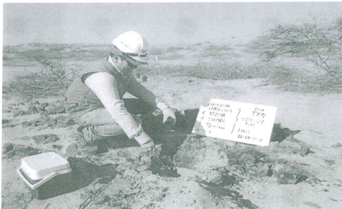
Fotografía N° 2. Toma de muestra de suelo en el punto F01946-SU02, ubicado a 8 m aproximadamente del Pozo.