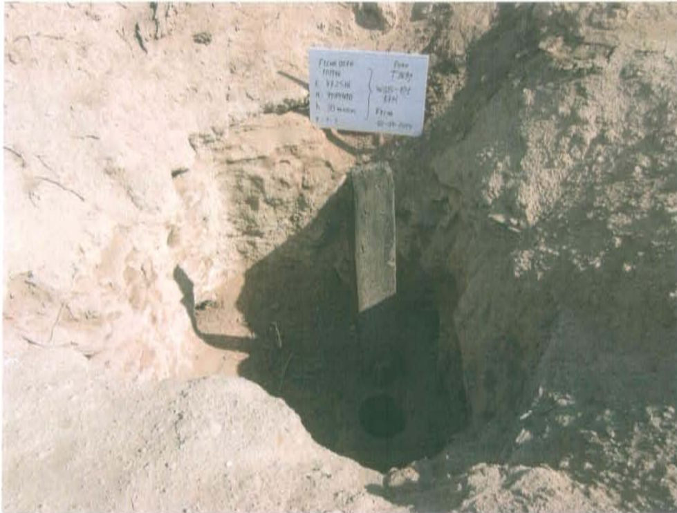
Fotografía N° 1. Se observa el Pozo T1691 con casing de 10 pulgadas aproximadamente, se encuentra al ras del suelo sin cabezal ni válvulas que aseguren su hermetismo.

"Año de la Promoción de la Industria Responsable y del Compromiso Climático" "Decenio de las Personas con Discapacidad en el Perú"