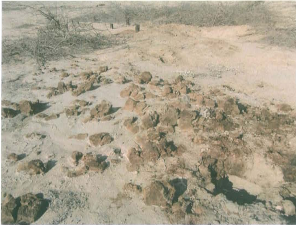
Fotografía N° 3. Se observa adyacente al Pozo T1691, terrones de tierra compactos impregnados con hidrocarburos.

"Año de la Promoción de la Industria Responsable y del Compromiso Climático" "Decenio de las Personas con Discapacidad en el Perú"