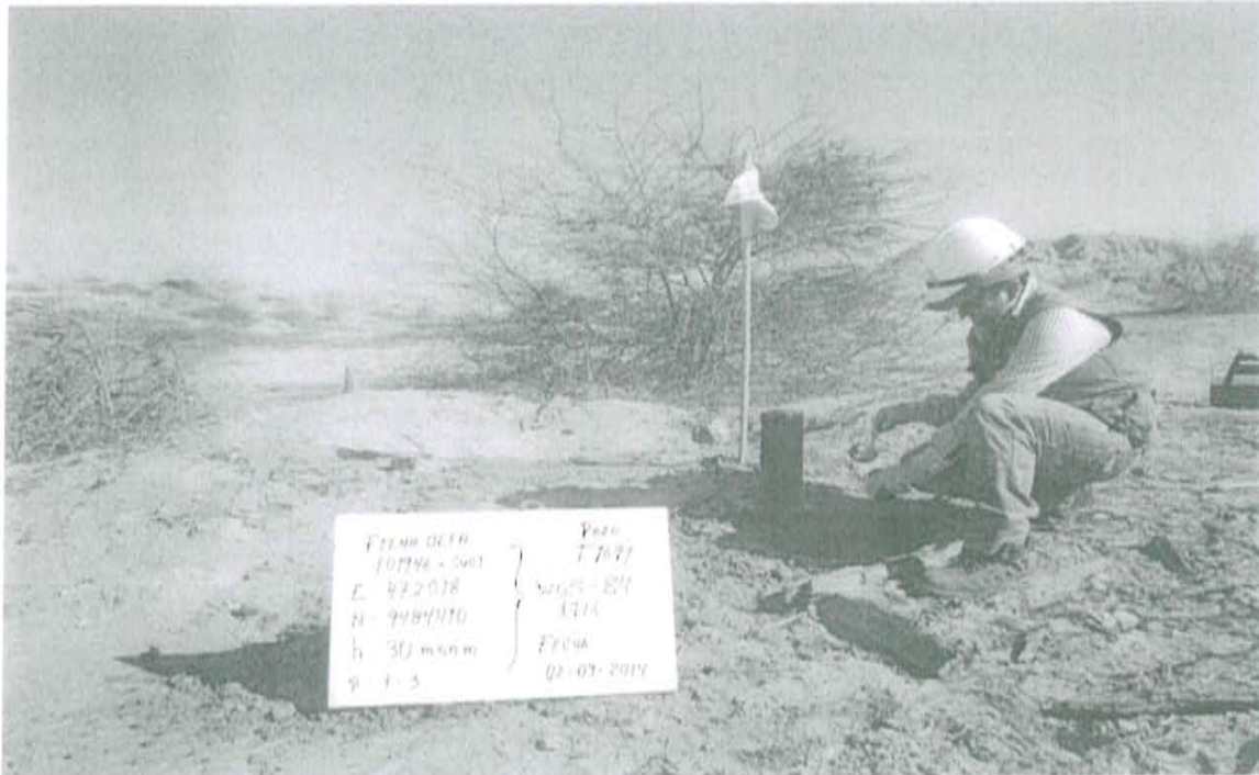
Fotografía N° 1. Toma de muestra de suelo en el punto F01946-SU01, ubicado a 2,5 m aproximadamente del Pozo.

"Decenio de las Personas con Discapacidad en el Perú" "Año de la Promoción de la Industria Responsable y del Compromiso Climático"