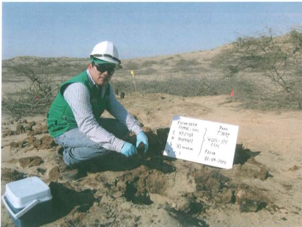
Fotografía N° 4. Toma de muestra de suelo en el punto F01946 -SU02, ubicado a 8 m en dirección norte del Pozo T1691.