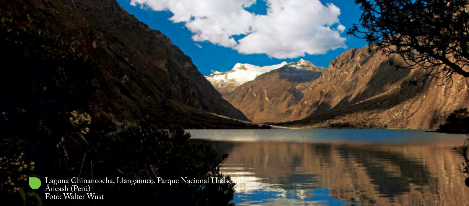
Laguna Chinancocha, Llanganuco. Parque Nacional Huáscarán. Áncash (Perú)

En este escenario, la labor de fiscalización que realizan las autoridades ambientales competentes —y que integran la Red— cobra vital importancia. Esto se debe a que una fiscalización permanente a las empresas o particulares que desarrollen actividades económicas, promueve, a su vez, un cabal cumplimiento de la normativa en materia ambiental y de las obligaciones ambientales a cargo de estos últimos.