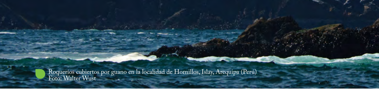
Roqueríos cubiertos por guano en la localidad de Hornillos, Islay, Arequipa (Perú)

“en lo relacionado con la protección del ambiente, se encuentran la Declaración de Naciones Unidas sobre medio ambiente humano (1972)”