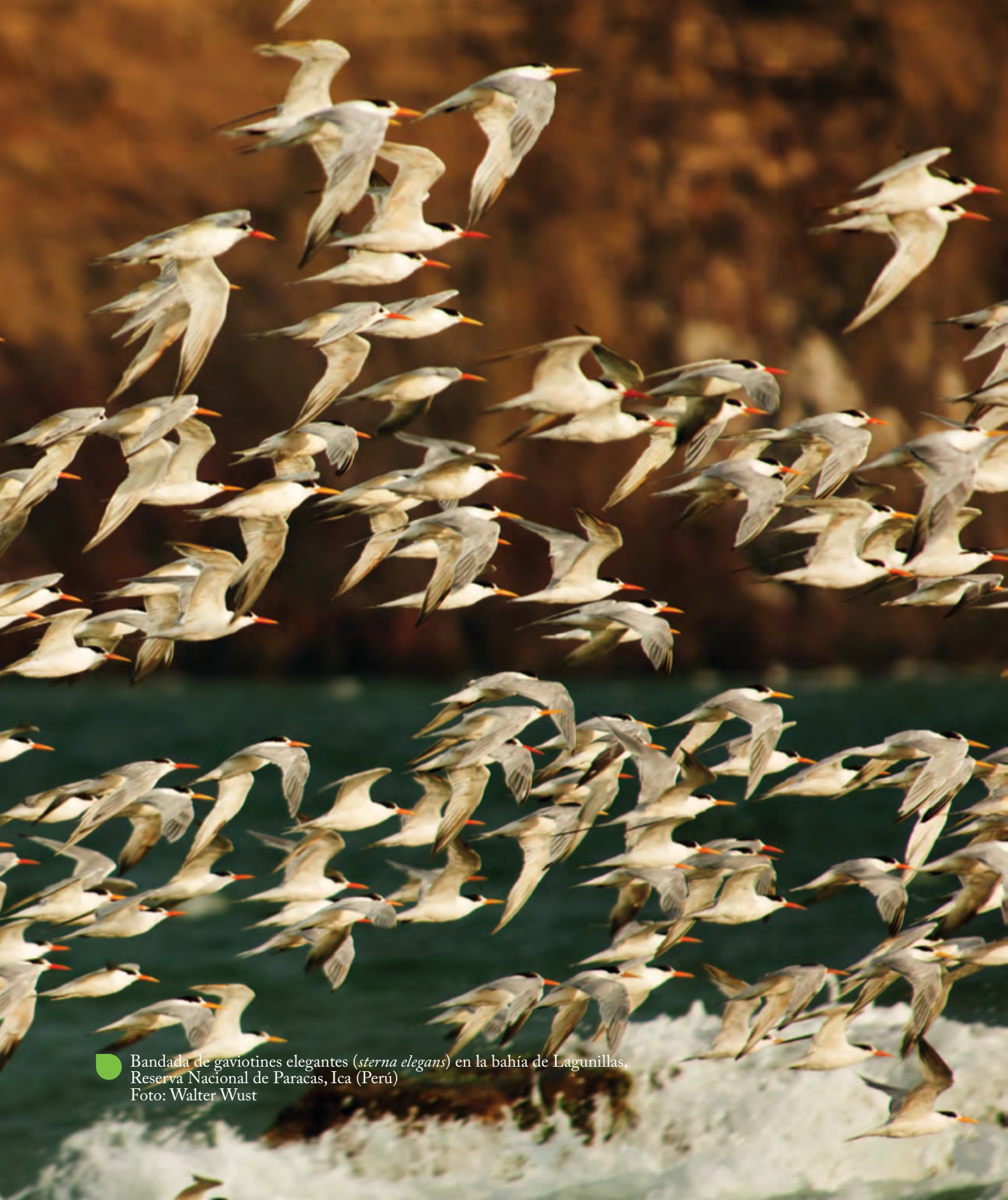
Bandada de gaviotines elegantes ( sterna elegans ) en la bahía de Lagunillas, Reserva Nacional de Paracas, Ica (Perú)