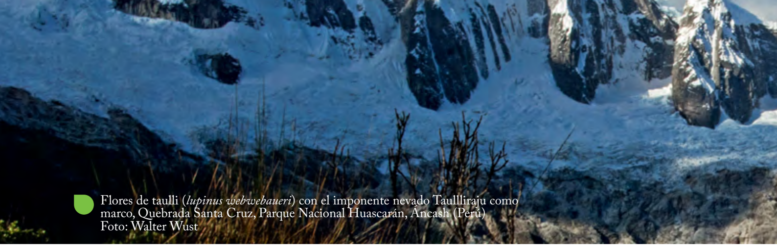
Flores de taulli ( lupinus webwebaueri ) con el imponente nevado Taulliraju como marco, Quebrada Santa Cruz, Parque Nacional Huascarán, Áncash (Perú)

equilibrada y respetuosa de los ámbitos de competencia que maneja cada nivel de gobierno (...) 39 (la cursiva es nuestra).