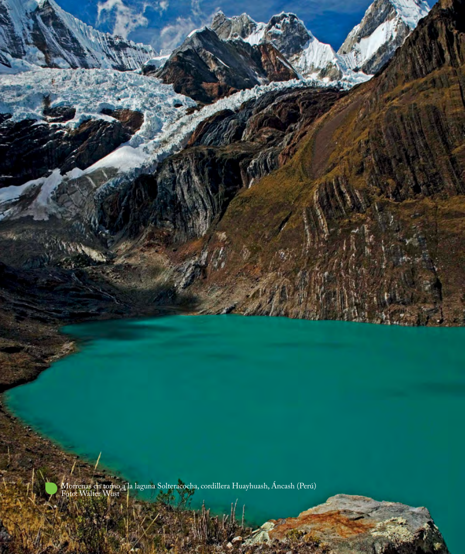
Morrenas en torno a la laguna Solteracocha, cordillera Huayhuash, Áncash (Perú)