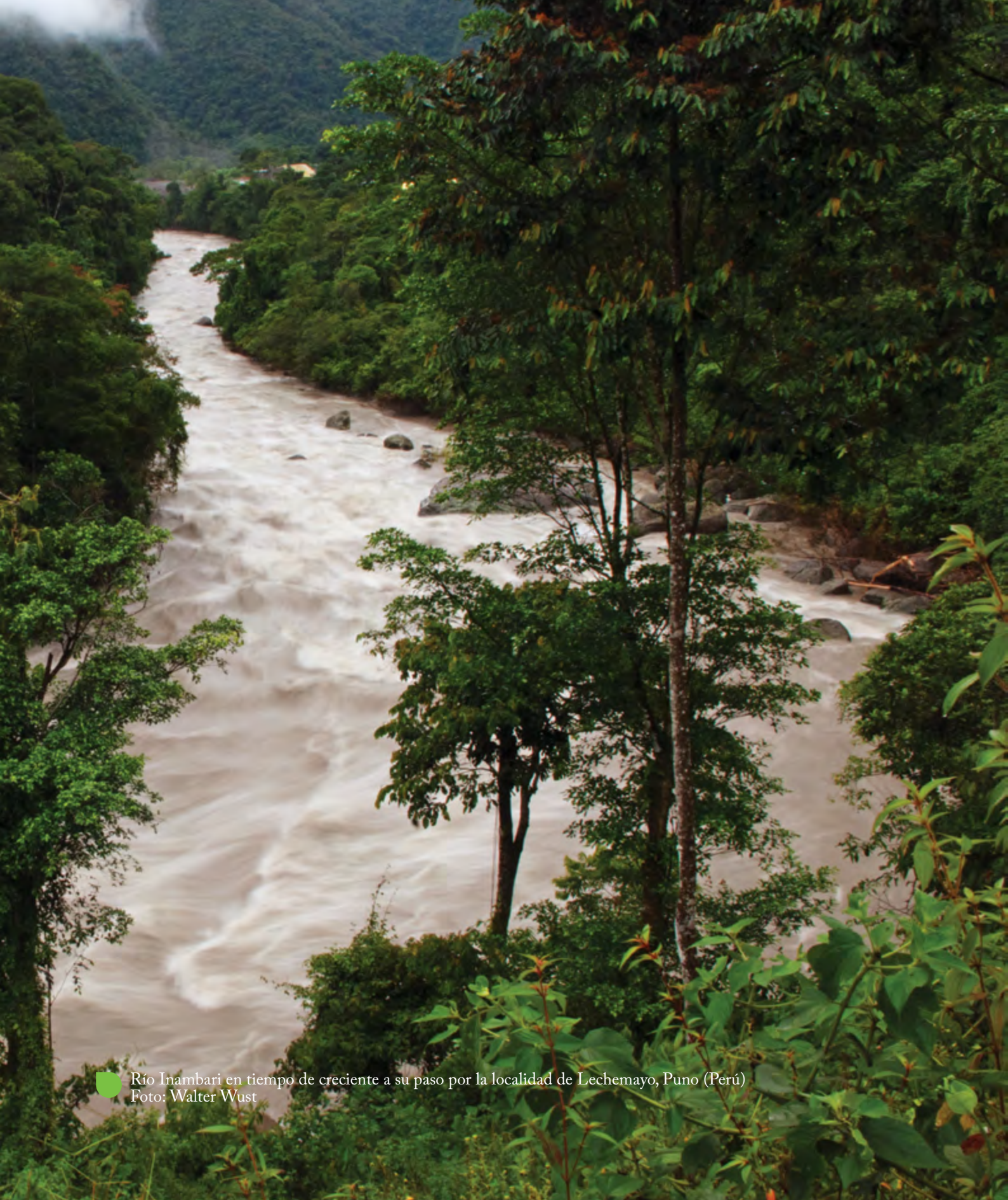
Río Inambari en tiempo de creciente a su paso por la localidad de Lechemayo, Puno (Perú)