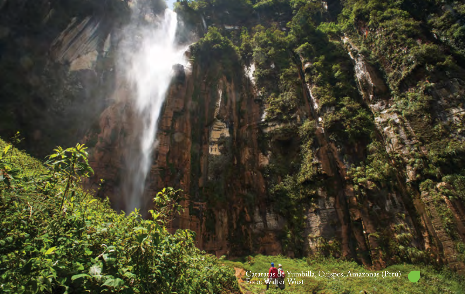
Cataratas de Yumbilla, Cuispes, Amazonas (Perú)

(...) su dimensión negativa se traduce en la obligación del Estado de abstenerse de realizar cualquier tipo de actos [sic] que afecten al medio ambiente equilibrado y adecuado para el desarrollo de la vida y la salud humana. En su dimensión positiva le impone deberes y obligaciones destinadas a conservar el ambiente equilibrado, las cuales se traducen, a su vez, en un haz de posibilidades. Claro está que no solo supone tareas de conservación, sino también de prevención que se afecte [sic] a ese ambiente equilibrado 24 .