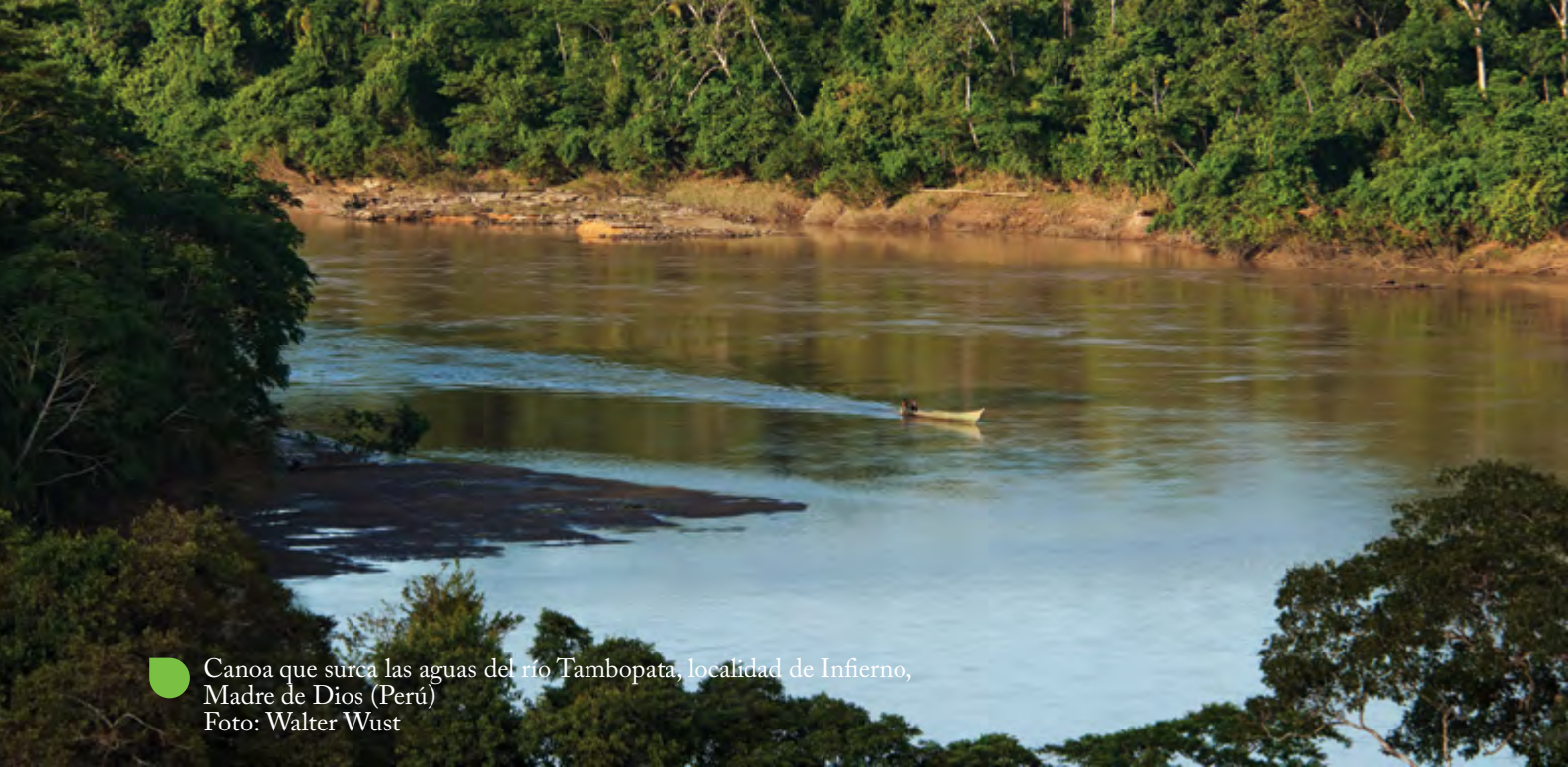
● Canoa que surca las aguas del río Tambopata, localidad de Infierno, Madre de Dios (Perú)

incluso el internacional—, va más allá de cualquier limitación territorial de orden municipal o departamental (...) 48 (La cursiva es nuestra).