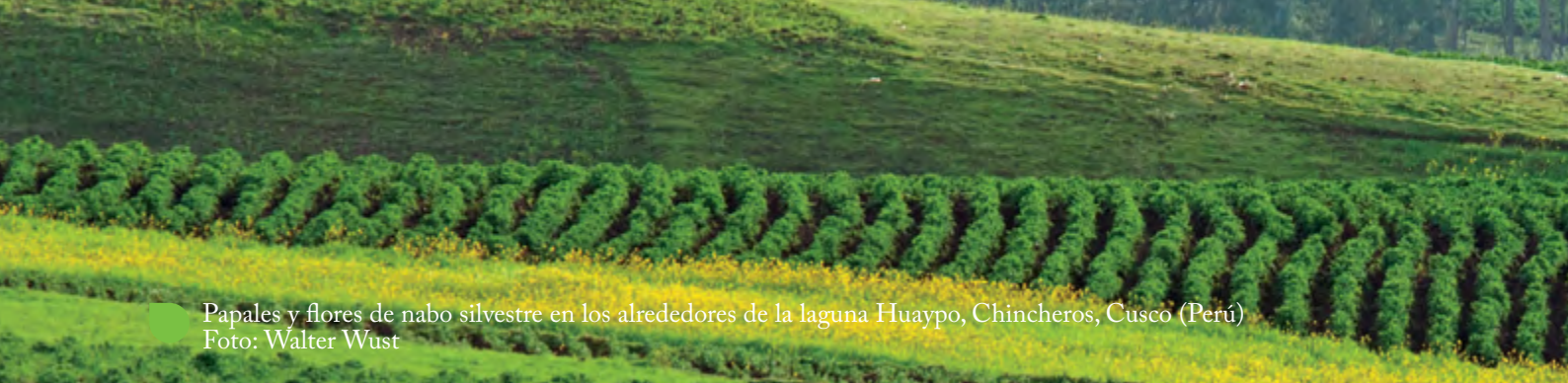
Papales y flores de nabo silvestre en los alrededores de la laguna Huaypo, Chincheros, Cusco (Perú)

lo pudieran afectar, para garantizar, de este modo, el desarrollo integral de todas las generaciones presentes, y asegurar la conservación del ambiente para las generaciones futuras. En esta línea, la Política Nacional del Ambiente 27 tiene como objetivo: