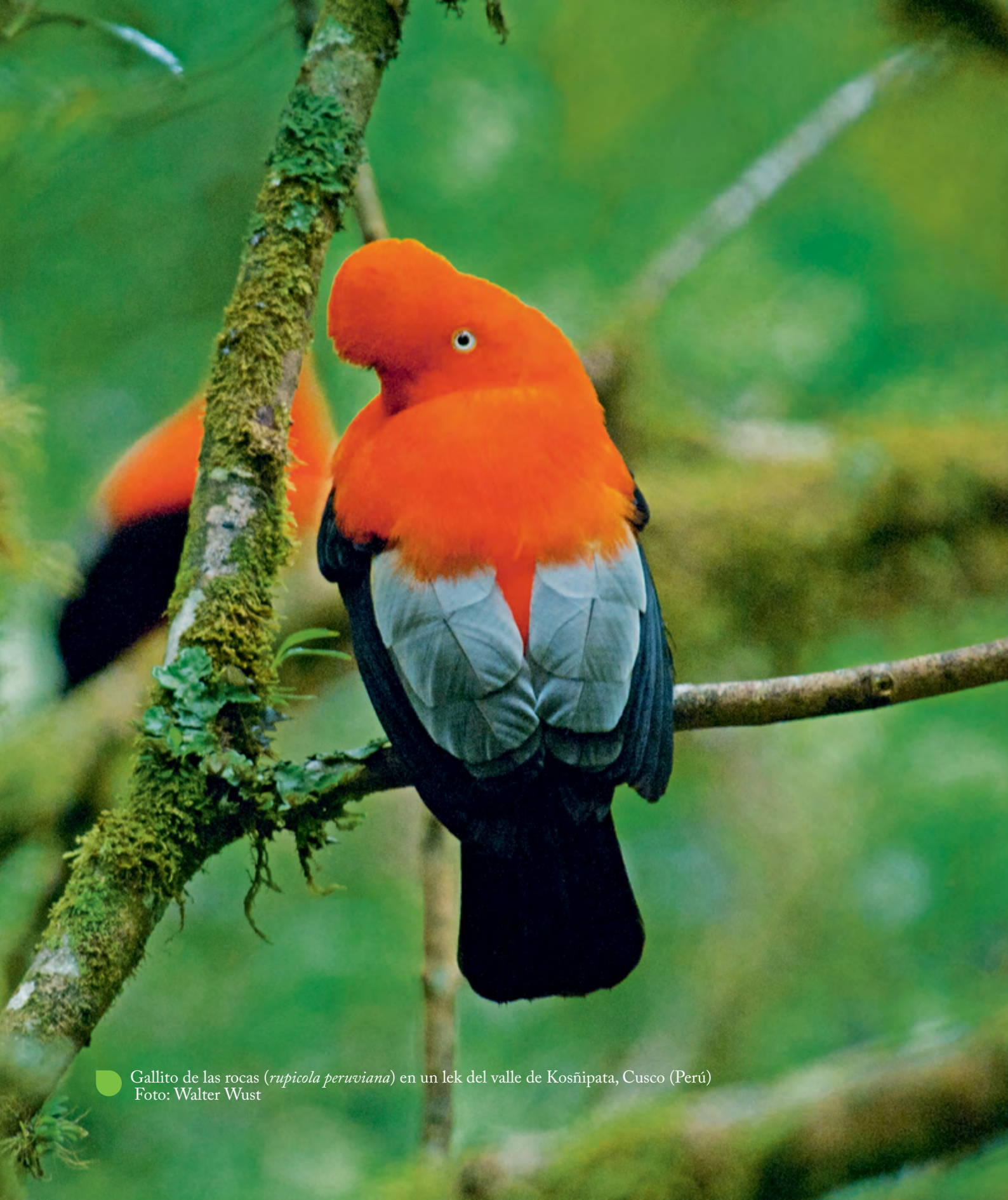
Gallito de las rocas ( rupicola peruviana ) en un lek del valle de Kosñipata, Cusco (Perú)