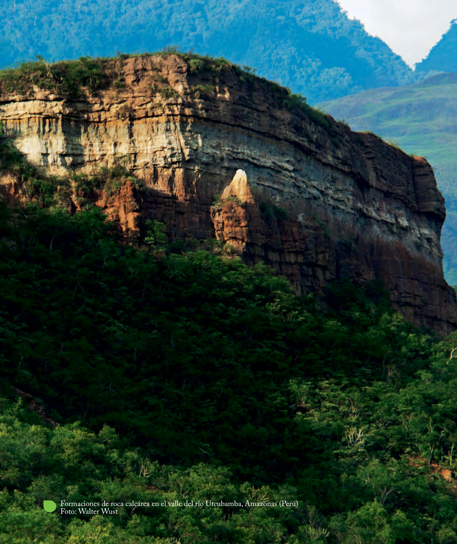
Formaciones de roca calcárea en el valle del río Utcubamba, Amazonas (Perú)