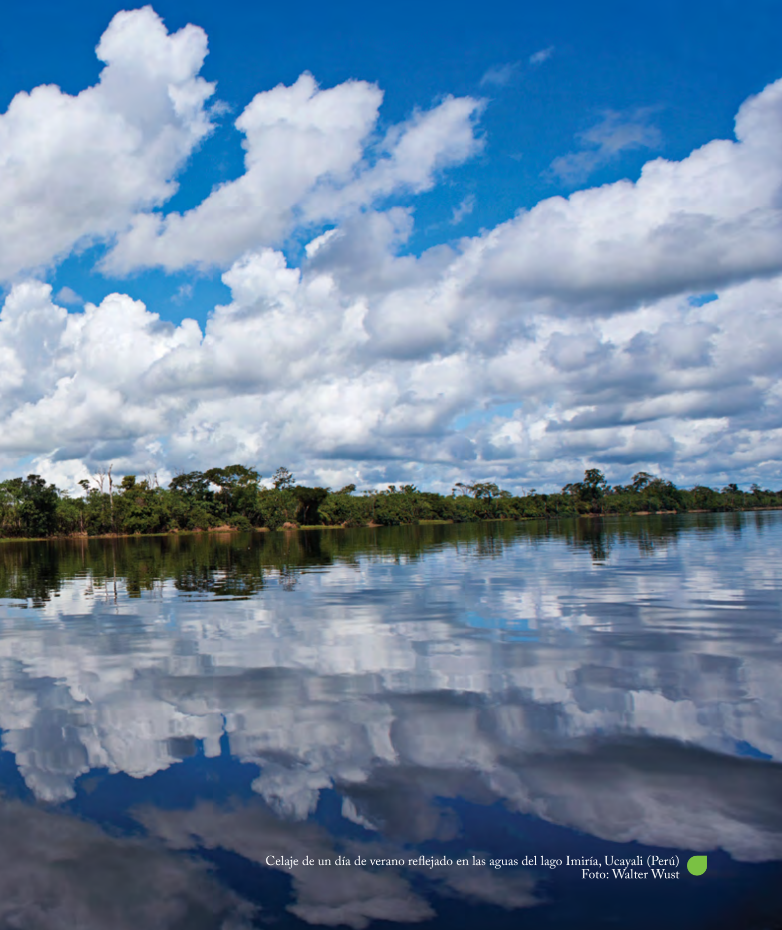
Celaje de un día de verano reflejado en las aguas del lago Imiría, Ucayali (Perú)