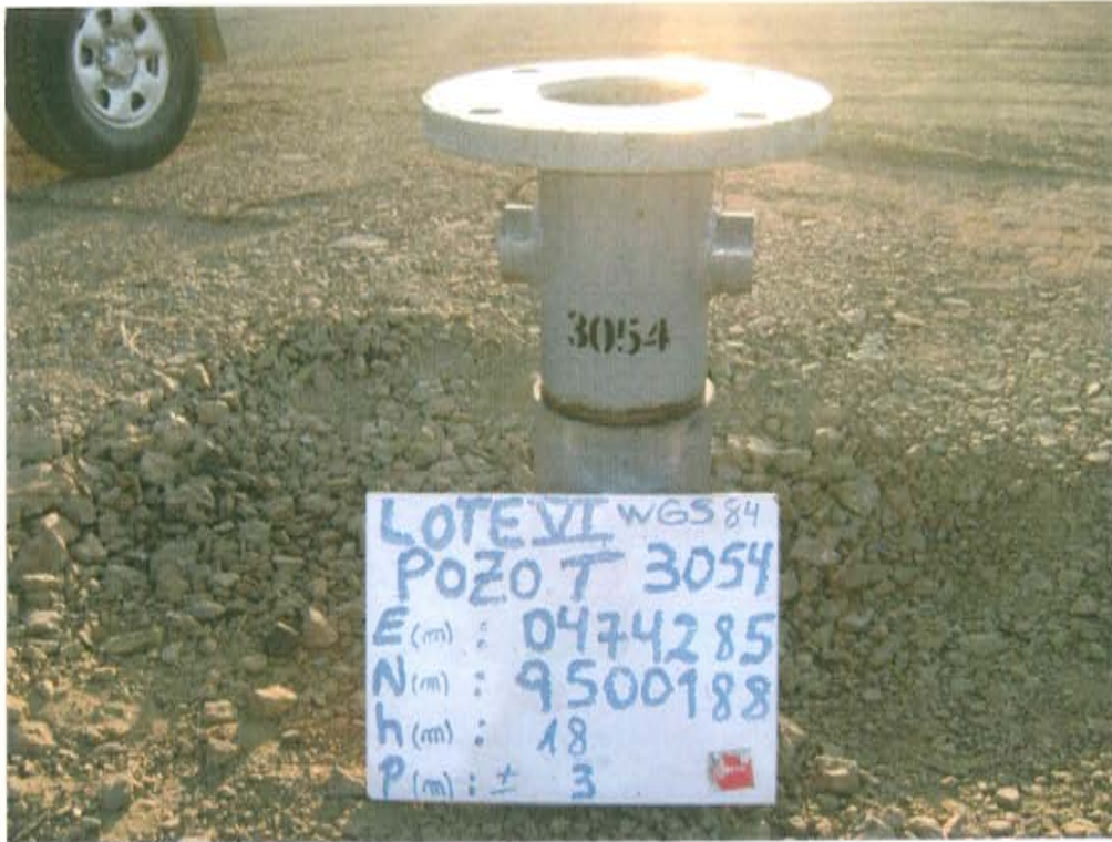
Fotografía N° 1. Identificación del pozo inactivo con código PERUPETRO T3054. Presenta casing sin válvulas que aseguren su hermetismo.

"Año de la Promoción de la Industria Responsable y del Compromiso Climático" "Decenio de las Personas con Discapacidad en el Perú"