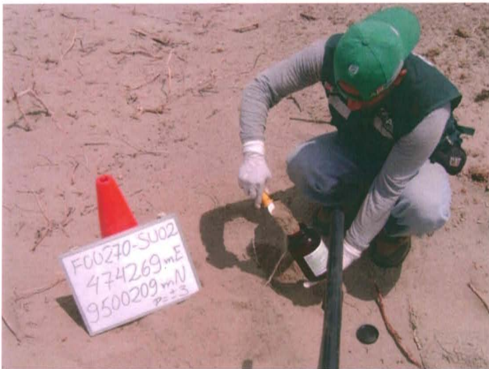
Fotografía N° 4. Toma de muestra de suelo en el punto F00270-SU02 en sustrato con hidrocarburo alrededor del pozo, ubicado a 26 m aproximadamente del Pozo T3054