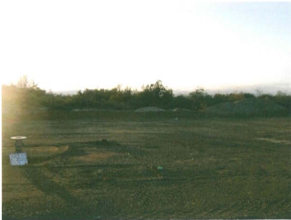
Fotografía N° 2. Vista panorámica del área circundante del pozo inactivo T3054, cercano a zona de pastoreo.