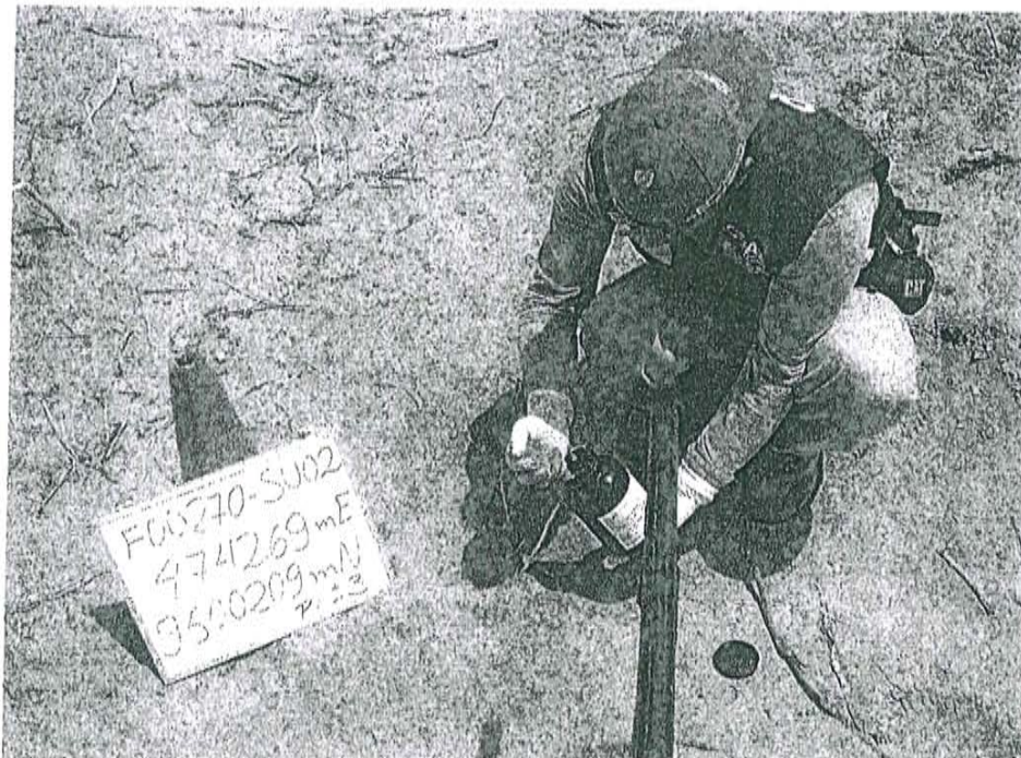
Fotografía N° 2. Toma de muestra de suelo en el punto F00270-SU02, ubicado a 26 m aproximadamente del pozo T3054.