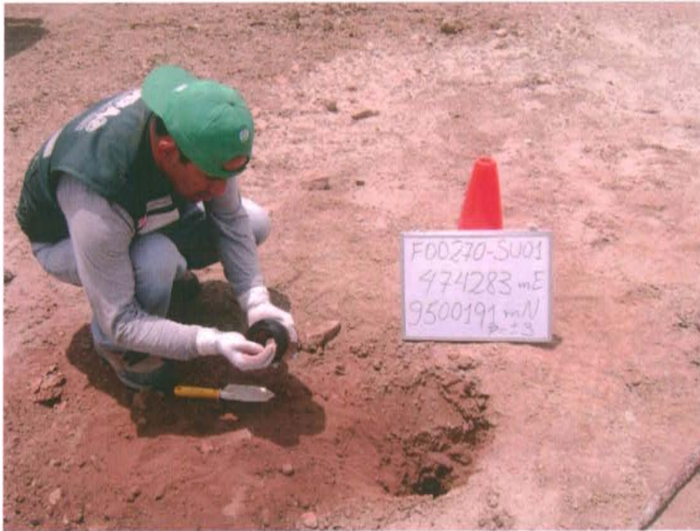
Fotografía N° 3. Toma de muestra de suelo en el punto F00270-SU01 en sustrato con hidrocarburo alrededor del pozo, ubicado a 3,6 m aproximadamente del Pozo T3054.

"Año de la Promoción de la Industria Responsable y del Compromiso Climático" "Decenio de las Personas con Discapacidad en el Perú"