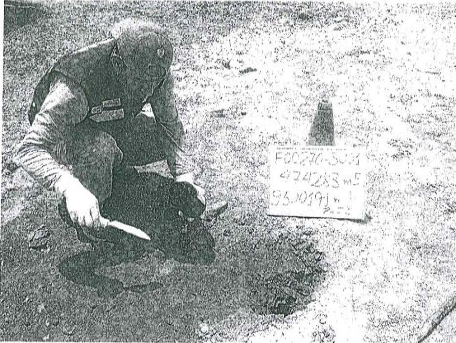
Fotografía N° 1. Toma de muestra de suelo en el punto F00270-SU01, ubicado a 3.6 m aproximadamente del pozo T3054.

"Decenio de las Personas con Discapacidad en el Perú" "Año de la Promoción de la Industria Responsable y del Compromiso Climático"