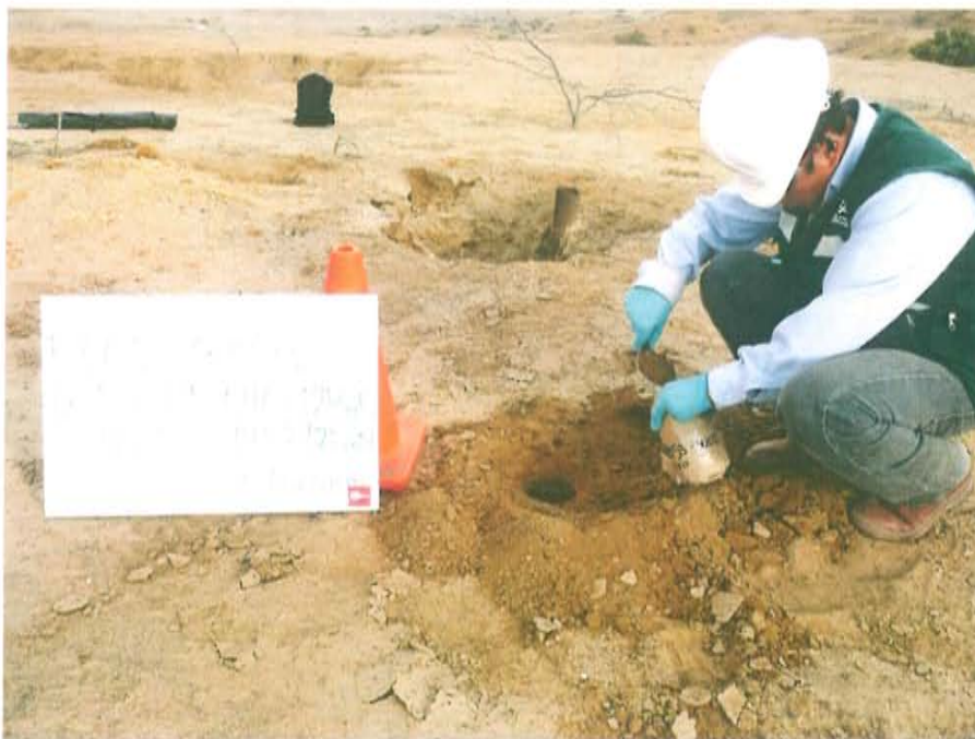
Fotografía N° 4. Punto (F00853-SU02) donde se recolectó la muestra de suelo, ubicado a 2,4-m del pozo T4833.