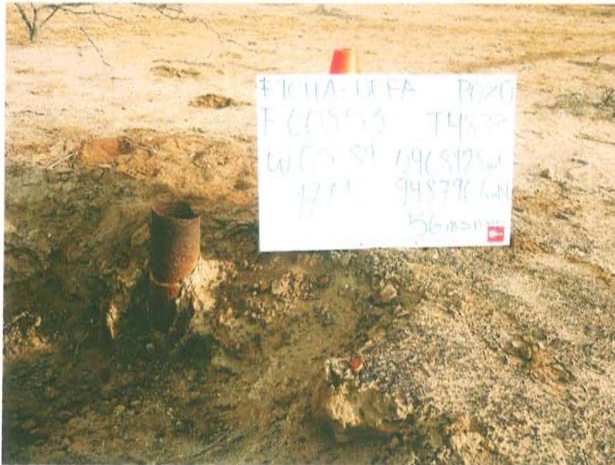
Fotografía N° 2. Se observa una tubería corroída ubicada a 0,38 m de profundidad desde el nivel del suelo