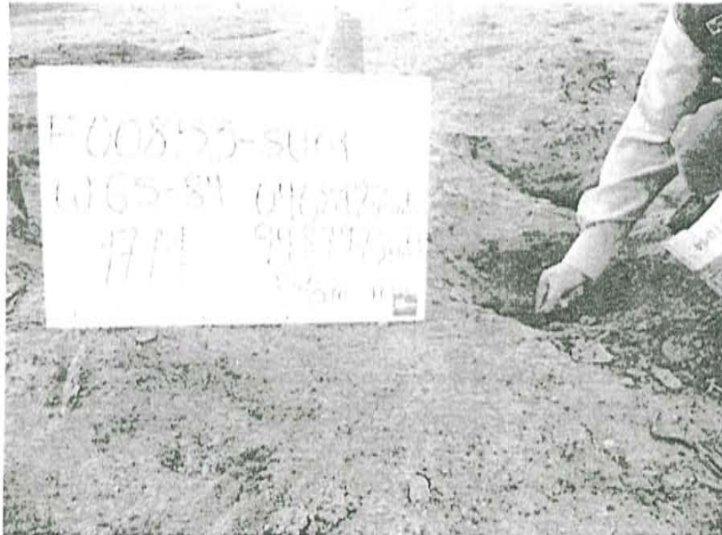
Fotografía N° 1. Toma de muestra de suelo en el punto F00853-SU01, ubicado a 1,4 m aproximadamente del Pozo T4833.

"Decenio de las Personas con Discapacidad en el Perú" "Año de la Promoción de la Industria Responsable y del Compromiso Climático"