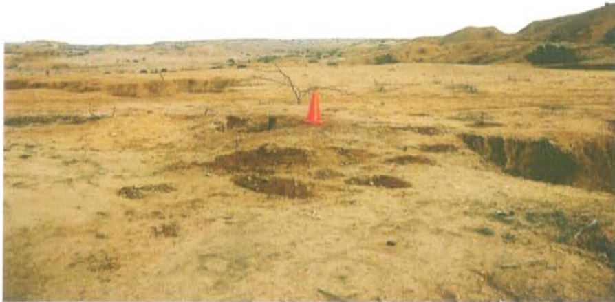
Fotografía N° 3. Foto panorámica en donde se ubica el pozo T4833, ubicado en un área desértica con presencia de suelo impregnado con hidrocarburos y escasa vegetación circundante al pozo.

"Año de la Promoción de la Industria Responsable y del Compromiso Climático" "Decenio de las Personas con Discapacidad en el Perú"