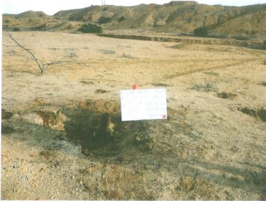
Fotografía N° 1. Vista panorámica donde se ubica el pozo T4833, con casing de 4 plg en una planicie aluvial con escasa vegetación.

"Año de la Promoción de la Industria Responsable y del Compromiso Climático" "Decenio de las Personas con Discapacidad en el Perú"