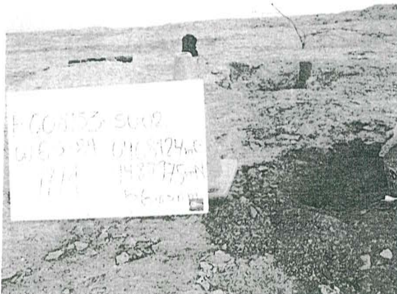
Fotografía N° 2. Punto de muestreo de suelo F00853-SU02, ubicado a 2,4 m aproximadamente del Pozo T4833.