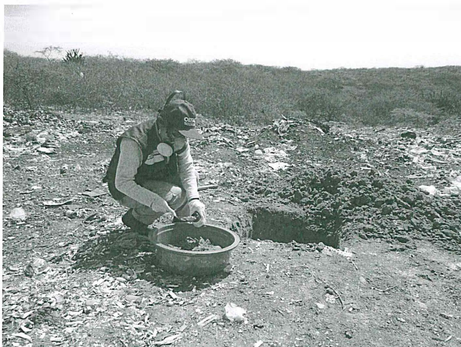
Fotografía 8. Colecta de muestra de suelo para análisis de orgánicos. Punto de muestreo SU – E7, calicata de 80 cm x 80 cm con 60 cm de profundidad. Botadero de la Municipalidad de la ciudad de Tumbes, 15-05-2014

"Decenio de las Personas con Discapacidad en el Perú" "Año de la Promoción de la Industria Responsable y del Compromiso Climático"