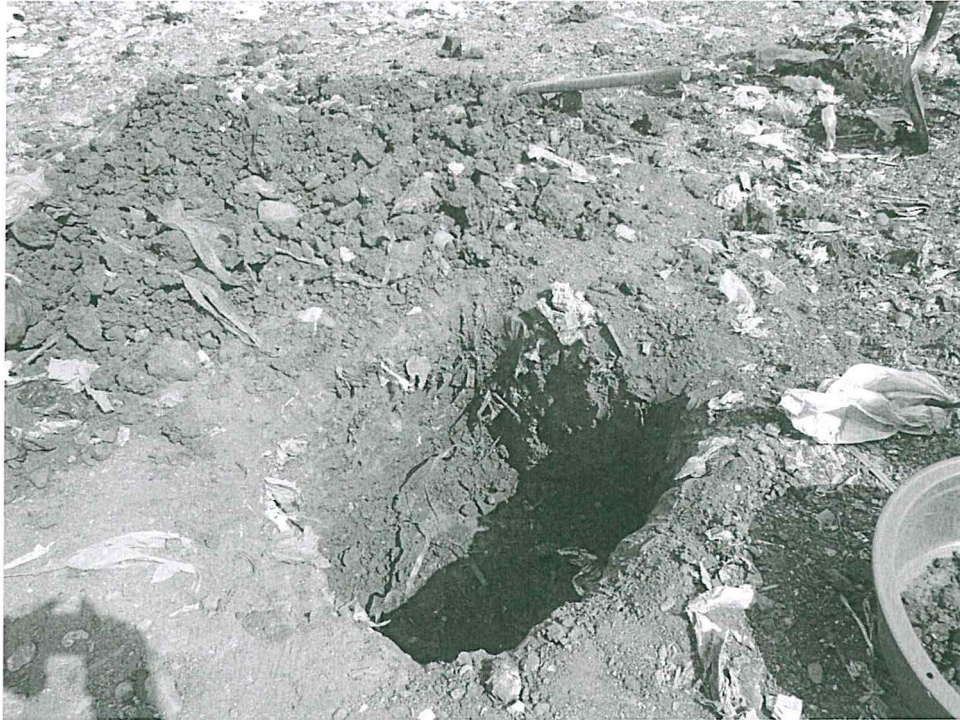
Fotografía 3. Punto de muestreo SU – 2, suelo de relleno con presencia de residuos sólidos, calicata de 80 cm x 80 cm con 65 cm de profundidad. Botadero de la Municipalidad de la ciudad de Tumbes, 13-05-2014.

"Decenio de las Personas con Discapacidad en el Perú" "Año de la Promoción de la Industria Responsable y del Compromiso Climático"