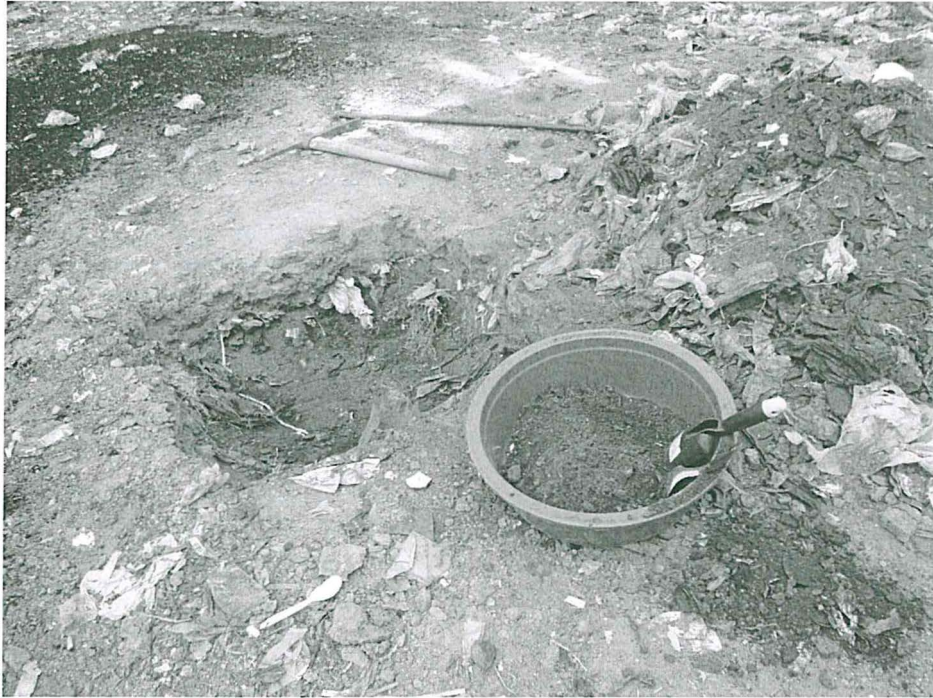
Fotografía 5. Punto de muestreo SU – E4, suelo de relleno con presencia de residuos sólidos, calicata de 80 cm x 80 cm con 65 cm de profundidad. Botadero de la Municipalidad de la ciudad de Tumbes, 14-05-2014.

"Decenio de las Personas con Discapacidad en el Perú" "Año de la Promoción de la Industria Responsable y del Compromiso Climático"