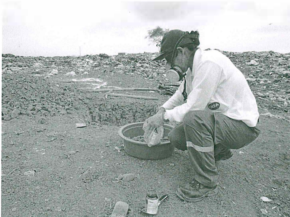
Fotografía 8. Colecta de muestra de suelo para análisis de metales. Punto de muestreo SU – E6, calicata de 80 cm x 80 cm con 45 cm de profundidad. Botadero de la Municipalidad de la ciudad de Tumbes, 14-05-2014