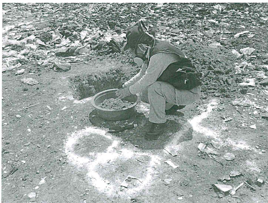
Fotografía 9. Colecta de muestra de suelo para análisis de orgánicos. Punto de muestreo SU – E8, calicata de 80 cm x 80 cm con 60 cm de profundidad. Botadero de la Municipalidad de la ciudad de Tumbes, 15-05-2014