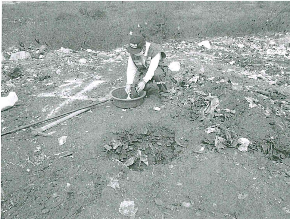
Fotografía 4. Punto de muestreo SU – E3, suelo de relleno con presencia de residuos sólidos, calicata de 80 cm x 80 cm con 65 cm de profundidad. Botadero de la Municipalidad de la ciudad de Tumbes, 14-05-2014.