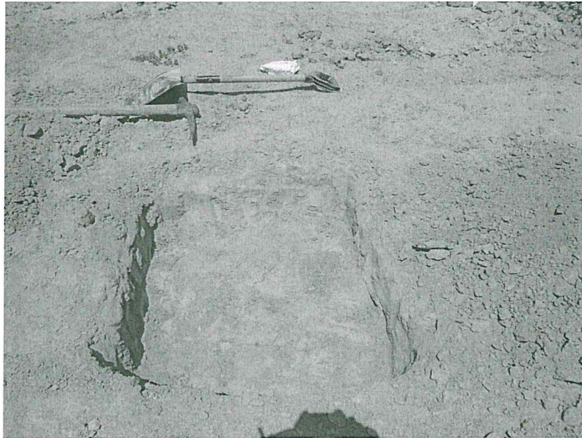
Fotografía 1. Punto de muestreo SU – B1, suelo basal, calicata de 80 cm x 80 cm con 20 cm de profundidad. Botadero de la Municipalidad de la ciudad de Tumbes, 13-05-2014.

"Decenio de las Personas con Discapacidad en el Perú" "Año de la Promoción de la Industria Responsable y del Compromiso Climático"