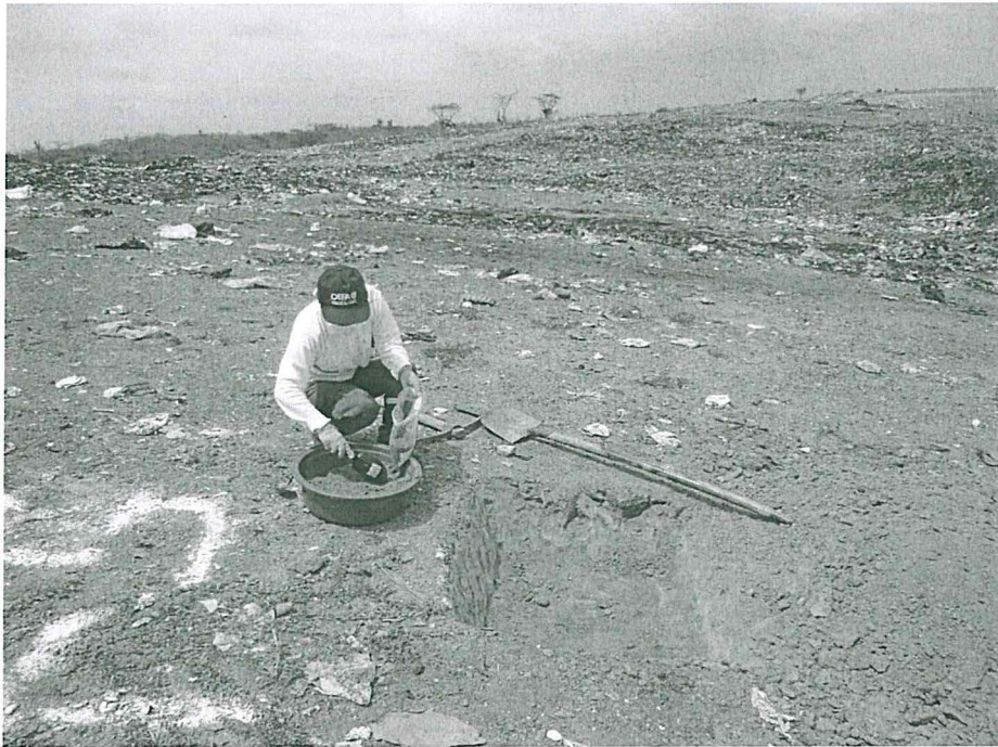
Fotografía 7. Colecta de muestra de suelo para análisis de metales. Punto de muestreo SU – E5, calicata de 80 cm x 80 cm con 30 cm de profundidad. Botadero de la Municipalidad de la ciudad de Tumbes, 14-05-2014

"Decenio de las Personas con Discapacidad en el Perú" "Año de la Promoción de la Industria Responsable y del Compromiso Climático"