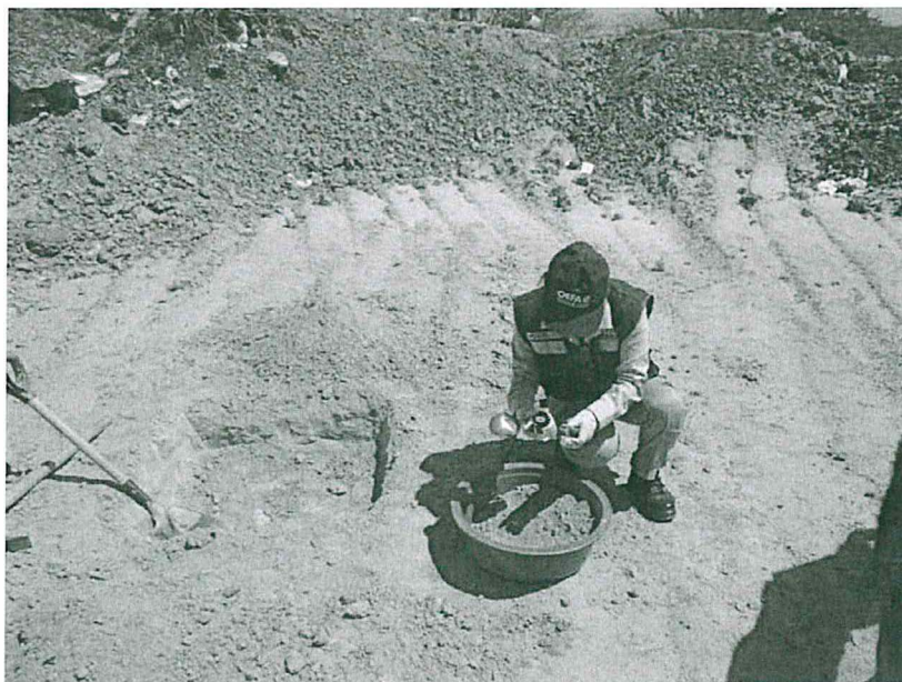
Fotografía 2. Colecta de muestra de suelo para análisis de orgánicas en el punto de muestreo SU – B1. Botadero de la Municipalidad de la ciudad de Tumbes, 13-05-2014