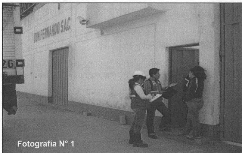
Fotografía N° 1