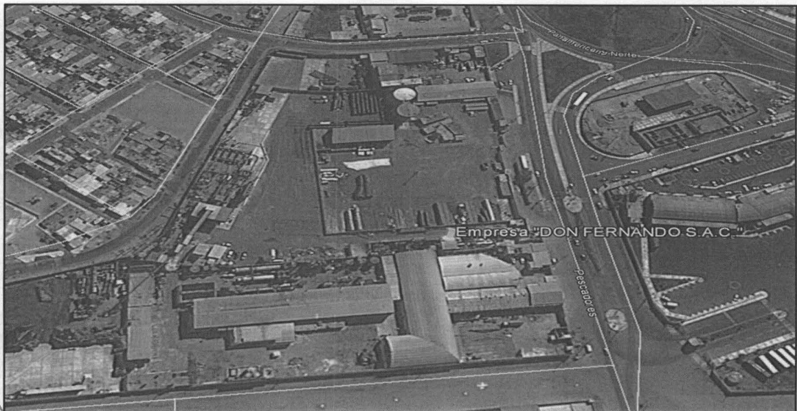
Figura N° 1. Ubicación del punto de monitoreo - Empresa "DON FERNANDO S.A.C."

La empresa "DON FERNANDO S.A.C.", se encuentra ubicada en el distrito de Chimbote, provincia del Santa, departamento de Ancash.