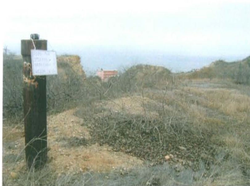
Fotografía N° 2. La zona evaluada se encuentra encima de loma, a pie de barranco, a 150 m aproximadamente de la batería de la empresa Petromont.