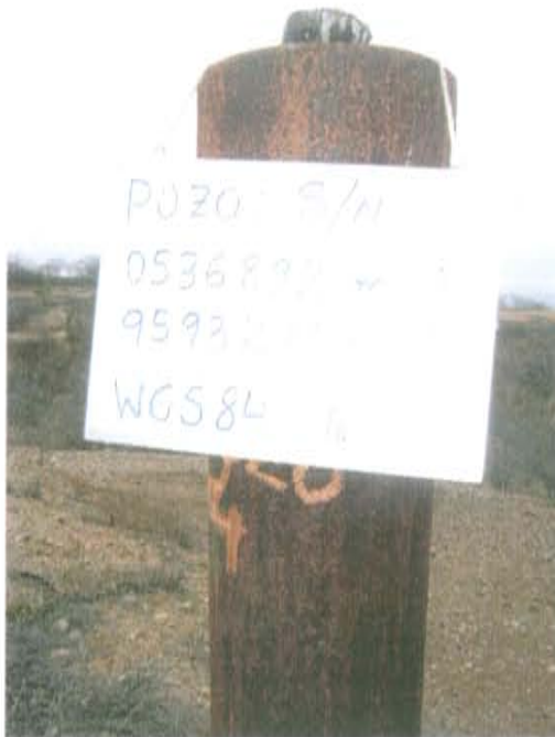
Fotografía N° 1. Pozo inactivo, con casing que sobresale 1,6 m sobre el nivel de la superficie del suelo, con cemento en su interior.

"Decenio de las Personas con Discapacidad en el Perú" "Año de la Promoción de la Industria Responsable y del Compromiso Climático"